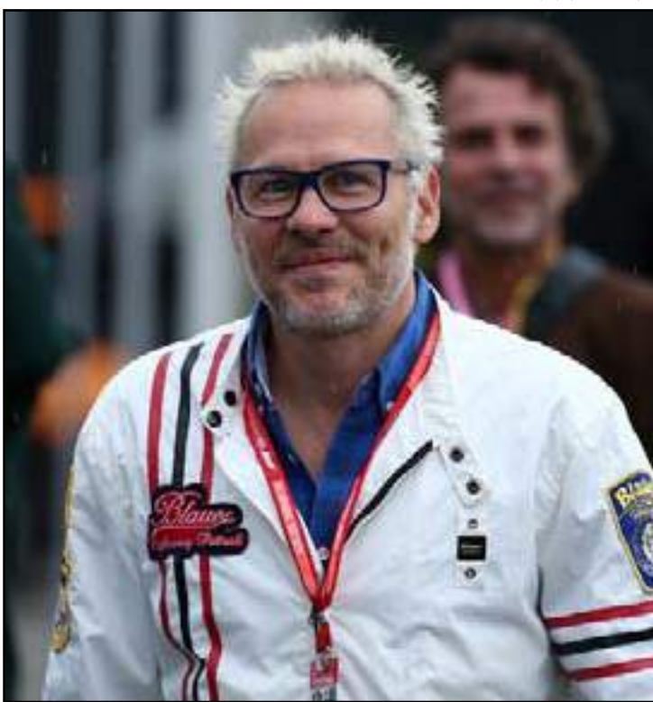
Jacques Villeneuve costuma ter opiniões fortes e polêmicas

Aprova do último domingo, vencida por Max Verstappen, da RBR, foi a primeira na qual um piloto conseguiu desbancar a hegemonia da Mercedes na temporada, que até então, já havia conquistado quatro triunfos nas quatro etapas anteriores. A equipe austríaca, que colocou pneus duros para o começo da corrida, deu um "nó tático" na principal rival, que só conseguiu garantir o terceiro e segundo lugares ao seguirem uma estratégia de duas paradas e largarem com pneus médios. Max chegou a fazer uma segunda troca, mas para evitar perder a liderança para Valtteri Bottas, o que deu certo - Lewis Hamilton só fez a segunda parada no fim da prova.