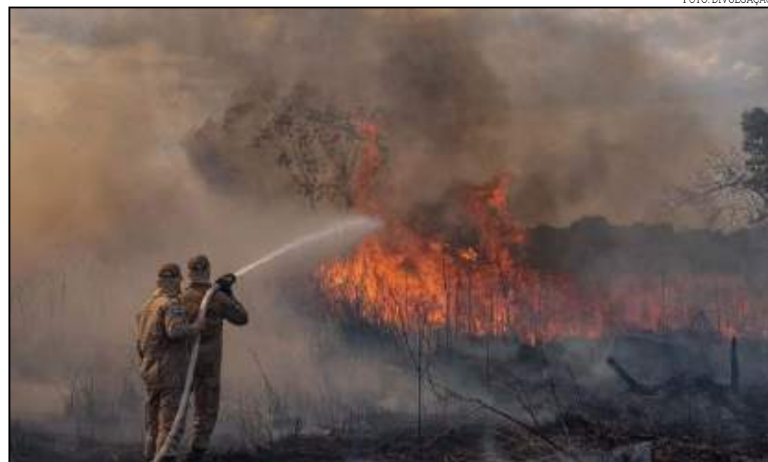
Fogo já queimou 31,5% da Reserva Particular do Patrimônio Natural

O principal trabalho do dia foi molhar a vegetação mais próxima do hotel, uma ampla estrutura com 142 quartos às margens do rio Cuiabá. No início da tar-