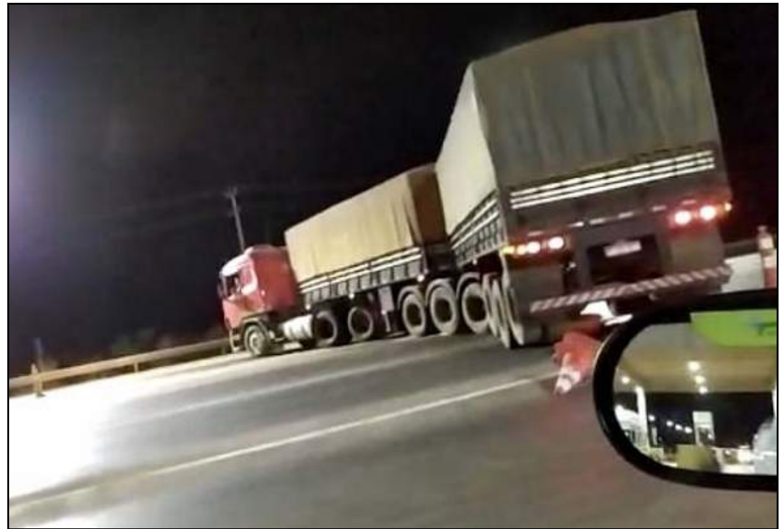
Caminhoneira atravessou carreta na praça de pedágio

"Tiraram eles (policiais) lá da base para vir aqui fazer não sei o que. Chegaram muito zangados. Estão querendo prender meu caminhão e me prender. Estou reivindicando um direito meu, de cidadã que paga impostos. Não vou arredar o pé. Vou até o fim".