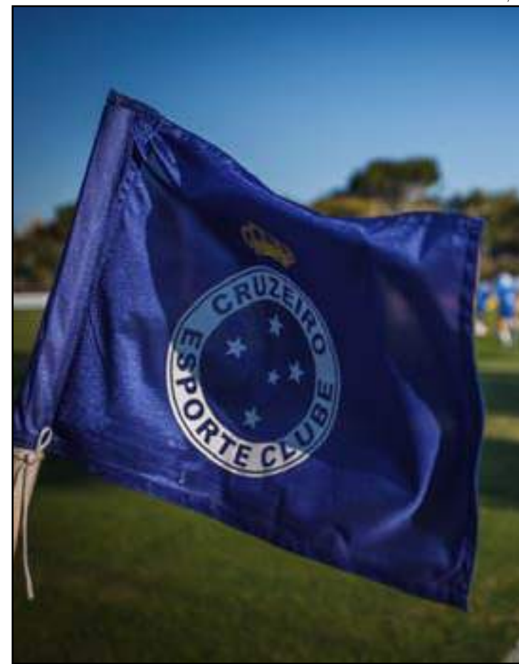
Valores de cobranças são de R$ 16 milhões

Recentemente, o Cruzeiro viu R$ 9,8 milhões depositados em juízo em ação de cobrança da Minas Arena serem alvos de solicitação da União para que o dinheiro seja usado para abater a dívida tributária, o que fez cair por terra o acordo entre clube e o Mineirão. Este cenário serve como alerta diante da licitação de venda da Sede Campestre 2, uma vez que a alienação tem objetivo de abater dívidas na Fifa, mas pode virar alvo de "arresto" da União.