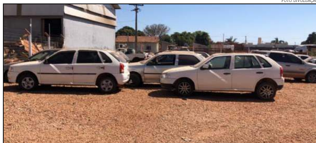
Veículos que irão a leilão foram retidos em fiscalizações

O valor arrecadado com o leilão é totalmente direcionado ao pagamento de débitos do órgão, como o custeio do leilão, diárias de pátio, licenciamentos, IPVA, financiamentos, multas e caso sobre algum valor, este é revertido aos proprietários.