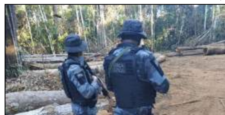
Um dos focos da operação foi o enfrentamento aos crimes ambientais de extração ilegal de madeira

Brigadistas do Sesc utilizam caminhões-pipa e abafadores para controlar o incêndio na vegetação de cerrado. Um deles passou mal e precisou de atendimento médico.