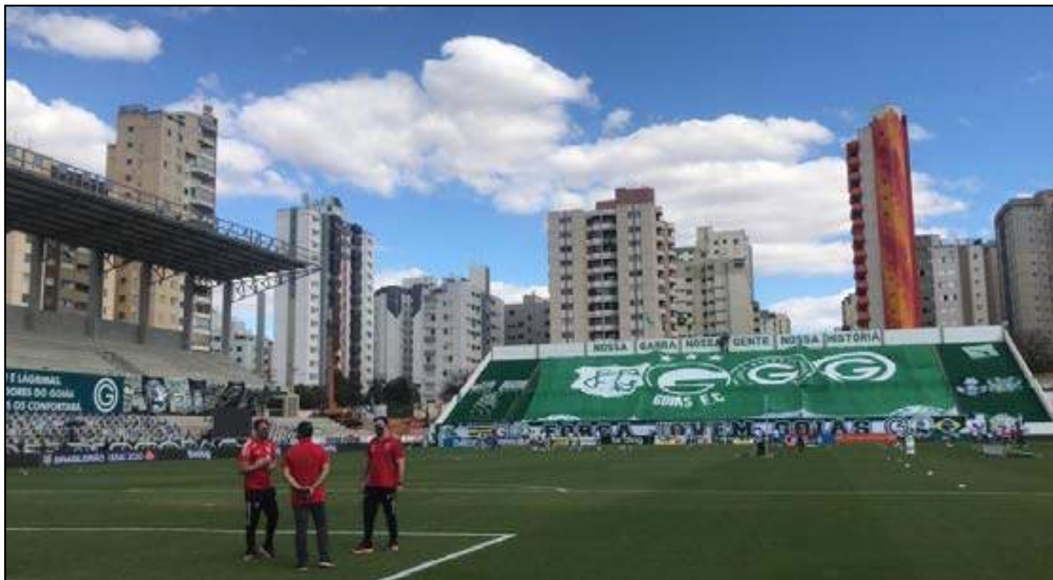
Funcionários do São Paulo aguardam definição do adiamento do jogo contra o Goiás

As estatísticas mostram que, de modo geral, Goiânia não vive um panorama iso-