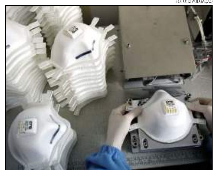
Isenção abrange itens como álcool em gel e máscaras de proteção

A isenção de ICMS vai abranger itens como álcool em gel, máscaras de proteção, protetores faciais e propilenoglicol, entre outros. Também envolve produtos e serviços necessários para prevenir o contágio pelo novo coronavírus nos locais de votação.