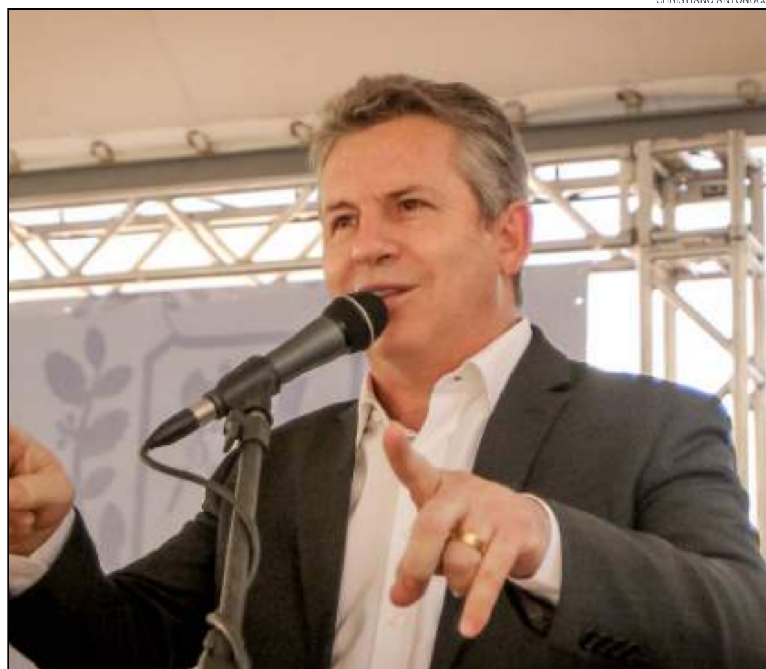
Governador não gostou da decisão do trio do DEM