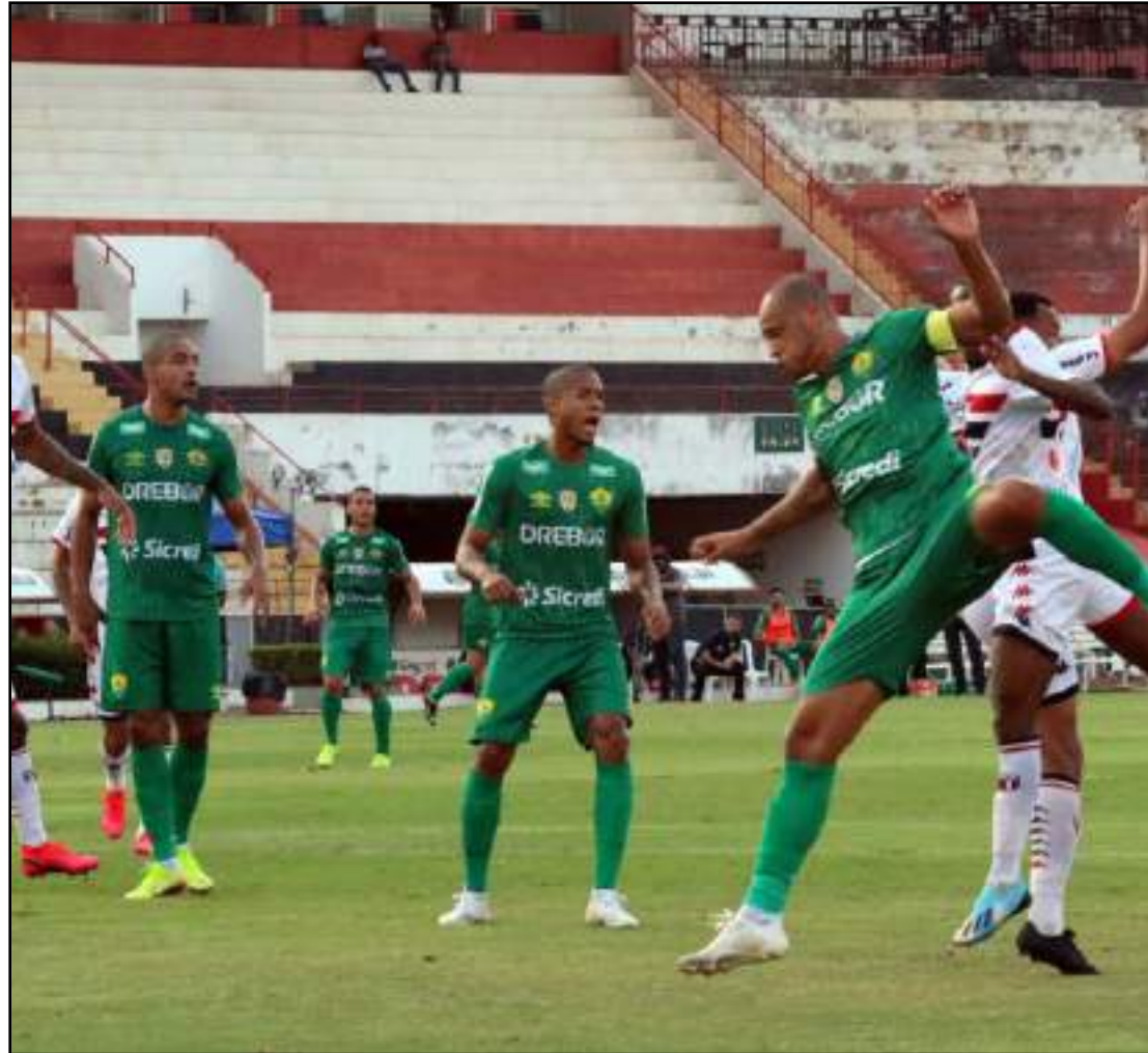
Cuiabá seguiu empate com o Bota-SP fora de casa

O empate em 1 a 1 com o Botafogo-SP, fora de casa, na última terça (1º), garantiu um pontinho precioso para que o Cuiabá permanecesse pela segunda rodada consecutiva como líder da Série B do Campeonato Brasileiro. Entretanto, já vê na sua cola, com os mesmos 14 pontos, Paraná e América-MG, que têm saldo de gols inferior (5, 4 e 3, respectivamente), e possuem um jogo a menos – a partida contra o CSA/AL foi adiada em função de os jogadores da equipe alagoana terem sido identificados com o novo coronavírus. Com uma campanha de 4 vitórias e 2 empates, o Dourado é a única equipe invicta até agora na Segundona. Agora, o próximo desafio também é longe de casa. Na 8ª rodada da Série B, a equipe visita o Vitória, no Barradão, no sábado (5), às 15h30. No dia anterior, o Paraná encara o Figueirense fora e pode assumir a liderança momentaneamente. Inclusive, os catarinenses são os próximos adversários do Cuiabá na Arena Pantanal, no dia 8 de setembro.