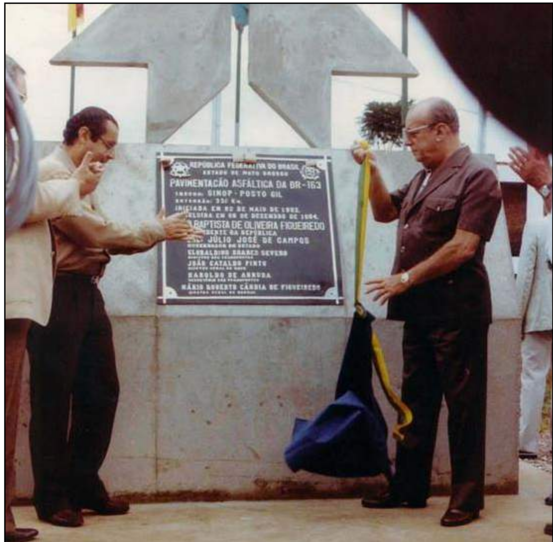
Presidente Figueiredo em inauguração em Sinop

*Professor da SEDUC-MT, Escola Estadual Professora Edeli Mantovani