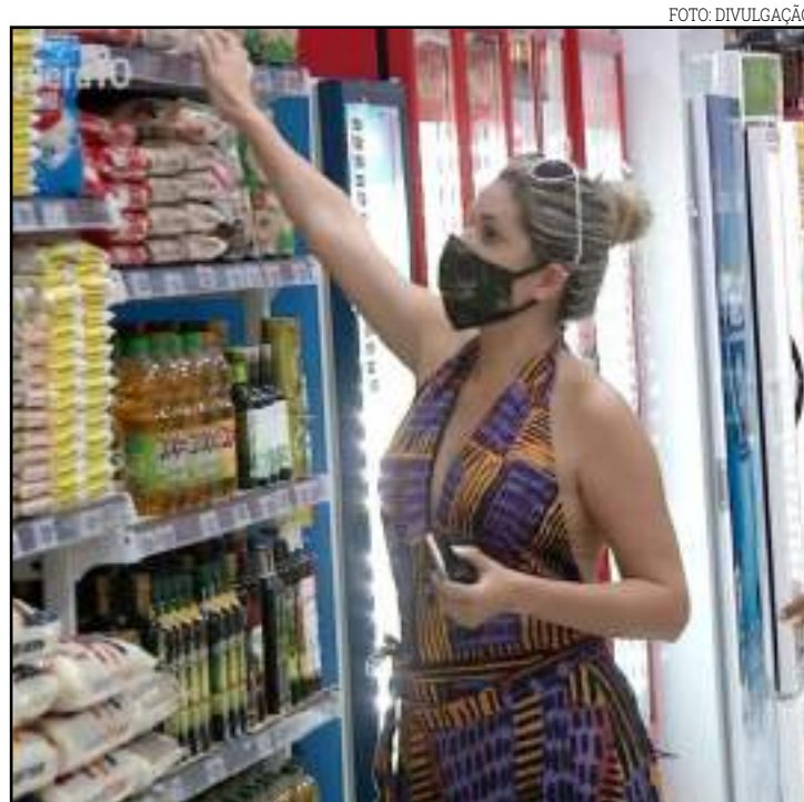
Aumento é explicado pois exportações do cereal aumentaram

A alta nos preços do feijão e do arroz fez o valor da cesta básica de alimentos disparar também em Rondonópolis. Um levantamento do Procon mostrou que cestas básicas mais completas, geralmente com 39 itens, aumentaram 40%.