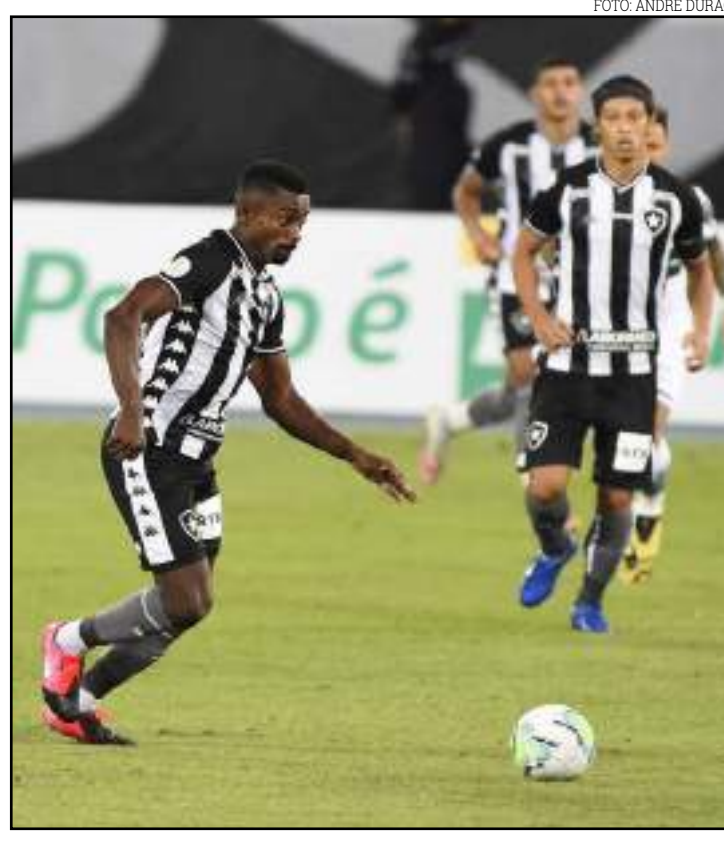
Kalou e Honda fizeram uma boa parceria logo no primeiro lance do jogo