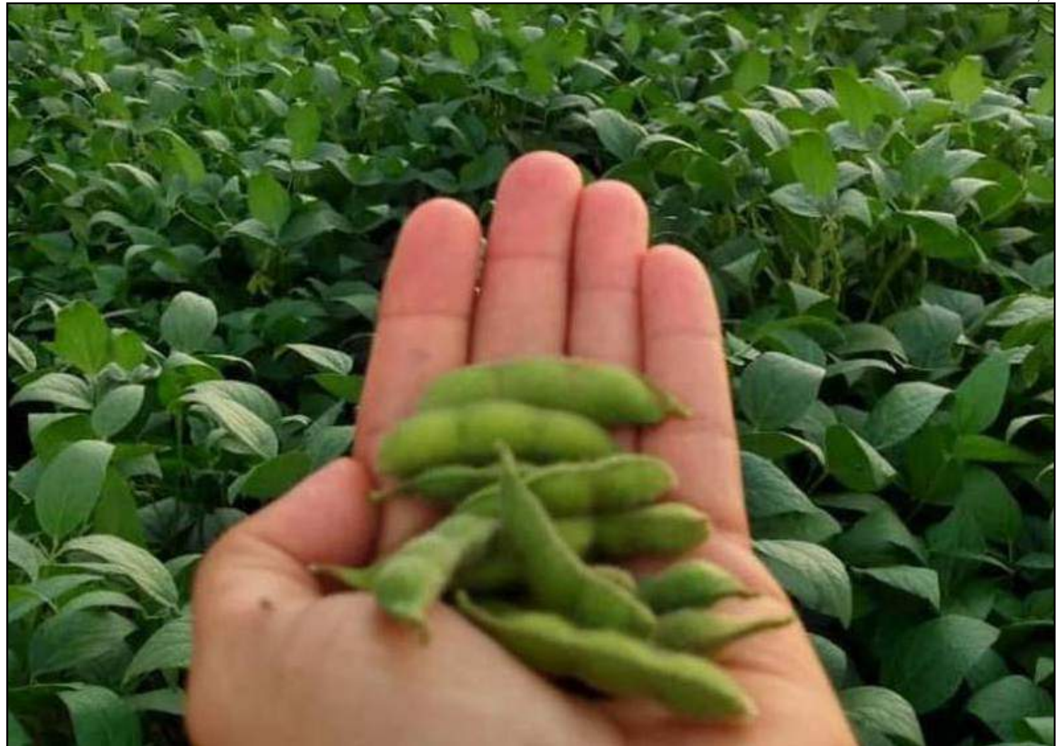
Soja é o principal produto exportado

De janeiro a julho deste ano, o volume de carne suína exportada para a China dobrou em relação ao ano passado.