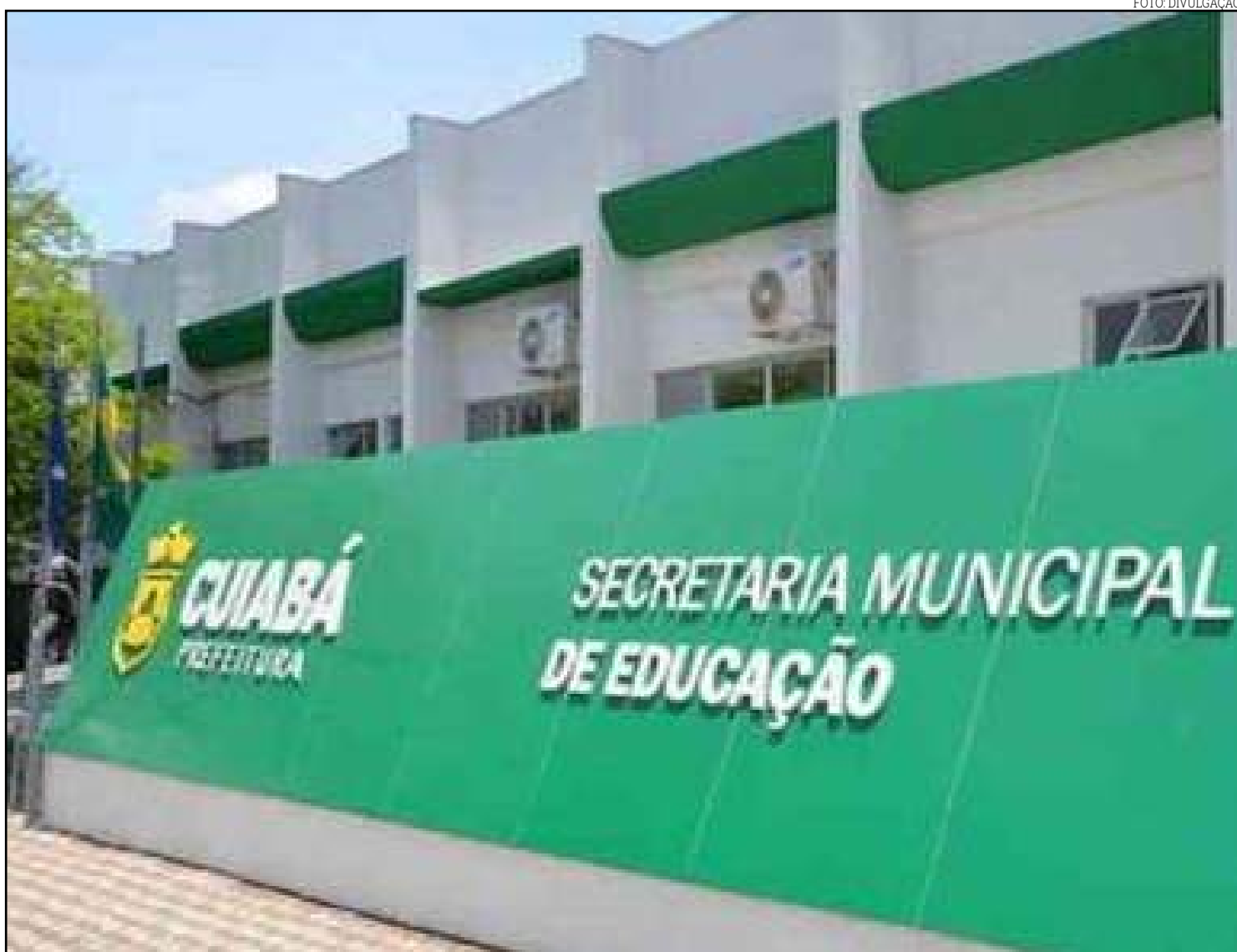
Foram Cumpridos quatro mandados de busca e apreensão