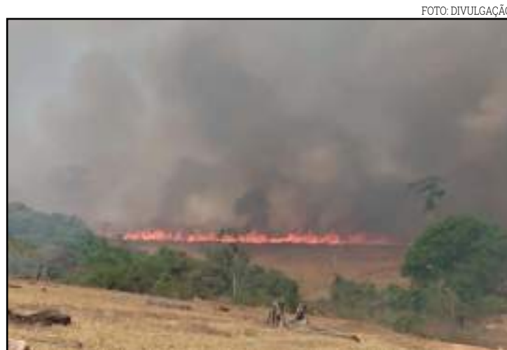
Fogo se alastrou na quarta em Nova Aliança

Até a poucos dias atrás uma equipe do 3º Batalhão do Corpo de Bombeiros de Rondonópolis estava na cidade, porém, está combatendo incêndio em Santiago do Norte, no município de Paranatinga.