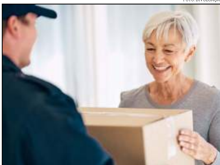
Empresas que descumprirem a lei pagarão multa a partir de R$ 500

“É importante destacar que o presente projeto é