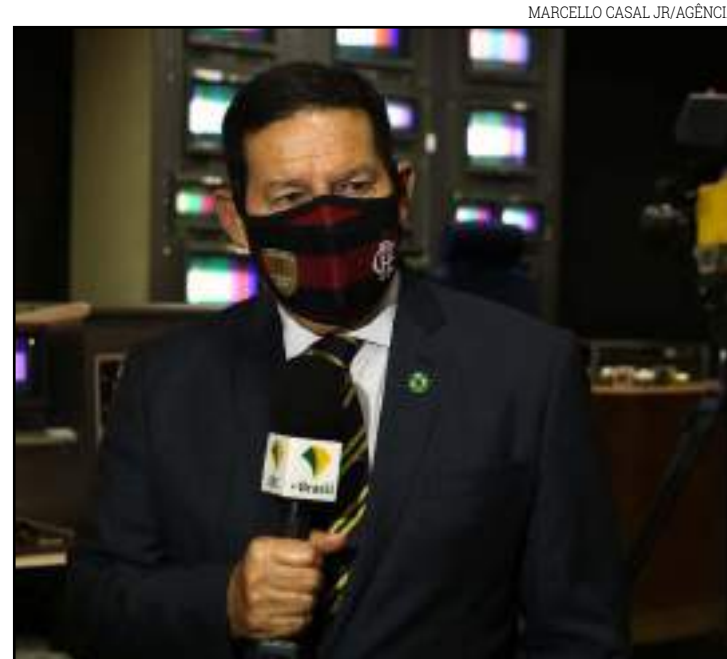
A preparação da terra com queimada é arcaico e não tem mais espaço no mundo