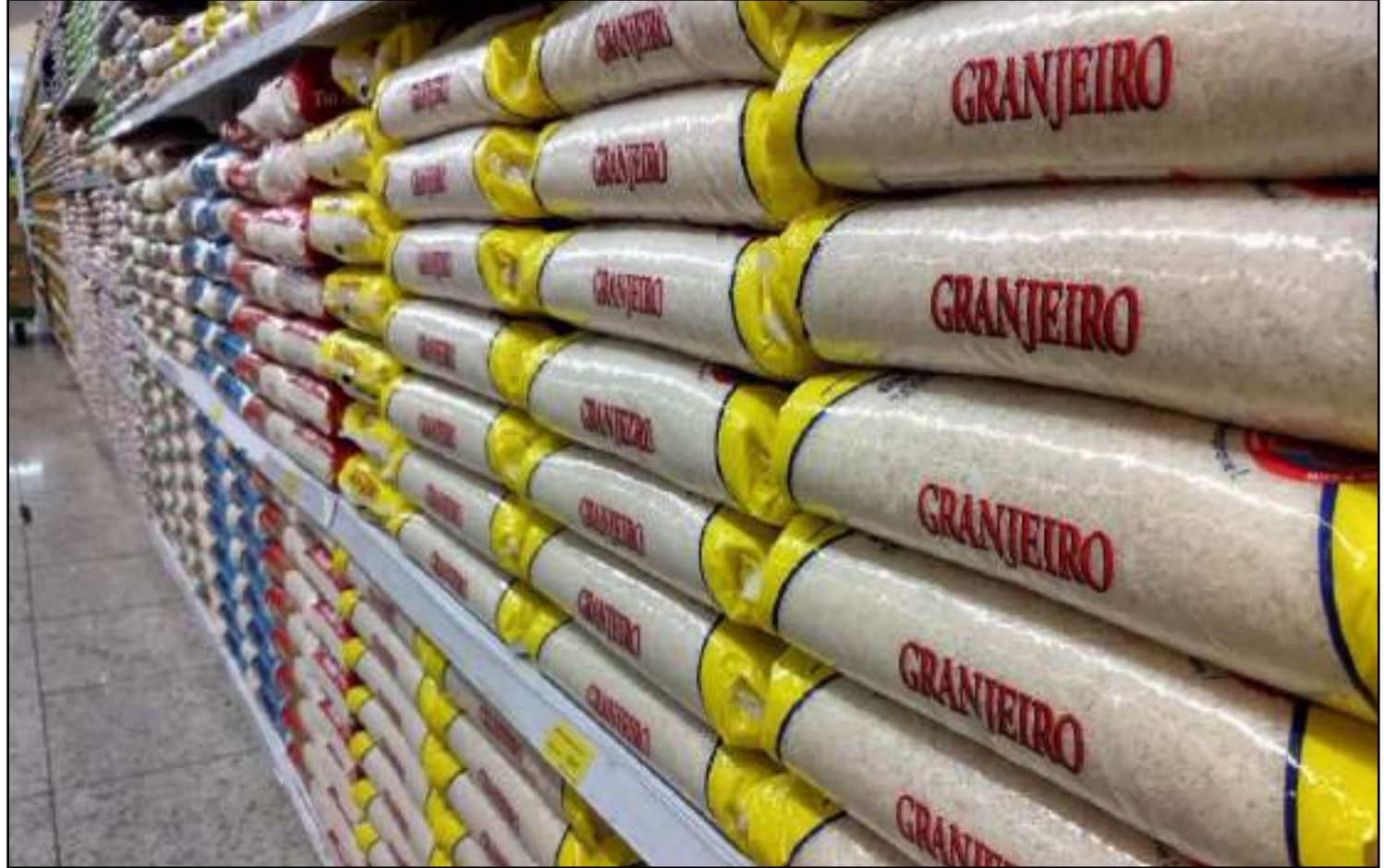
Arroz teve o preço elevado nos supermercados

Em conversa com apoiadores na última semana, o presidente da República, Jair Bolsonaro, assegurou que