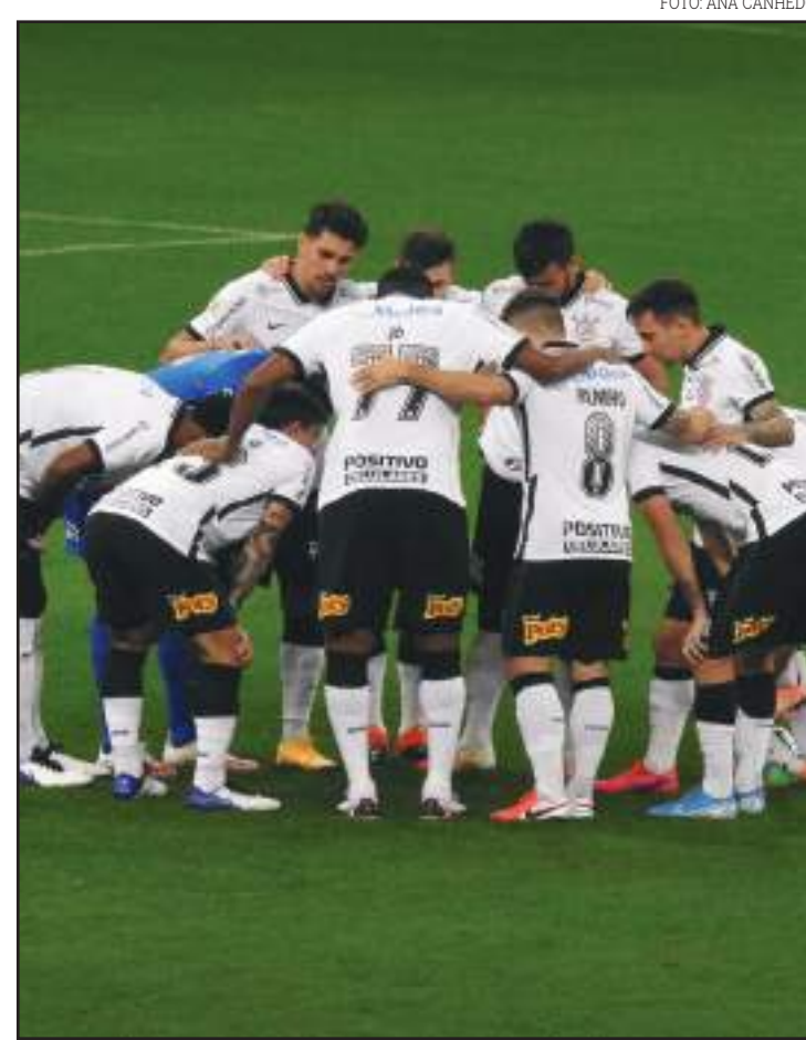
Elenco do Corinthians antes de duelo contra o Botafogo

e o lançamento de fogos de artifício. A Polícia Civil instaurou inquérito para apurar a invasão ao Estádio Orlando Scarpelli.