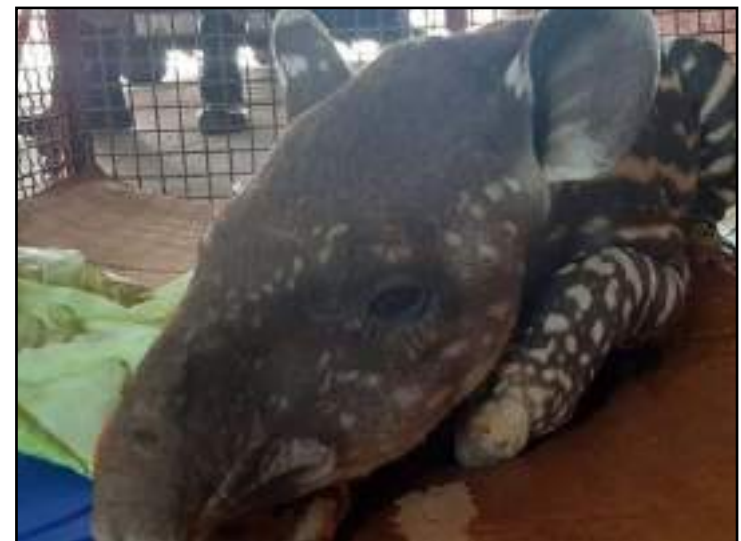
Filhote de anta foi resgatado na MT-242