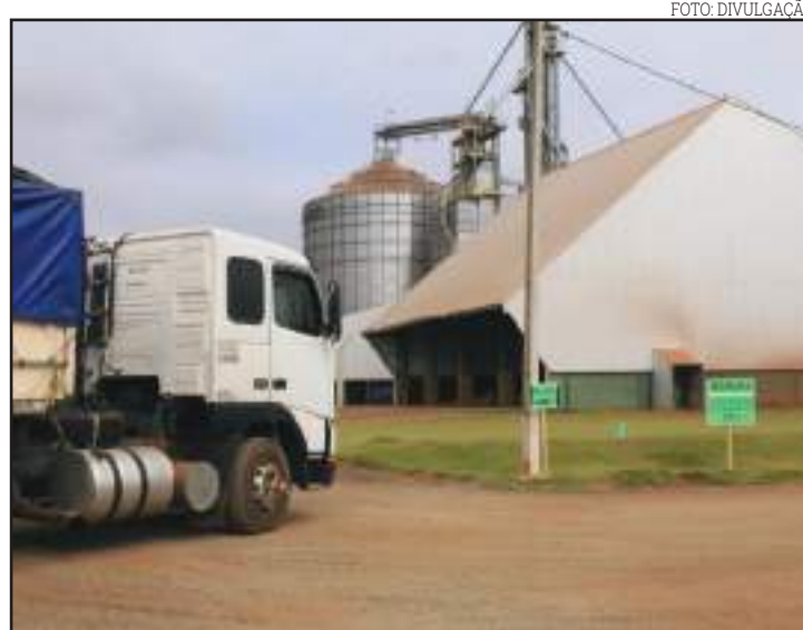
Valor de escoamento da produção: superior a R$ 26 milhões

O transporte de grãos gera emprego e renda. Segundo os motoristas en-