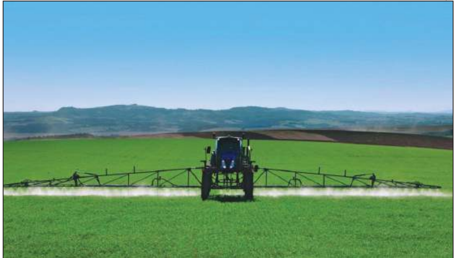
PEC pode fazer custo da produção aumentar demais

O levantamento feito pelo Imea considerou a alíquota de 25% para a compra de insumos e venda da safra (conforme previsto na PEC 45/2019), a utilização do sistema de compensação de créditos e, consequentemente, a queda do Fundo Estadual de Transporte e Habitação (Fethab), que precisaria ser revisto caso a proposta seja aprovada. No caso da soja, a despesa com a compra de insumos saltaria 11,35% (R$ 448,01 por hectare). No milho, o aumento chegaria a 10,14% (R$ 304,59 por hectare) e, na pecuária bovina, o incremento nos