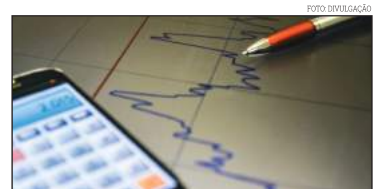
Para o próximo ano, a expectativa é de crescimento de 3,5%, diz BC

freu queimaduras no corpo. O produtor também teve a propriedade praticamente destruída. Segundo ele, dez anos de investimentos viraram cinza em poucas horas. "Meu gado agora sem cerca, boi morrendo, outras vacas caindo a unha, com os pés todos queimados. Minha lavoura de caju, maracujá, toda queimada, toda destruída. Se viesse uma ajuda, seria bem-vinda, porque eu ainda pretendo produzir aqui. Deus vai ajudar a gente", diz.