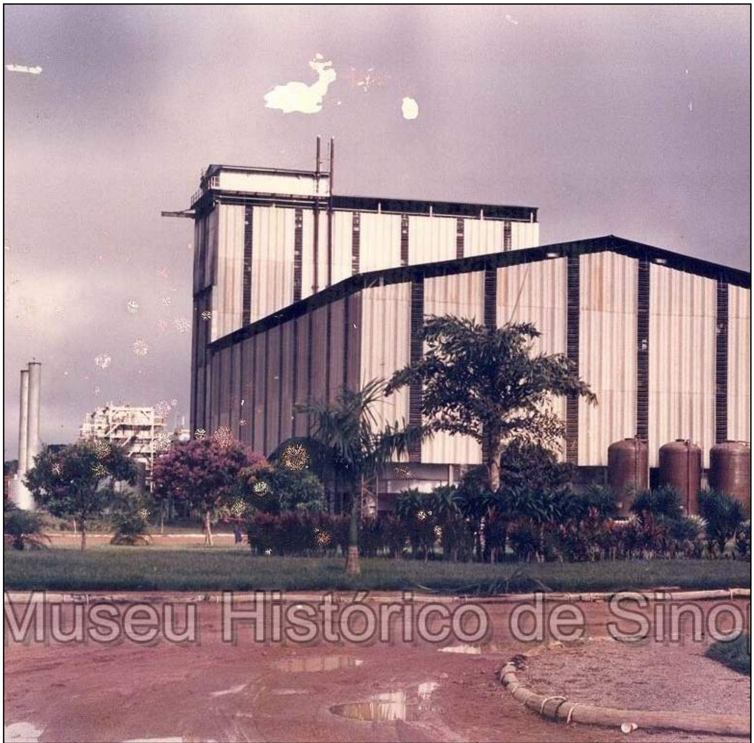
Sinop Agroquímica foi fator de atração de muitos braços para Sinop

*Professor da SEDUC-MT, Escola Estadual Professora Edeleli Mantovani