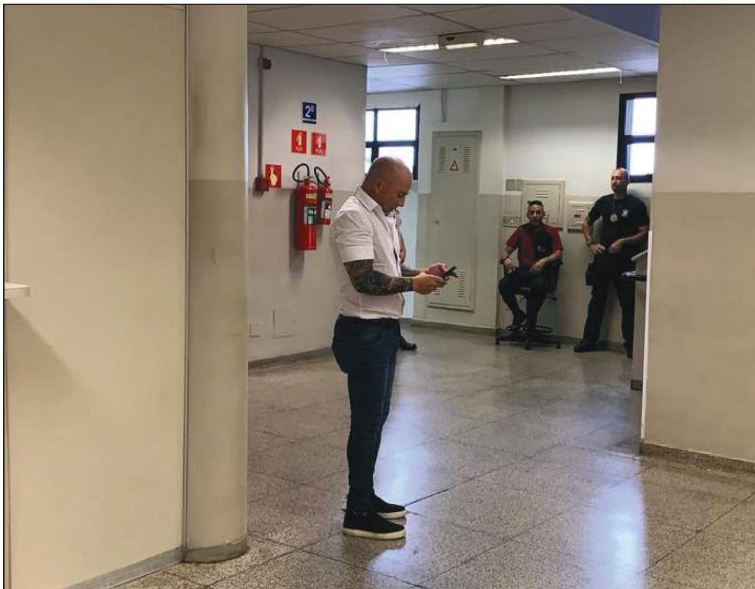
Jorge Sampaoli após a audiência com o Santos

A única vez que pessoas representando o Santos e Jorge Sampaoli se encontraram depois da passagem de 2019 foi na audiência do início de fevereiro. Agora, nesta quarta-feira e quinta-feira, vão se enfrentar dentro e fora de campo.