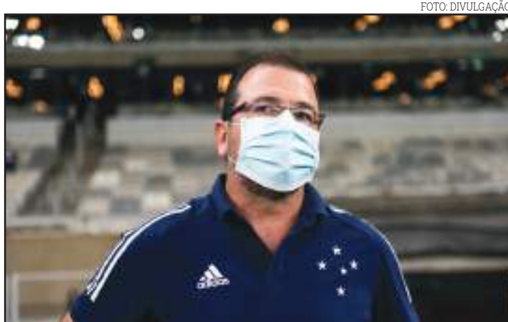
Treinador deixa o comando da Raposa após 12 partidas

Com o trabalho que pode só ser visto pela torcida a partir de 26 de julho, quando o futebol foi retomado após a paralisação