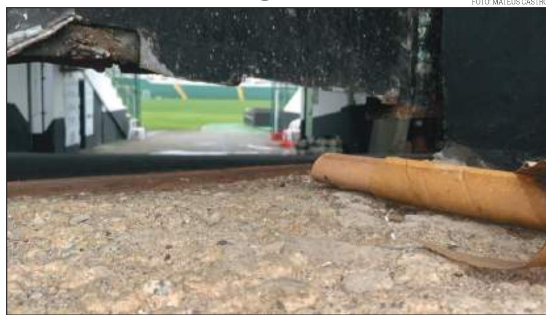
Invasão dos torcedores no Orlando Scarpelli

"Eu, como treinador do Figueirense, é a primeira vez que eu me manifesto sobre o acontecido. Uma tristeza muito grande. Lamentável esse episódio. Invasão do campo, do nosso estádio, da nossa casa. Onde tivemos jo-