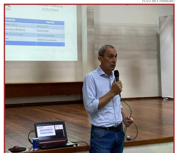
Prefeito de Lucas do Rio Verde assume Consórcio

O Consórcio Intermunicipal de Desenvolvimento Econômico e Ambiental (Cidesa) do Alto Teles Pires tem como objetivo fortalecer os municípios que compõem a região Vale do Teles Pires, buscando discutir e resolver pautas comuns a toda região. Atualmente, 15 municípios compõem o Cidesa: Cláudia, Feliz Natal, Ipiranga do Norte, Itanhanga, Lucas do Rio Verde, Nova Mutum, Nova Ubiratã, Santa Carmem, Santa Rita do Trivelato, São José do Rio Claro, Sinop, Sorriso, Tapurah, União do Sul e Vera.