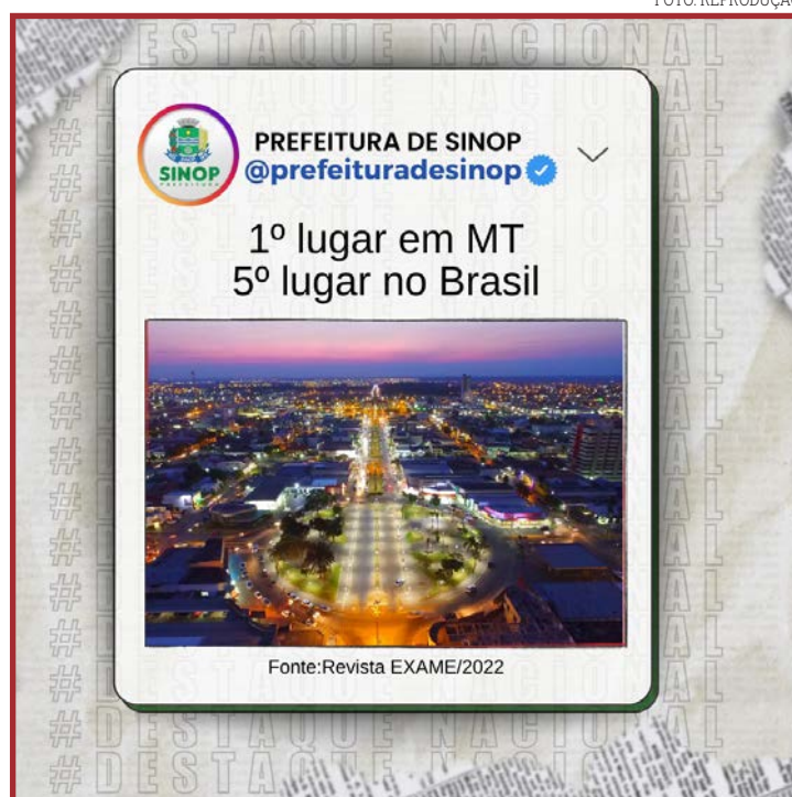
Sinop atingiu 4.345 pontos no Índice de Qualidade Mercadológica (IQM)

A outra cidade do estado que ficou mais próxima foi Cuiabá na vigésima posição com 4.031 pontos. Rondonópolis na trigésima quinta posição, tangará da serra na quinquagésima quinta e Várzea Grande na posição de número 84 fecham a relação das cidades de mato grosso entre as 100 melhores.