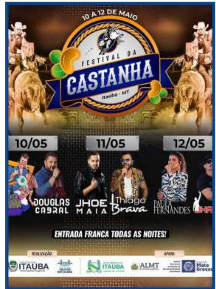
Evento será realizado de 10 a 12 de maio