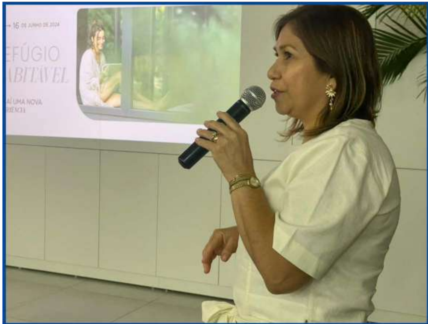
Mostra deste ano será edição comemorativa a uma década