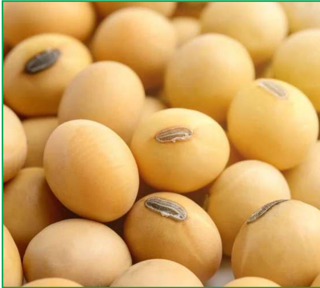
Projeção da soja futura decorre diante das perspectivas do fenômeno La Niña

“Já para o consumo da oleaginosa em Mato Grosso, espere-se uma alta de 2,76% em relação à safra passada, projetado em 12,47 milhões de toneladas, devido expectativa de uma maior demanda das esmagadoras devido a ampliação na capacidade das indústrias”, destaca o Imea.