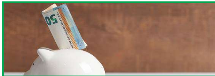
Informação foi confirmada nesta quarta pelo Banco Central

Em março, a poupança apresentou mais depósitos do