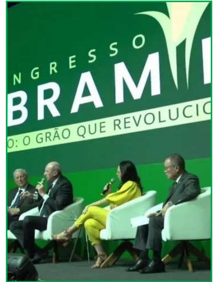
Questões ligadas à agricultura precisam ser revistas