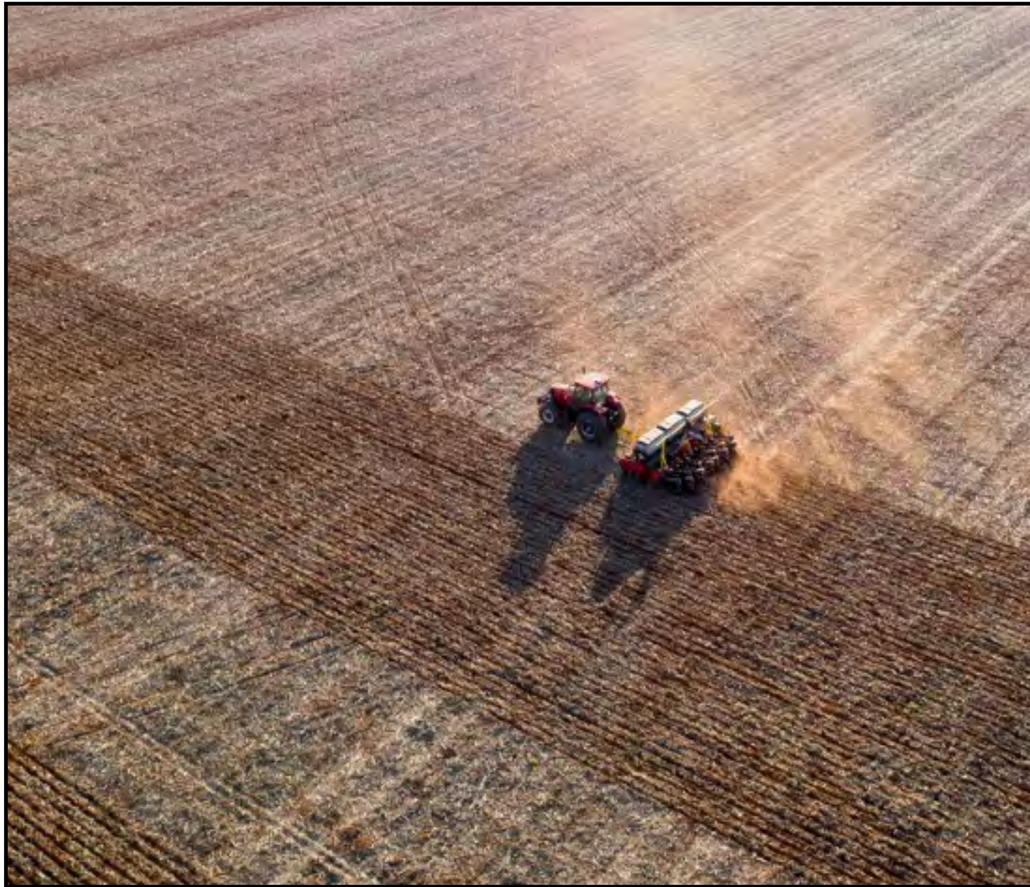
Chuvas irregulares ainda preocupam produtores

Mesmo com as dificuldades, as condições climáticas tendem a melhorar gradualmente, permitindo que a semeadura avance com mais consistência até o final de novembro. Paralelamente, o plantio do milho verão 2025/26 chegou a 85% da área prevista para o Centro-Sul do país, ante 72% na semana anterior e 87% no mesmo período do ano passado, conforme dados da AgRural. O avanço mais expressivo foi registrado em São Paulo e Minas Gerais, onde as condições de umidade favoreceram o ritmo de trabalho. Em contrapartida, Goiás ainda apresenta atrasos por conta das chuvas irregulares e da prioridade dos produtores com o plantio da soja. A expectativa é que, com o retorno gradual das chuvas, o ritmo de plantio da soja se aproxime da média histórica até o final de novembro. No entanto, especialistas alertam que a distribuição irregular das precipitações ainda pode trazer impactos sobre o desenvolvimento inicial das lavouras e, consequentemente, sobre a produtividade da safra 2025/26.