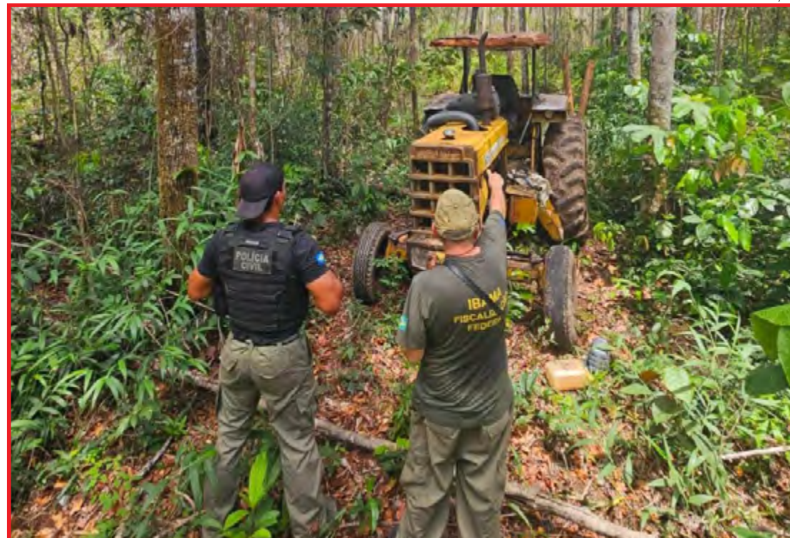
6 pessoas conduzidas, 6 caminhões apreendidos e 5 tratores inativados

Nas últimas semanas, as operações conjuntas se concentraram principalmente na repressão ao comércio ilegal da madeira Itaúba, conhecida popularmente como