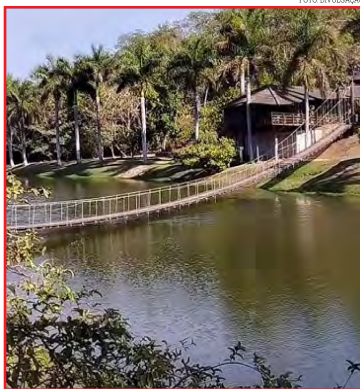
Meios de hospedagem registraram ocupação mínima de 78% neste fim de semana

A Secretária de Desenvolvimento Econômico e Turismo ressalta que continuará monitorando os indicadores turísticos e adianta que a partir de 2026, Sorriso contará com o Observatório do Turismo de Sorriso ligado a Rede Brasileira de Observatórios de Turismo (RBOT).