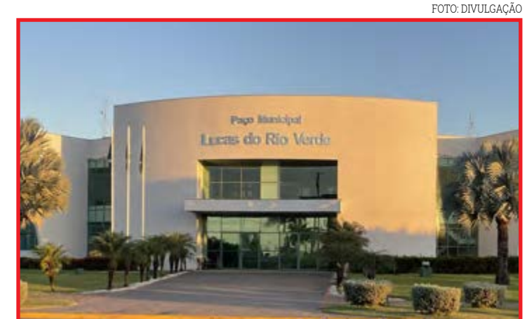
Medida foi estabelecida pelo Decreto Nº 7.368/2025

Já no dia 21, a unidade Jardim Primavera atenderá das 7h s 11h e das 13h às 17h, incluindo urgências de odontologia. A UBS Parque das Emas atenderá normalmente das 07h às 11h e das 13h às 17h, com farmácia aberta para a entrega de medicamentos. Nesse dia, o Laboratório Municipal atenderá das 6h às 12h e os Caps Adulto e Infantil atenderão das 7h às 11h. O Espaço Saúde também atenderá no dia 21 de novembro, das 7h às 11h e das 13h às 17h, com consultas especializadas previamente agendadas.