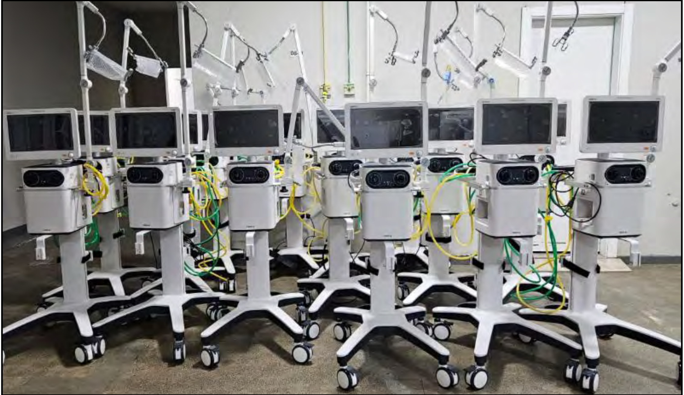
Unidade passa a contar com 28 ventiladores pulmonares