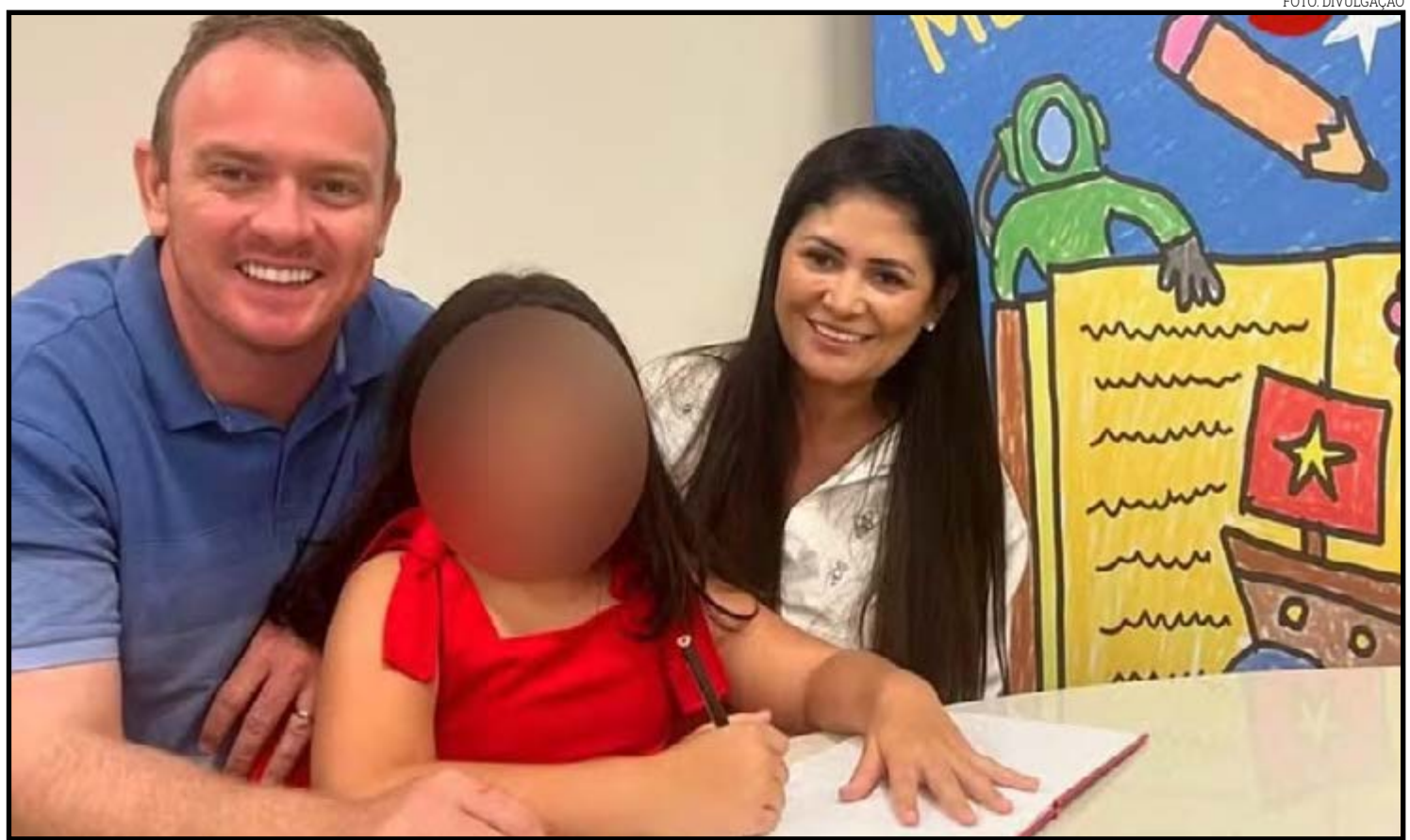
Engenheiro agrônomo suspeito de ter matado a esposa e de tentar matar a própria filha

Gleici Oliboni foi morta com golpes de faca. Já a filha, também esfaqueada, foi socorrida e transferida para um hospital particular de Cuiabá. Ela ficou internada durante