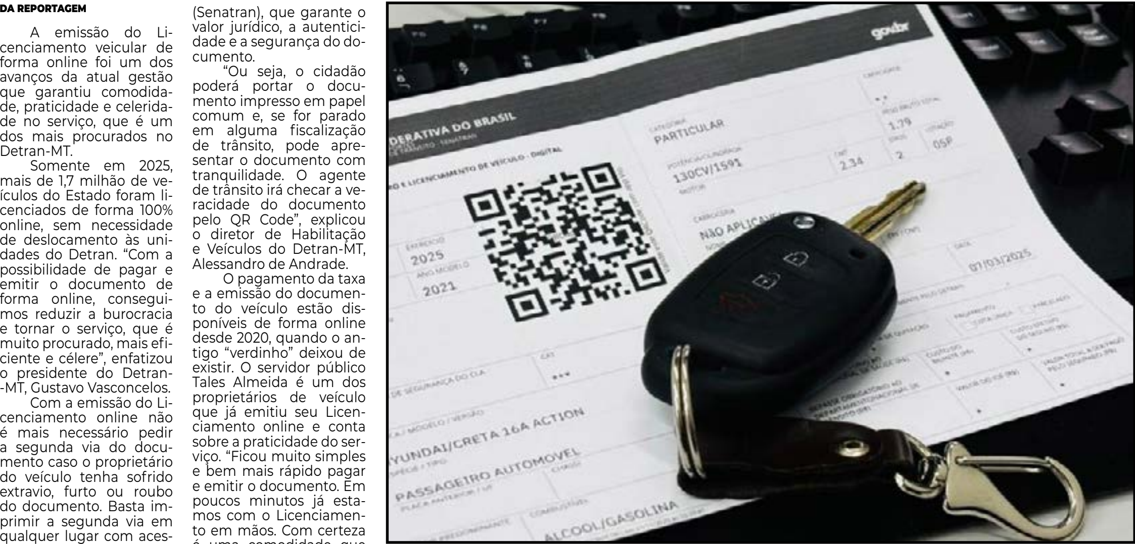
Licenciamento em papel A4

NESTE ANO. Emissão digital do licenciamento veicular oferece mais comodidade, praticidade e agilidade