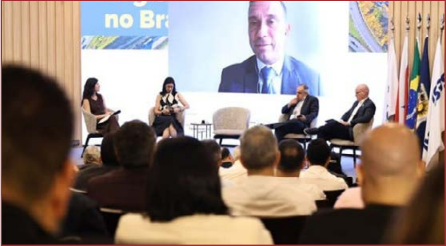
Ferrogrão tem apoio, mas teima em não sair do papel

O plano visa orientar investimentos públicos e privados nas próximas décadas, com foco na multimodalidade, redução de desigualdades regionais e aumento da competitividade. Entre os avanços concretos já em andamento destacam-se a concessão do Sistema Rodoviário BR-364 (RO), entre Porto Velho e Vilhena, em Rondônia,