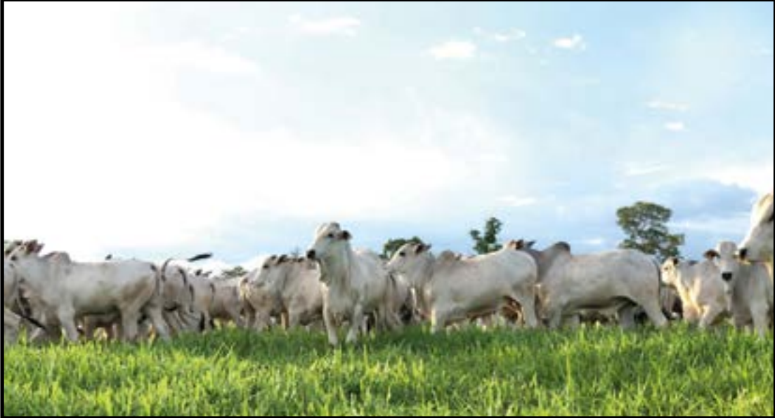
Evolução é sustentada por um manejo mais técnico

“Este bioestimulante é um promotor de recuperação e rápido crescimento do pasto após o pastejo ou no início das chuvas, possibilitando retorno antecipado dos ani-