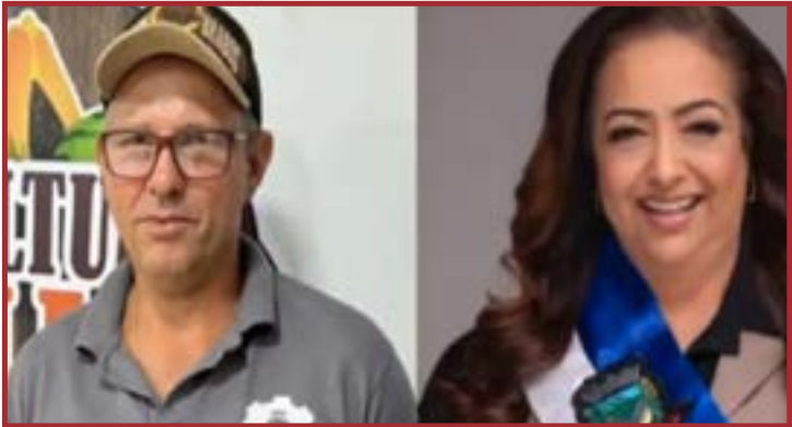
Por 8x2 votos, parlamentar perdeu o mandato após xingar prefeita