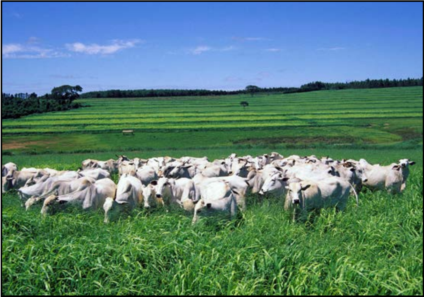
Pastos bem manejados são fundamentais para garantir a boa nutrição do rebanho

A companhia oferece sementes e tecnologias voltadas para pastagens mais resistentes, nutritivas e eficientes, apoiando pecuaristas na construção de sistemas mais produtivos, rentáveis e alinhados às diretrizes da pecuária de baixo carbono. “Quando os animais recebem um alimento de melhor qualidade, consequentemente há uma menor emissão de GEE”, acres-