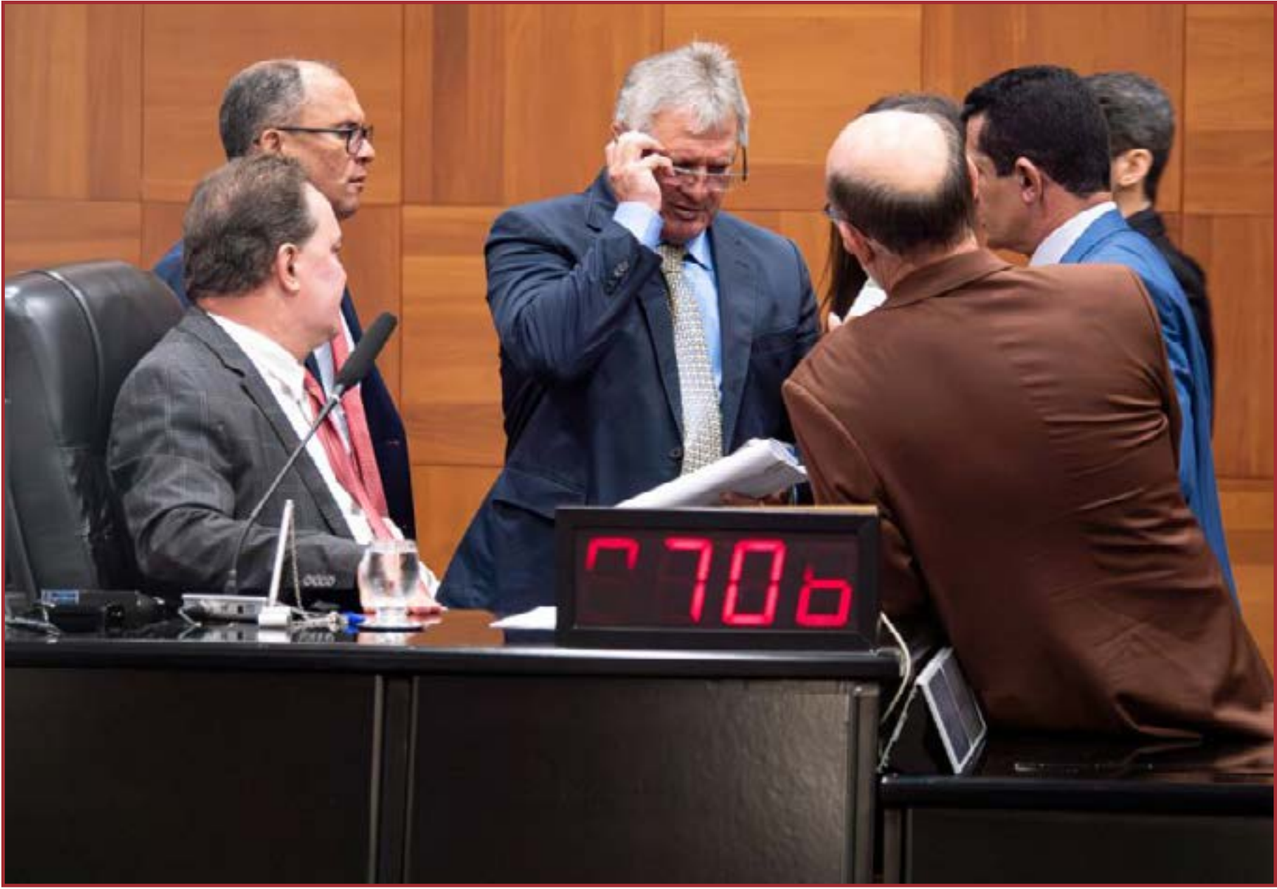
Deputados estaduais durante a sessão plenária

A Assembleia Legislativa aprovou, no início da tarde desta segunda-feira (22), o Projeto de Lei Orçamentária Anual (LOA) de 2026, que estima receita e fixas despesas do Estado em R$ 40,7 bilhões. A votação ocorreu na última sessão do ano. A aprovação ocorreu após os deputados Max Russi (PSB), presidente da Casa, e Valdir Barranco (PT) pedirem vista na sessão que ocorreu pela manhã. Max não anunciou a quantidade de votos favoráveis, contrários e ausências, apenas anunciou que a matéria estava aprovada. Após a votação do projeto, os parlamentares analisaram emendas em destaques dos deputados Wilson Santos (PSD), Lúdio Cabral (PT) e Jainaina Riva (MDB). Nenhuma foi aprovada. A votação ocorreu após pressão do Legislativo em cima do Governo Mauro Mendes (União) para que houvesse o empenho de todas as emendas parlamentares antes do fim deste ano. O Governo deve pagar R$ 624,8 milhões este ano aos parlamentares a título de emendas. A aprovação ainda este ano permite com que o Executivo inicie o ano de 2026 com o orçamento em execução. O temor do Palácio Paiaguás era de que, em um ano eleitoral, o orçamento ficasse contingenciado por alguns meses, o que barraria uma série de entregas.