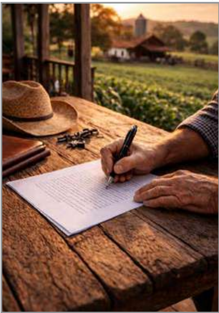
Quando desrespeitadas regras comprometem planejamento patrimonial

“Por isso, o acompanhamento jurídico especializado é indispensável, especialmente quando se trata de patrimônios rurais, empresas familiares e estruturas produtivas”, alerta a especialista.