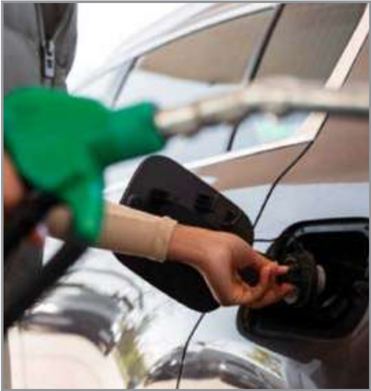
Preços subiram impulsionados pela entressafra e pelo aumento do ICMS sobre a gasolina

O alvará de funcionamento que venceria em janeiro foi prorrogado para 28 de fevereiro.