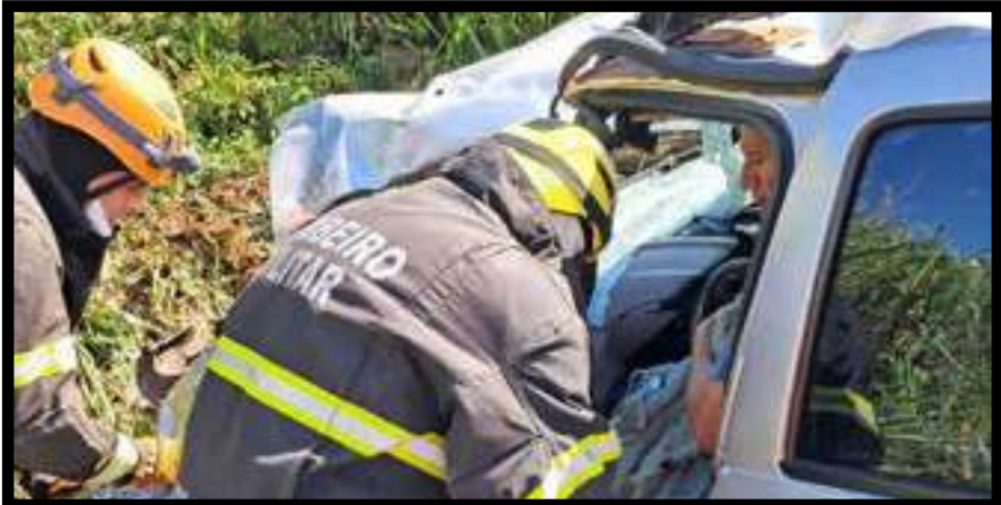
O Corpo de Bombeiros resgatou, terça (17), um homem, 52 anos, que ficou preso às ferragens de um veículo após um acidente de trânsito na BR-070, a cerca de 15 km de Campo Verde. Outras três pessoas também foram atendidas na ocorrência. O acidente de trânsito envolveu um veículo de passeio e um furgão-baú de pequeno porte. Com o impacto, o furgão tombou na pista, enquanto o carro saiu da rodovia. Seis pessoas estiveram envolvidas no acidente, sendo quatro ocupantes do veículo de passeio.