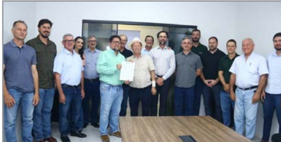
Biorrefinaria investe R$ 1 bi na cidade

A legislação que ampara o benefício estabelece critérios para concessão de isenções tributárias municipais. "Hoje é um ponto histórico dentro de uma nova legislação de incentivo fiscal para a instalação de indústrias", declarou o secre-