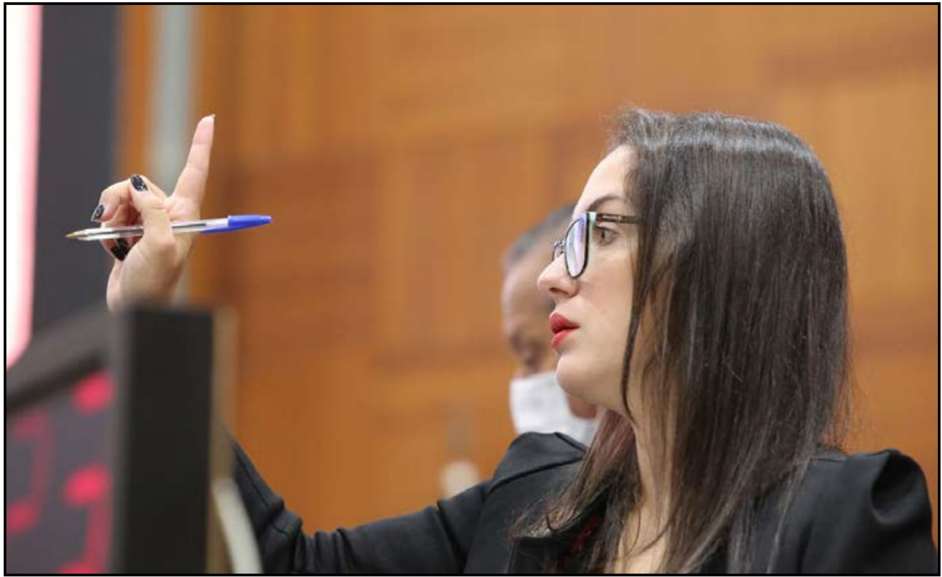
Sinalização reforça um movimento de aproximação com a direita