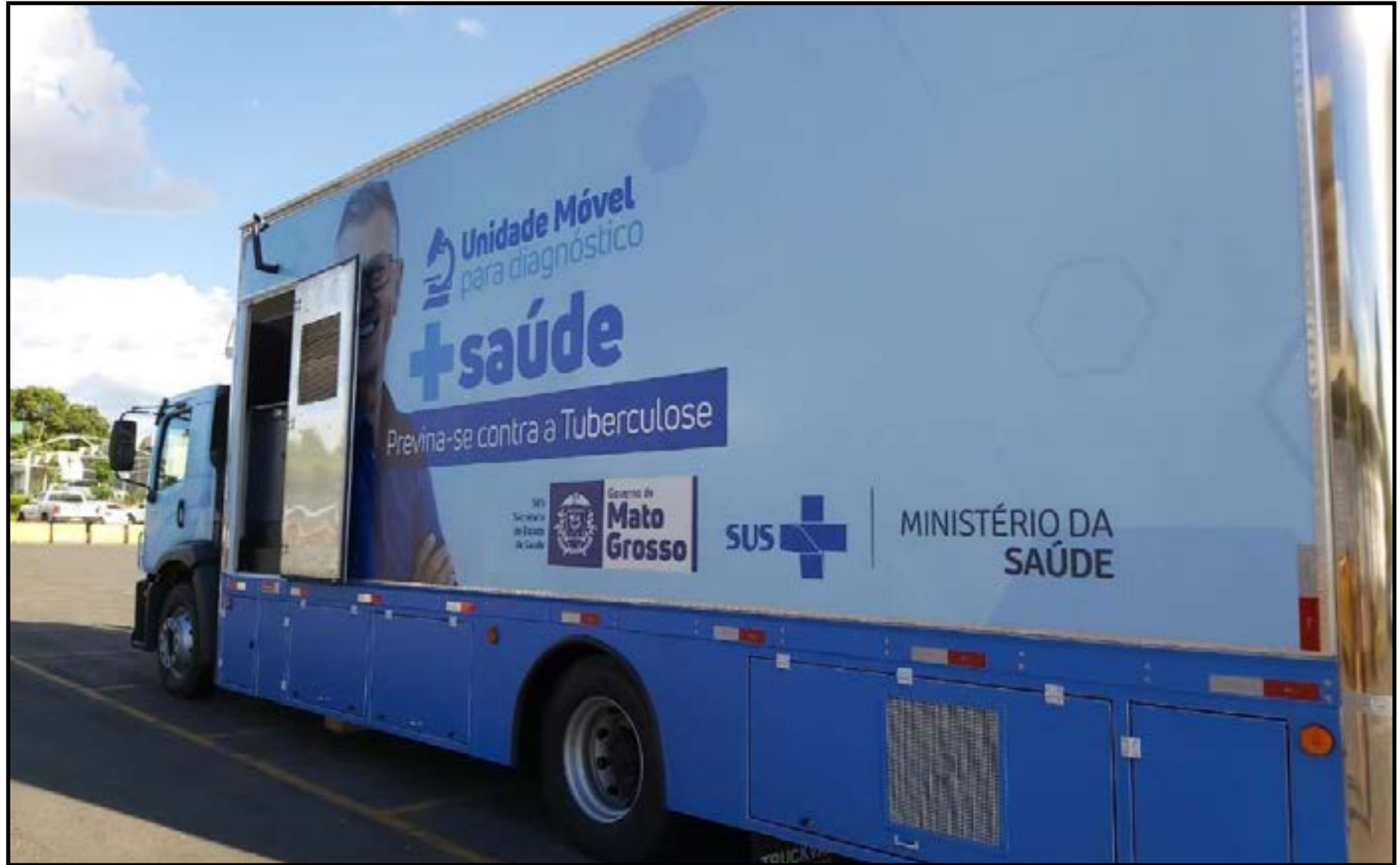
Equipe da unidade móvel realizou exames de Teste Rápido Molecular (TRM) e de raio-X de tórax

"O veículo possui equipamentos laboratoriais e de imagem que possibilitam o diagnóstico precoce da tuberculose, no momento do atendimento no sistema prisional. Caso o reeducando teste positivo para tuberculose, o tratamento é realizado na própria penitenciária, quando esta dispõe de uma equipe de saúde, ou pela Unidade Básica de Saúde (UBS) do município", explicou.