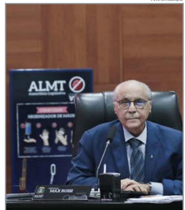
Parlamentar alega que foto foi gerada por IA