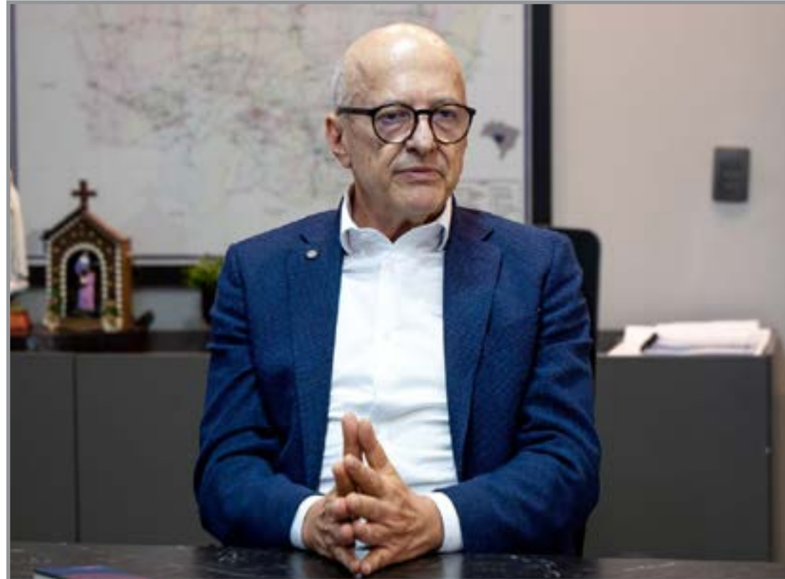
Vice diz que campanha não busca recursos