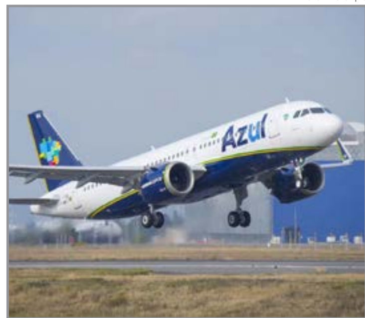
Aporte das aéreas americanas apoia recuperação judicial da empresa