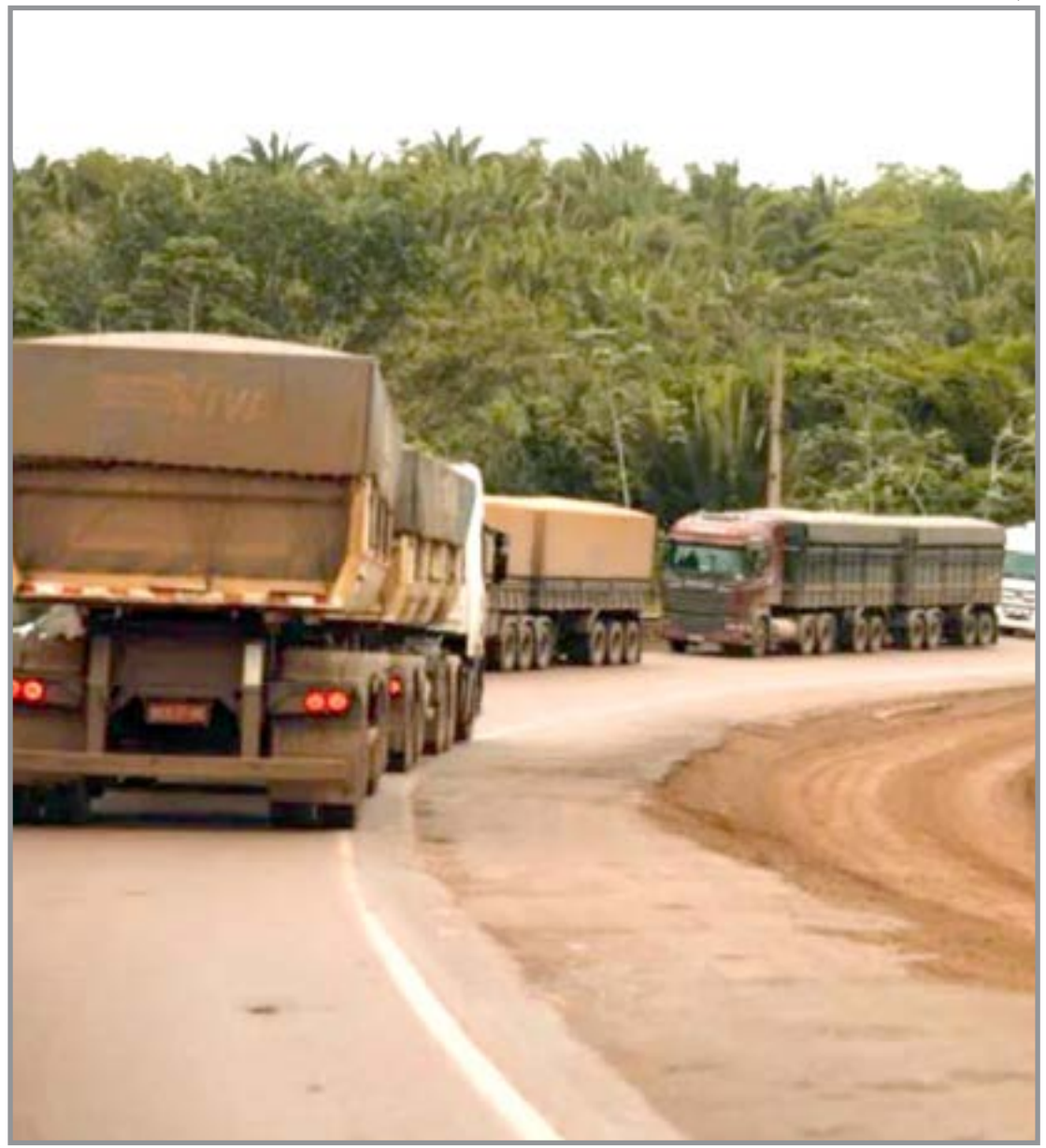
Carretas paradas em fila de 25 km

Isso porque elas podem comprometer a produtividade final, especialmente nas lavouras colhidas mais ao fim da janela.