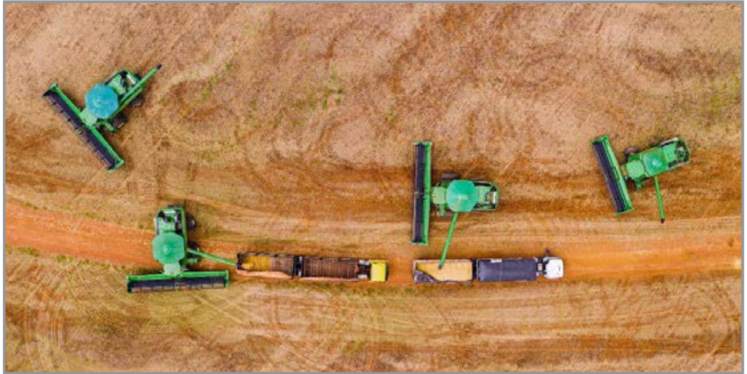
Ampliação da base de compradores ocorre em paralelo à intensificação da agenda internacional

São agendas construídas com comitivas de empresários e representantes dos setores econômicos,