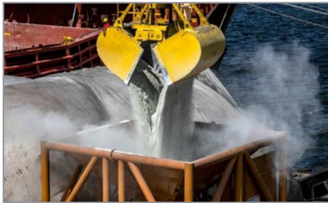
Sector agropecuario impuliona avanço nas entregas de adubos

O desempenho reforça a recuperação da demanda agrícola e o planejamento antecipado das compras por parte dos produtores rurais,