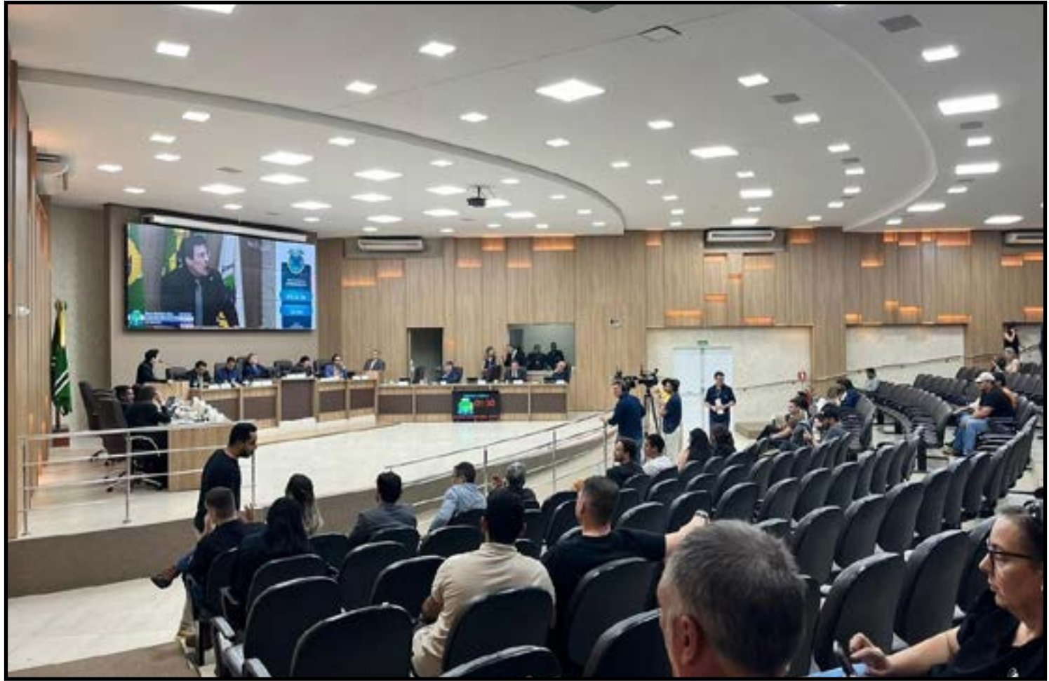
Insatisfação com o serviço prestado motivou o pedido

Sendo considerado apto, o colegiado será formado por sete vereadores, respeitando a proporcionalidade partidária, e deverá apresentar relatório conclusivo ao fim dos trabalhos.