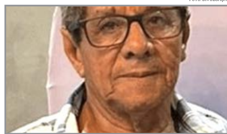
Sepultamento aconteceu nesta terça

A Polícia Civil passa a investigar o caso. Velório e sepultamento aconteceram ontem (24).