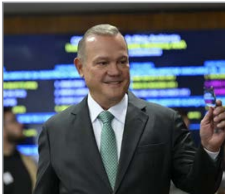
Senador aparece à frente nos dois cenários

O instituto realizou 1.200 entrevistas presenciais entre os dias 9 e 17 de fevereiro, em diferentes municípios do Estado. A margem