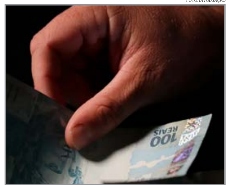
Pagamentos são para ações sem chance de recurso