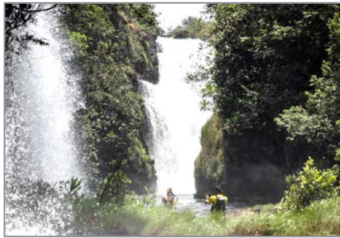
Cachoeira da Fumaça, em Jaciara

A Defesa Civil alerta para que a população redobre a atenção e adote medidas preventivas, como: evitar permanecer em áreas de corredeiras ou próximas a encostas e pedras; obser-