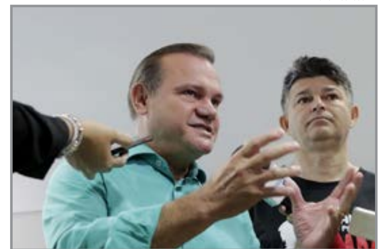
Meta é fortalecer chapa majoritária