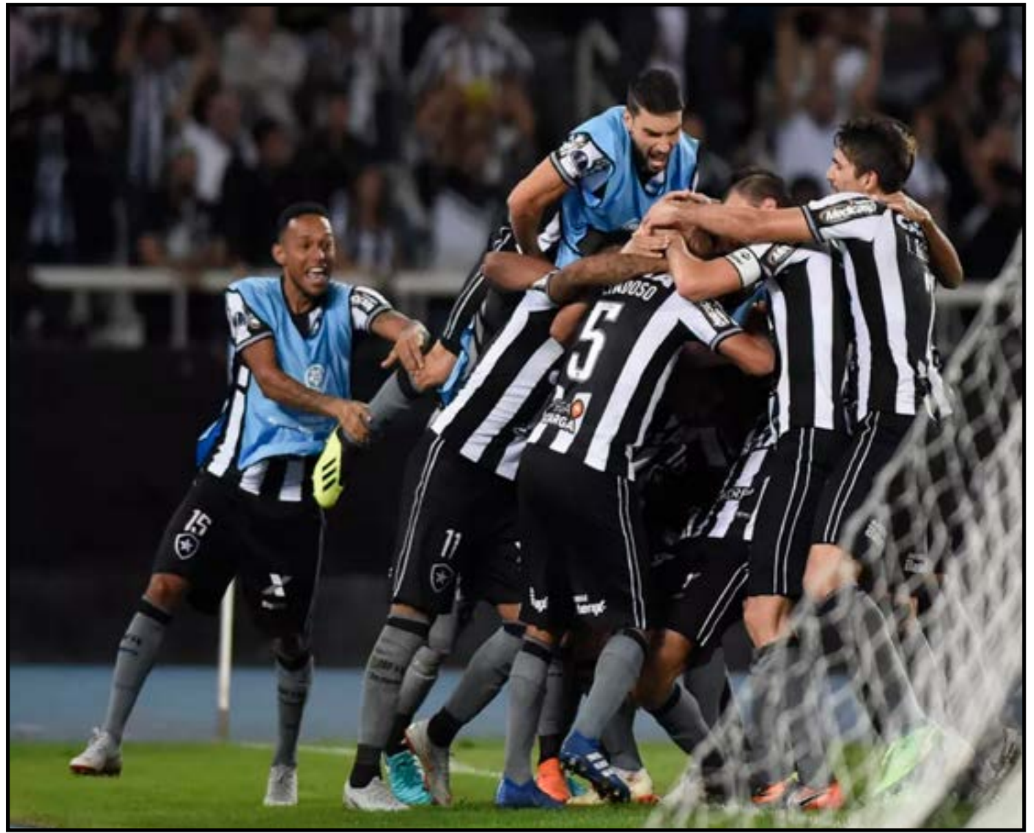
Botafogo vence Nacional pela Sul-Americana 2018