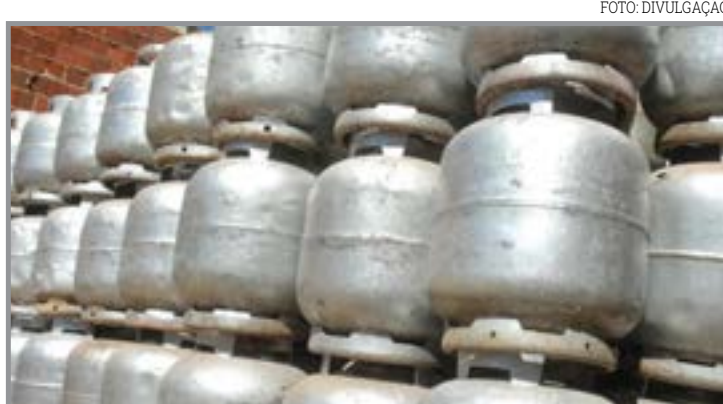
Cerca de 4,5 milhões de famílias serão beneficiadas

A validação pode ser feita das seguintes formas: car-