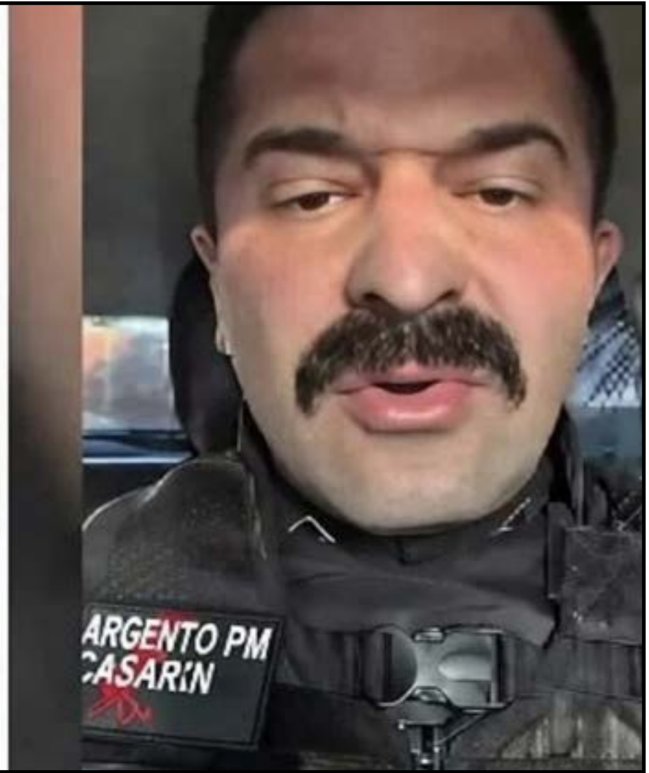
Casarin processado pelo PT