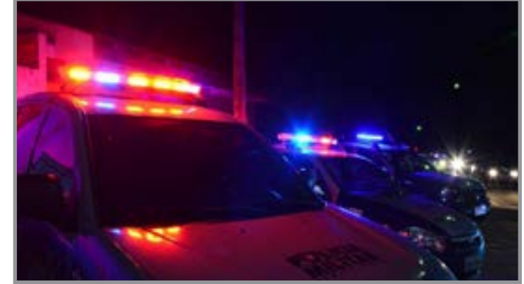
Irmã do denunciado foi socorrida e apresentava suposto traumatismo craniano