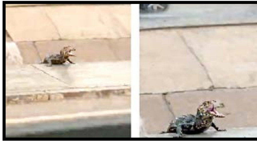
O forte temporal que atingiu Cuiabá, entre a tarde e noite de domingo (22), provocou transtornos significativos em diversos pontos da cidade, incluindo alagamentos intensos e a aparição de um filhote de jacaré nas águas do Córrego Mané Pinto. O animal foi avistado por moradores na região da Avenida 8 de Abril. Até o momento, não há informações oficiais sobre se o filhote foi resgatado.