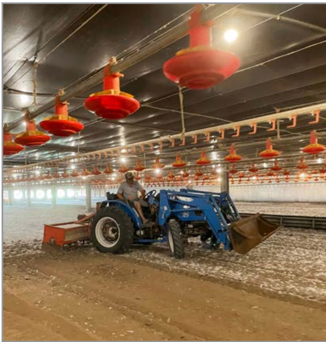
Destaque para atuação na avicultura, vitivinicultura e cultivo de maçã

O sistema de levante hidráulico moderno, permite o uso dos diversos implementos indispensáveis nestas atividades na vitivinicultura e nos pomares de maçã. Além disso, a tomada de força independente com 5 opções de rotação 540, 540E, 540SE, 750 e 1000 rpm amplia a compatibilidade com diferentes implementos, o sistema de acionamento eletro hidráulico com 2 opções (Manual ou Automático), aumenta a eficiência operacional com a máxima segurança. A cabine original de fábrica é o diferencial mais importante, especialmente para este tipo de produção que necessita atividades com atomizadores com pulverizações frequentes para a proteção das plantas e dos frutos. "O ambiente fechado e protegido proporciona maior segurança principalmente contra a ação da névoa dos defensivos e a poeira, menor exposição ao sol, contribuindo diretamente para o bem-estar do operador", destaca o especialista.