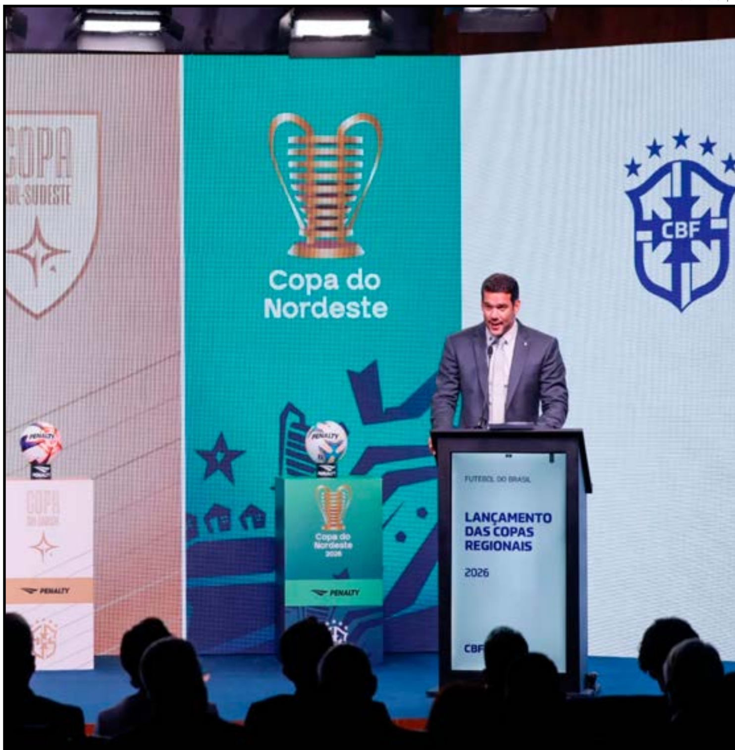
Sorteio na CBF

Já o Primavera foi campeão estadual em 2025, mas rebaixado no ano seguinte com uma campanha fraca: em 9 jogos, venceu apenas um e empatou 7. Foi rebaixado pelos critérios de desempate – justamente o número de vitórias. Na Copa do Brasil, até avançou à segunda fase depois de eliminar o Bragantino/PA, mas parou logo em seguida diante do Atlético/GO.