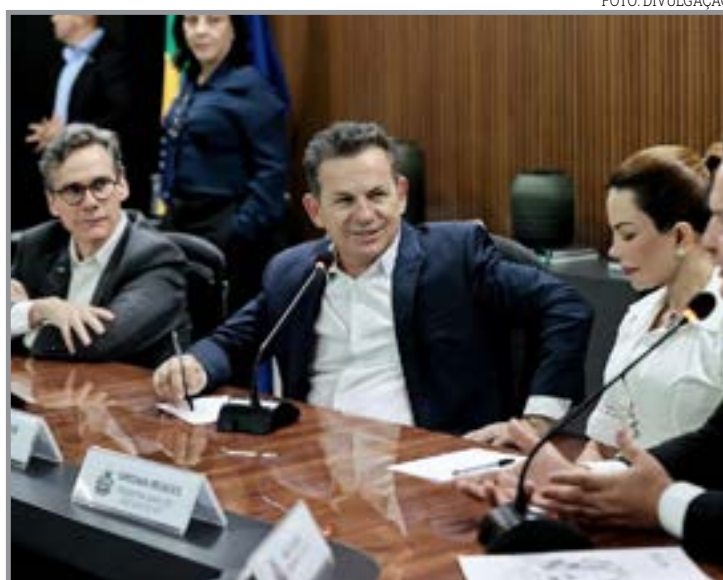
Parceria amplia os pontos de pagamento em todos os municípios

"As lotéricas estão nos 142 municípios do Estado de Mato Grosso. Obviamente, em algumas cidades maiores há mais casas lotéricas, e é uma rede super importante que hoje celebramos aqui com esse credencia-