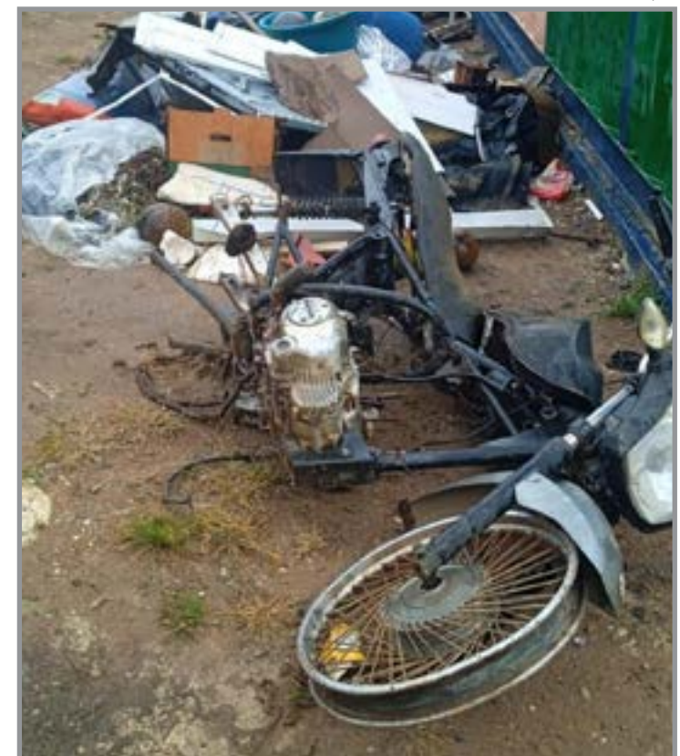
Polícia foi acionada e imagens estão sendo analisadas