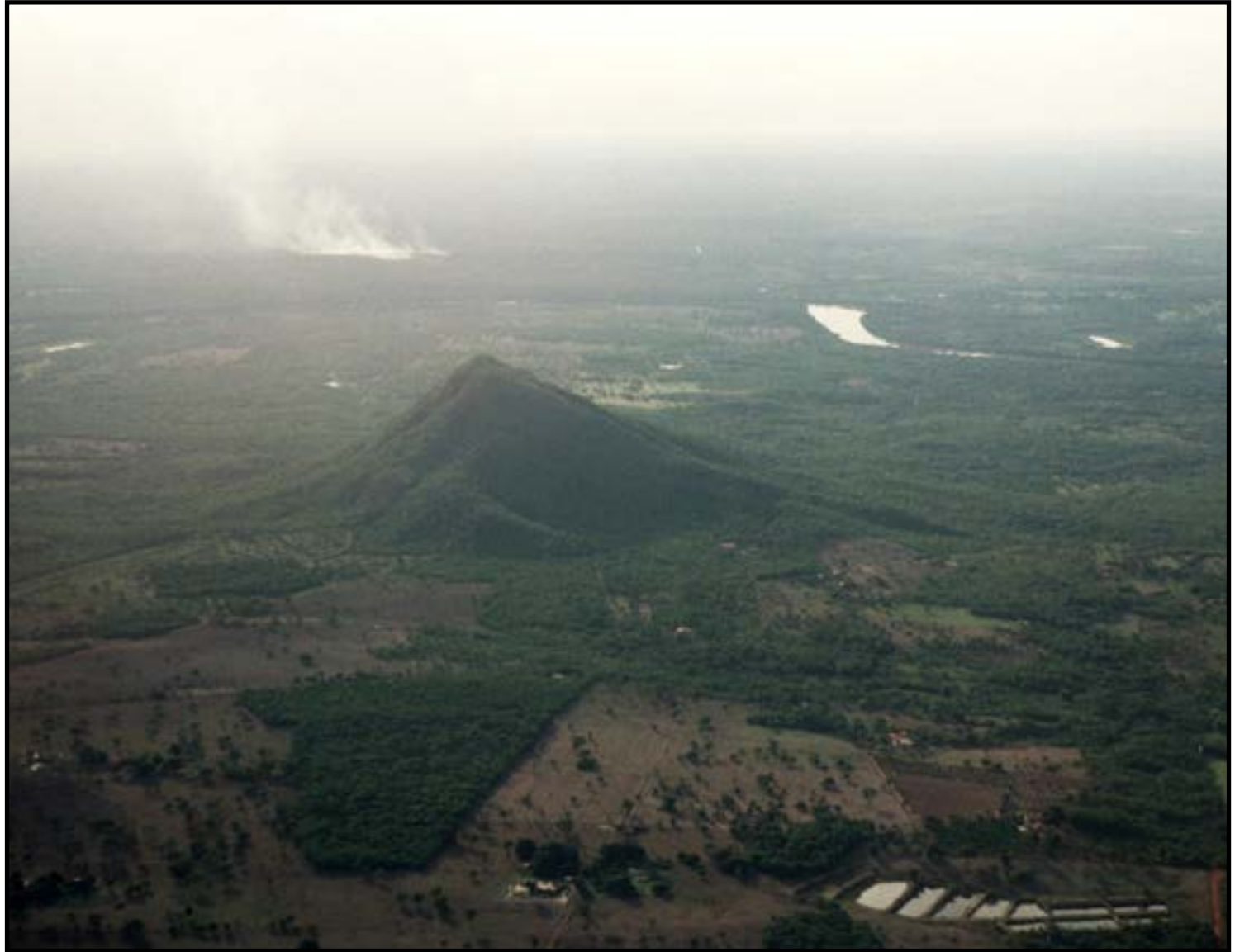
Justiça suspende obras no Morro de Santo Antônio após agravamento de erosão

Os técnicos registraram o avanço da erosão e que, em vez de uma trilha de até três metros, como previsto no licenciamento, foi aberta uma via que em alguns trechos tem até 12 metros. O MP ainda pediu para afastar a Sema da gestão do morro, mas foi negado pela Justiça.