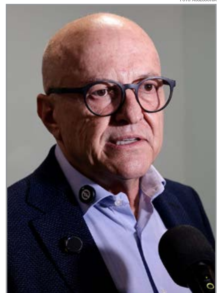
Vice-governador nega e mantém projeto próprio