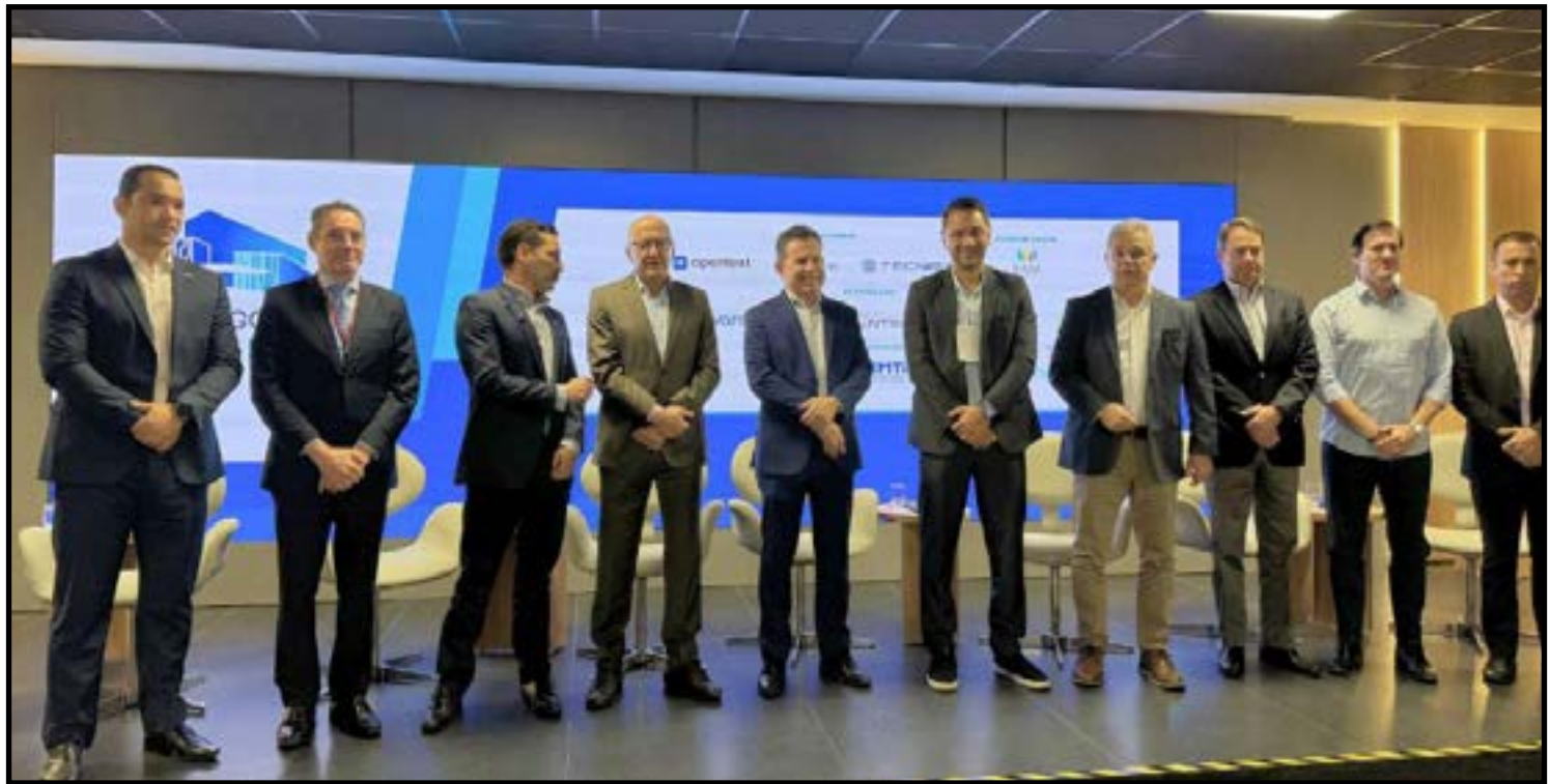
Discutindo Inteligência Artificial, governança e modernização dos serviços públicos

Ao longo do dia, especialistas e profissionais da área compartilharam experiências e boas práticas, re-