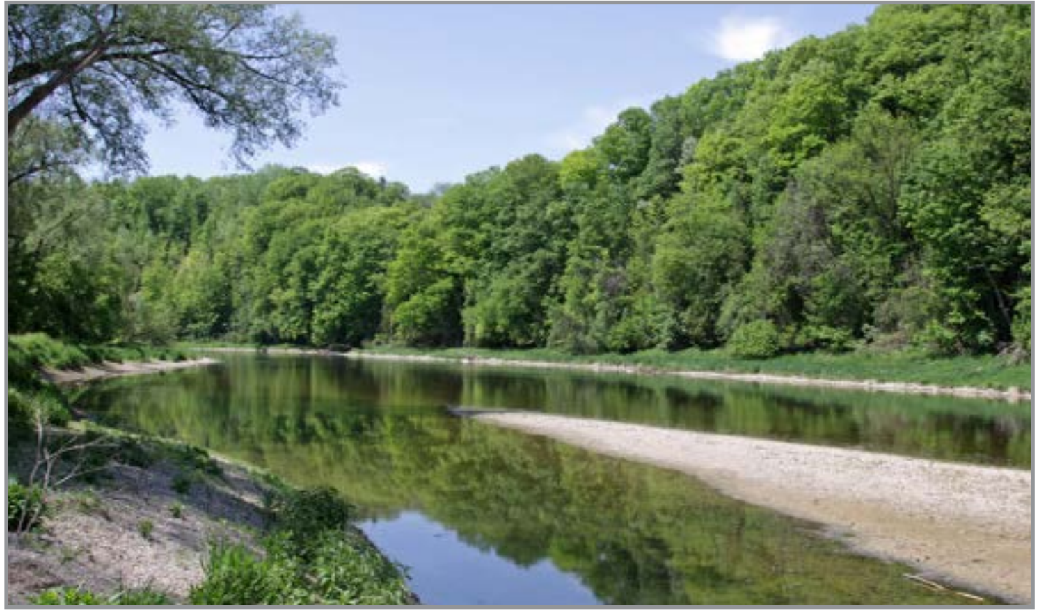
Legislação brasileira estabelece faixas mínimas de proteção conhecidas como APPs

A SpectraX é uma empresa especializada em monitoramento ambiental por sa-