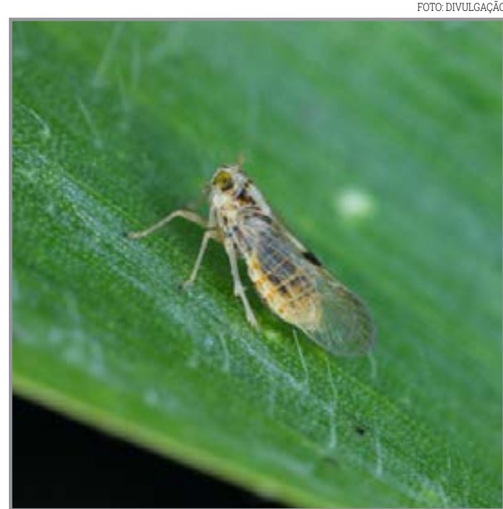
Especialistas destacam estratégias de manejo integrado

está adepta a esse tipo de pagamento e utiliza muito as redes lotéricas. Permitir isso também é uma ação social", destacou.