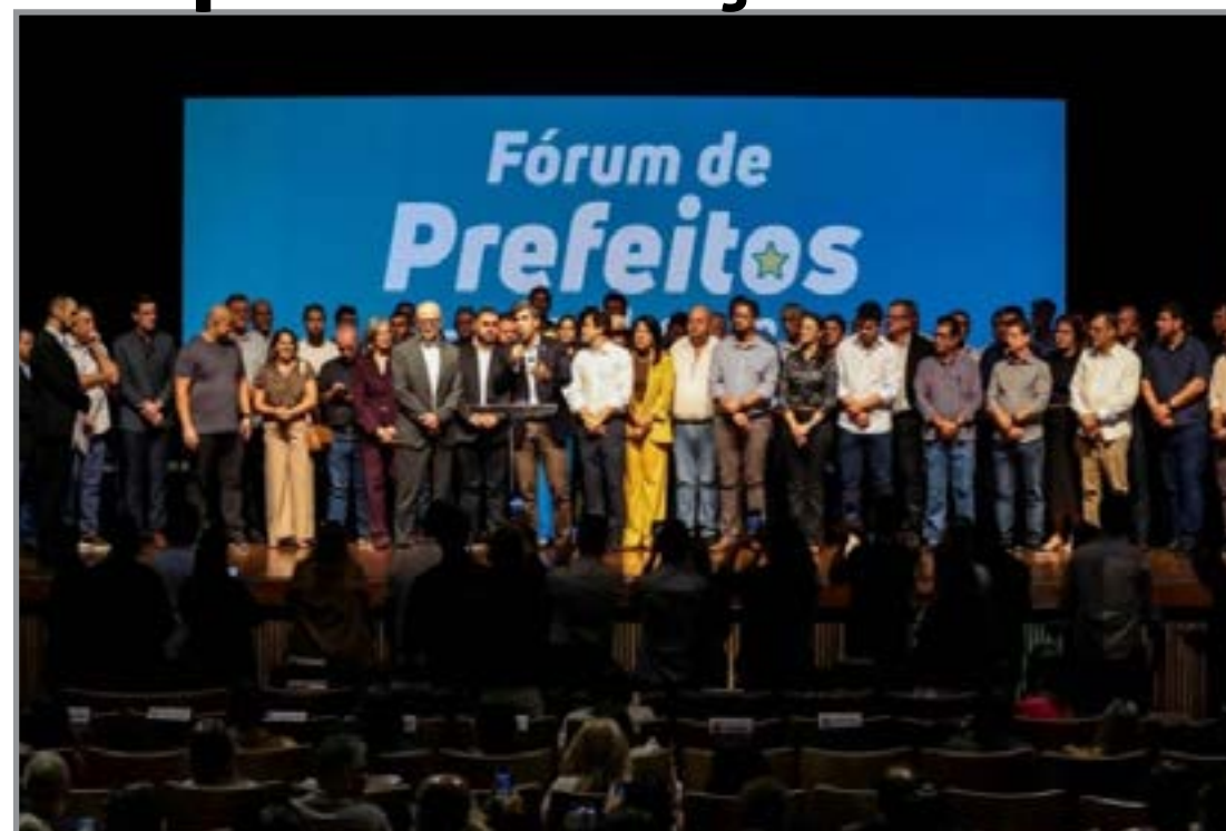
Debate trata de alfabetização e gestão educacional

Entre os temas centrais estão o papel da gestão municipal na condução das políticas públicas educacionais e o uso eficiente de recursos voltados ao ensino básico. Especialistas também apresentam experiências consi-