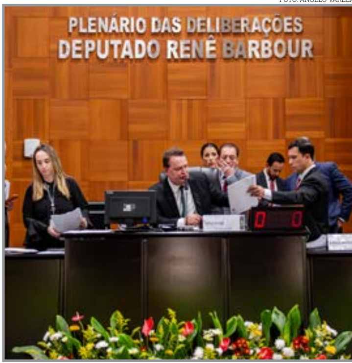
Gabinete de Enfrentamento à Violência de Gênero contra a Mulher é aprovado

Os parlamentares aprovaram ainda, em 1ª e 2ª votações, o Projeto de Lei nº 141/2026, de autoria do Tribunal de Contas do Estado (TCE/MT), que autoriza a instituição do Programa de Aposentadoria Incentivada (PAI) para servidores efetivos e estáveis da Corte.