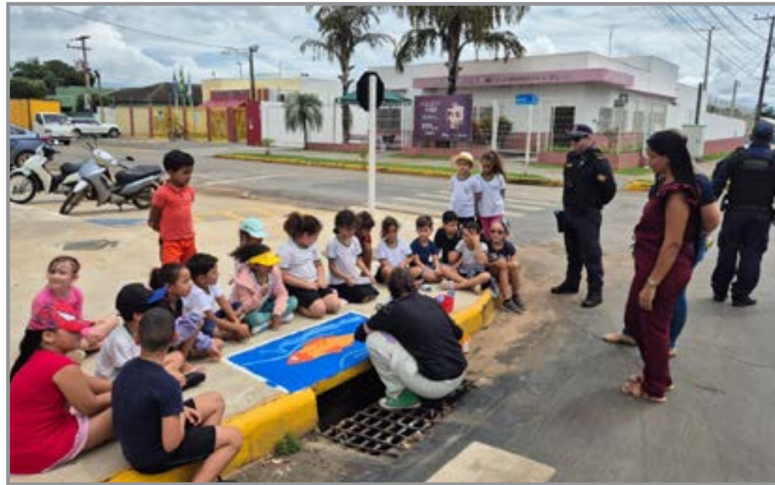
SAAE desenvolve atividades voltadas à conscientização ambiental

A programação conta com o apoio das Secretarias de Educação, Esporte e Lazer, Cultura e Turismo, Assistência Social e Habitação, Infraestrutura e Obras e Segurança Pública. Por meio da Guarda