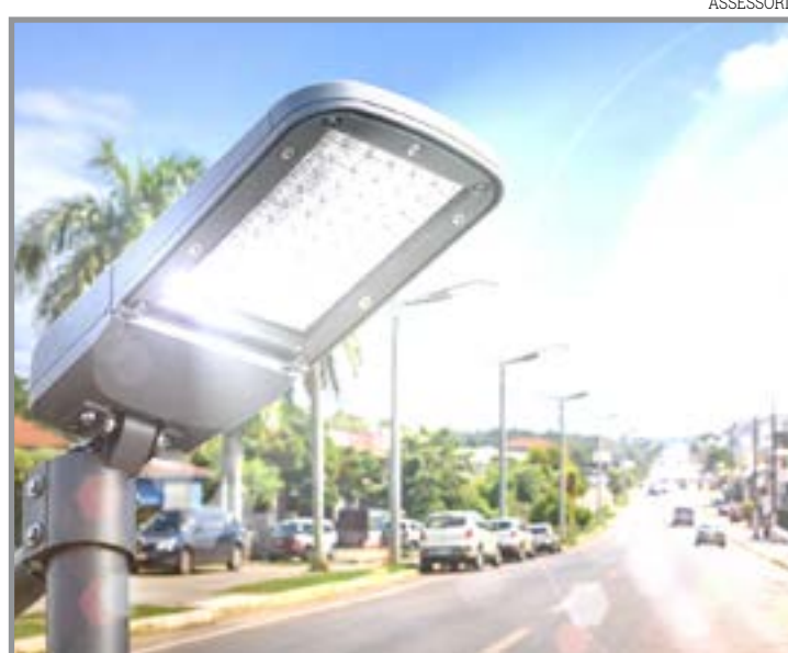
Convênio com Estado prevê troca de luminárias

De acordo com a administração municipal, "a modernização da iluminação pública representa mais segurança e economia para a população". O município ficará responsável pela execu-