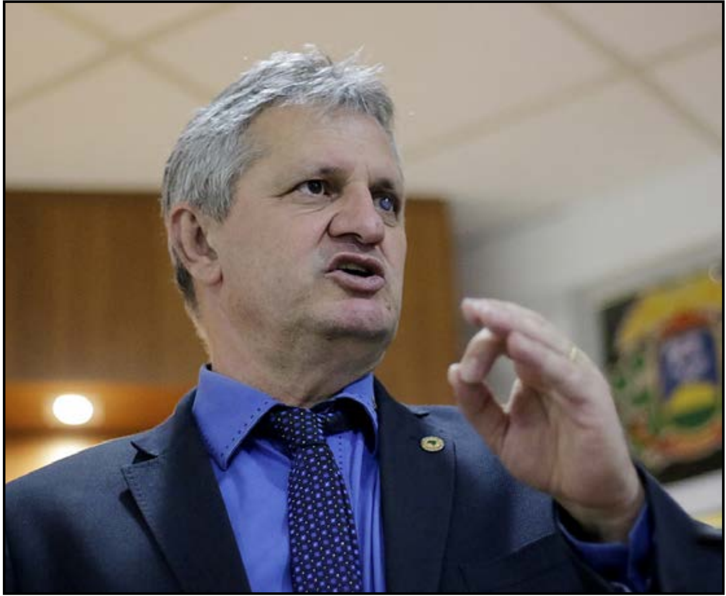
Parlamentar afirma ter recebido diversos convites

A decisão final sobre permanência ou saída do partido deve ocorrer nas próximas semanas. O prazo para troca de legenda termina em 4 de abril, data que marca o encerramento da janela partidária para parlamentares.