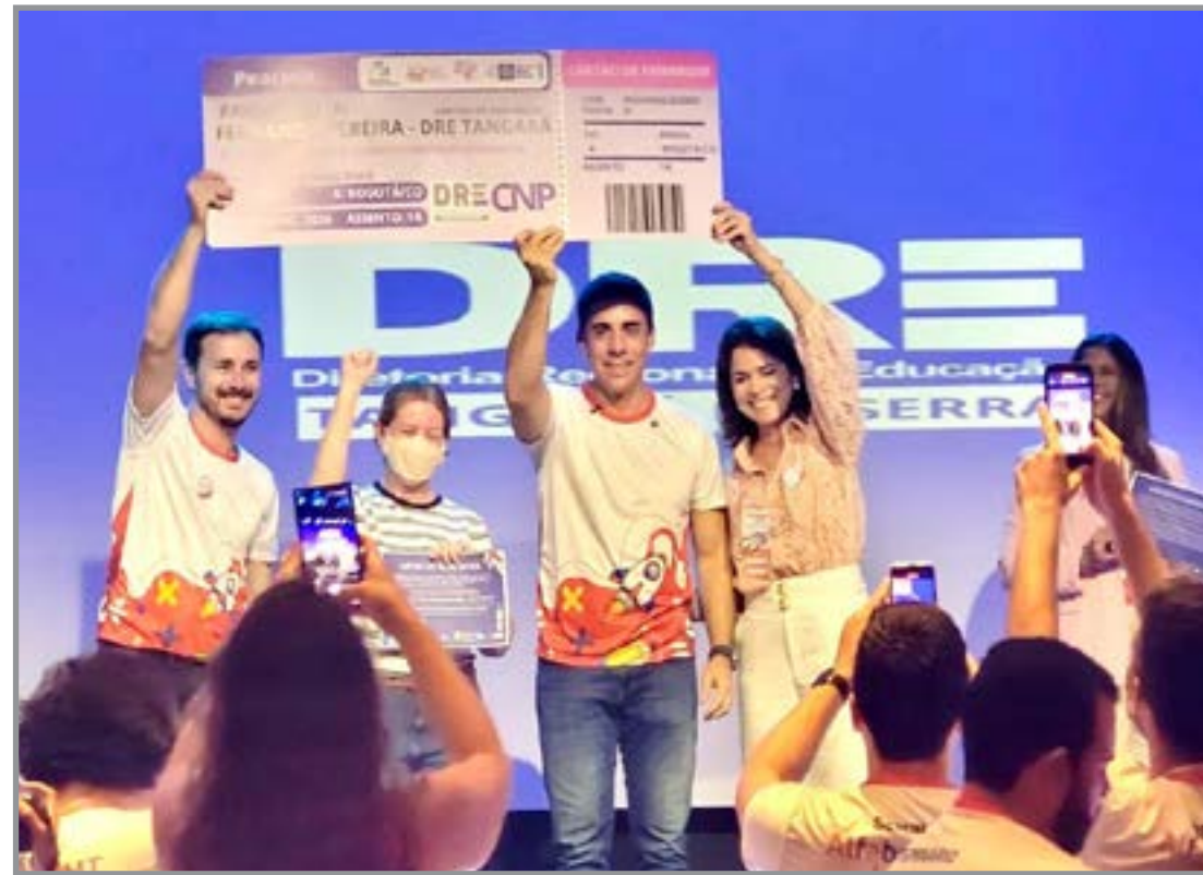
Município conquista Selo Ouro em alfabetização

O município também foi contemplado com o Selo Ouro em Alfabetização, concedido simbolicamente durante o seminário. A certificação reconhece o esforço coletivo da rede municipal no fortalecimento das políti-