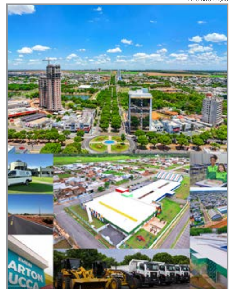
Pagamento à vista tem abatimento de 20%

aplicação dos recursos. A expectativa é de que a nova iluminação proporcione melhor visibilidade nas vias públicas e reduza falhas no sistema.