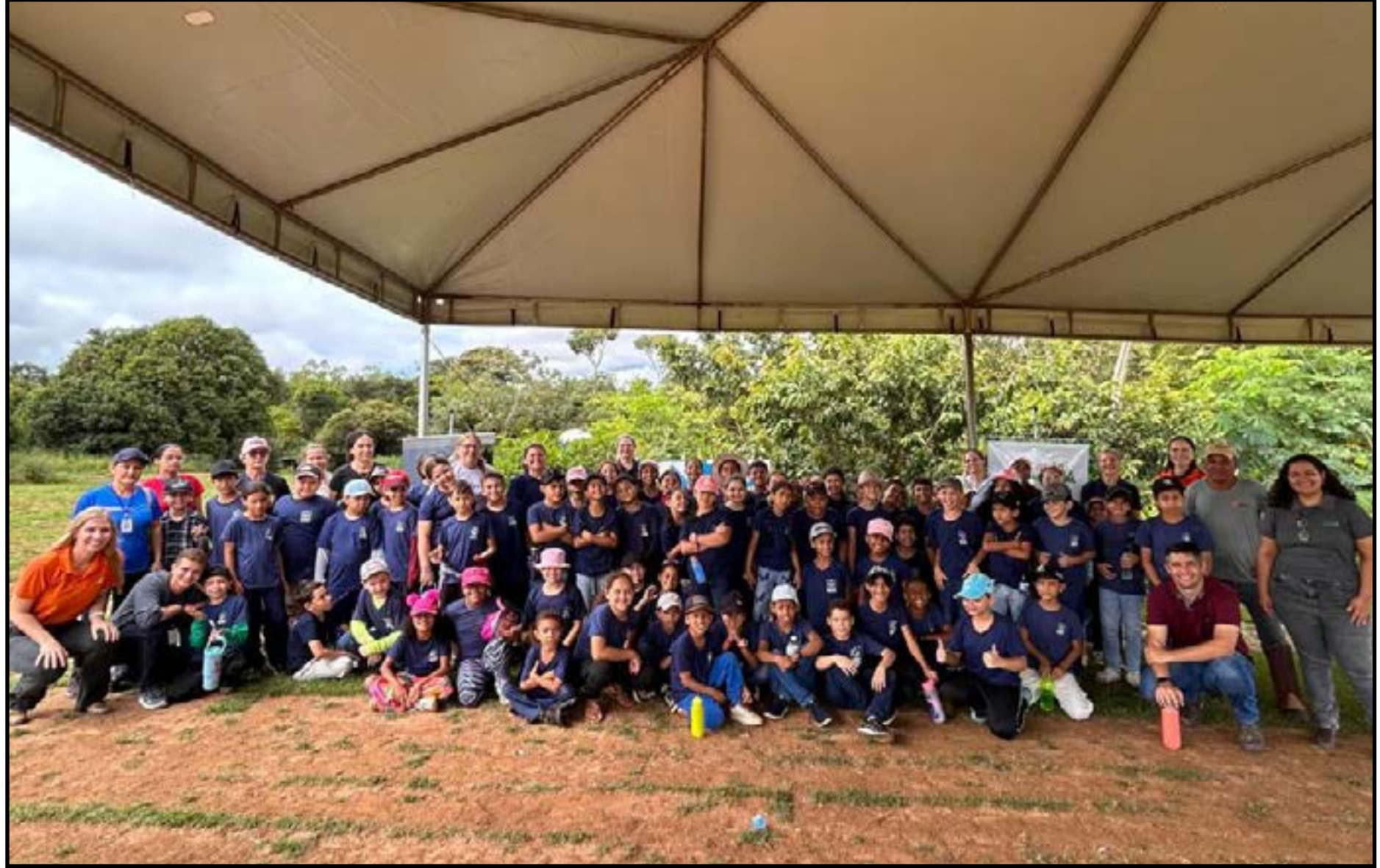
Atividade integra projeto de educação ambiental

A visita à nascente do Rio Lira marcou o encerramento do projeto Educação Agroambiental, realizado em parceria com o Fundo Social Cresol. "Agradecemos ao CAT a oportunidade de apoiar, por meio do Fundo Social, esse projeto ligado à sustentabilidade. Para nós, é uma grande emoção, porque um dos valores da Cresol é a sustentabilidade", destacou a representante da Cresol,