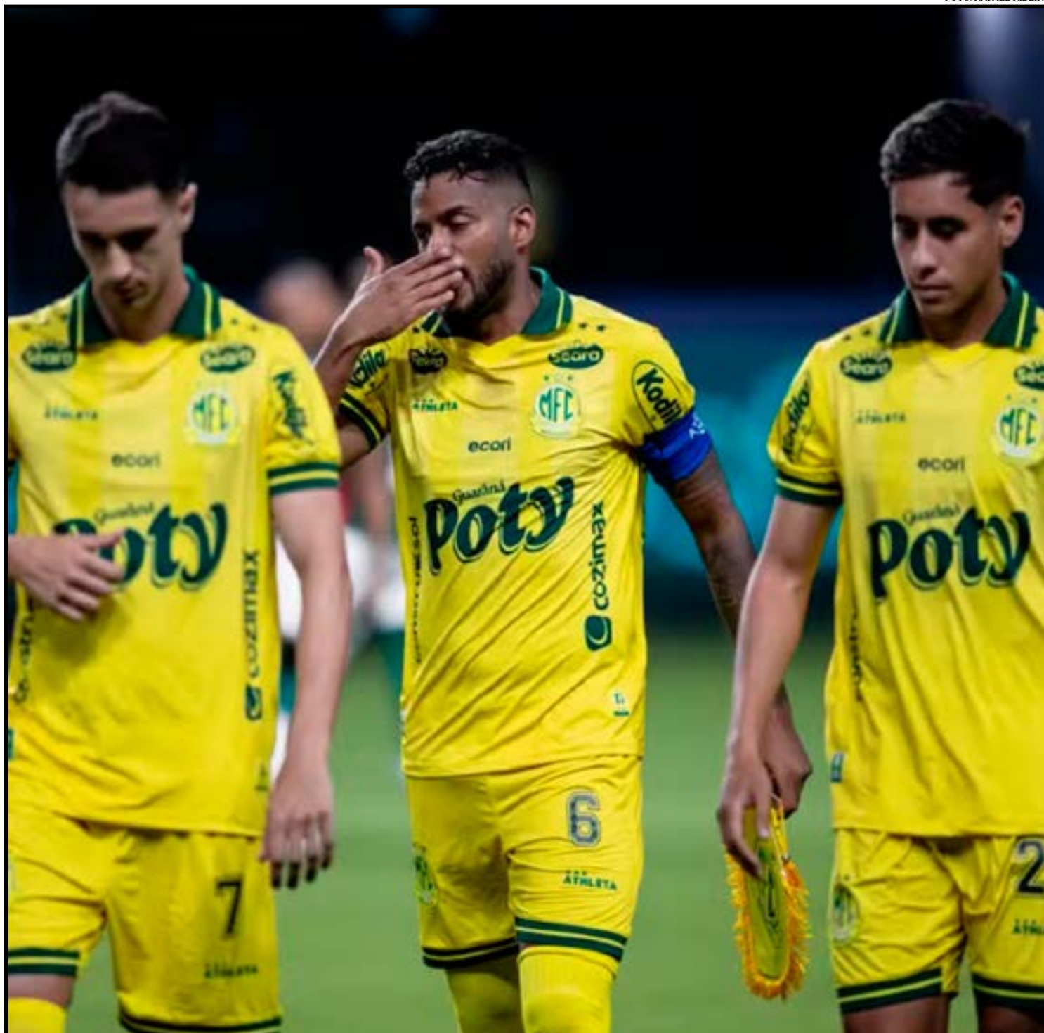
Mirassol não vence há nove jogos e está na zona de rebaixamento do Brasileirão

O mês de abril promete ser decisivo para o Mirassol. Além de estreiar na Libertadores (contra o Lanús) e na Copa do Brasil (diante do Bragantino), o Leão pode ter até cinco jogos no Brasileirão. O próximo compromisso é contra o Botafogo, fora de casa, no dia 1º.