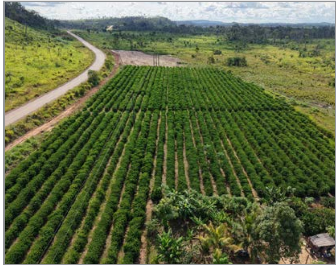
Imagem de lavoura de café em Aripuanã