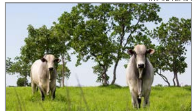
Ampliação dos embarques e diversificação de destinos impulsionam resultados