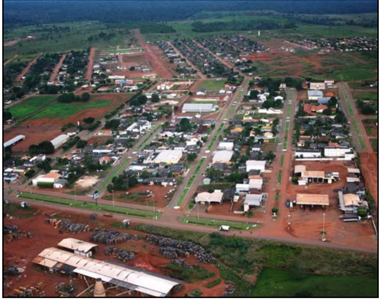
Itaúba assustada com ataques em sequência

Por volta de 6h da manhã, ela conseguiu pedir ajuda por telefone ao irmão e aos