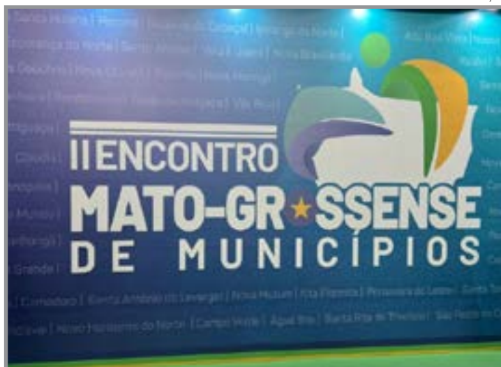
Município é uma das 4 cidades de MT que aderiram ao Gestão Pública Gov

O exemplo de gestão de Sinop também foi destaque no II Encontro Mato-grossense de Municípios, realizado nesta semana, entre