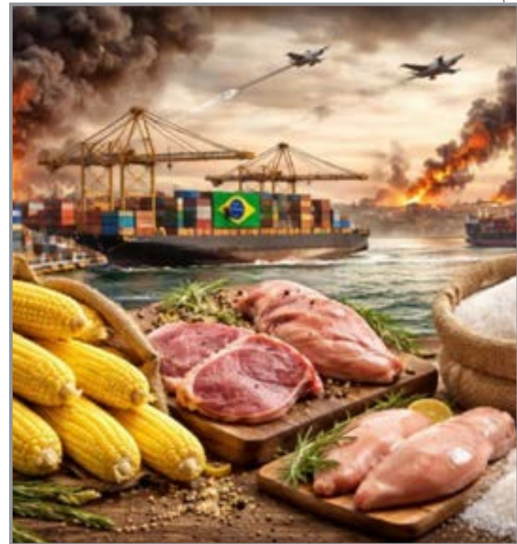
Agro brasileiro enfrenta impactos desiguais com maior vulnerabilidade