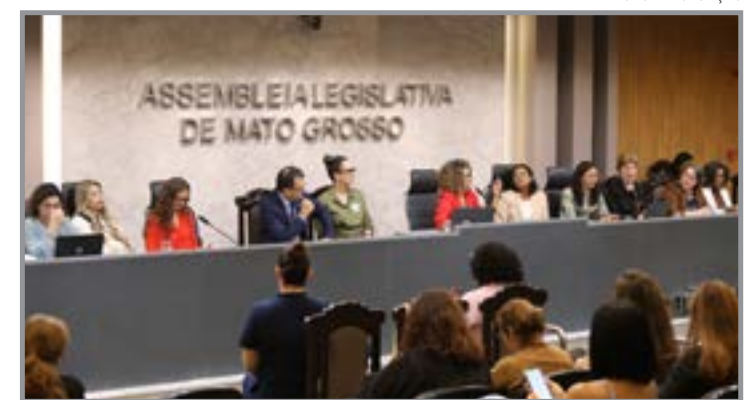
Audiência expõe lacunas na rede de proteção

Entre as propostas apresentadas, está o fortalecimento da segurança pública com foco no atendimento especializado. A ampliação do efetivo feminino em patrulhas e a capacitação adequada foram apontadas como medidas essenciais.