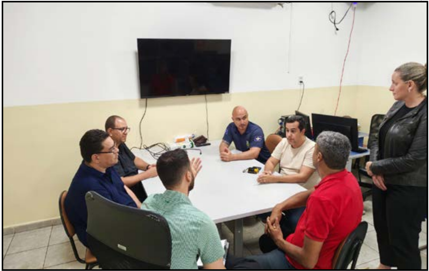
Reunião em Nova Xavantina

Além das tratativas relacionadas à Casa do Coronel Vanique, a equipe da SECEL também participou de uma reunião com os setores de Balizamento, Licitação e Engenharia da Prefeitura. O encontro teve como objetivo alinhar os detalhes do edital para a manutenção corretiva do prédio do Teatro Municipal Heitor Villa-Lobos, outro bem de grande relevância histórica e cultural para o município. A iniciativa visa garantir a conservação do imóvel e sua