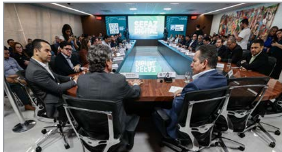
Estado arrecada R$ 42,6 bi e mantém superávit

Segundo Anésia, aproximadamente R$ 3,7 bilhões das despesas não correspon-