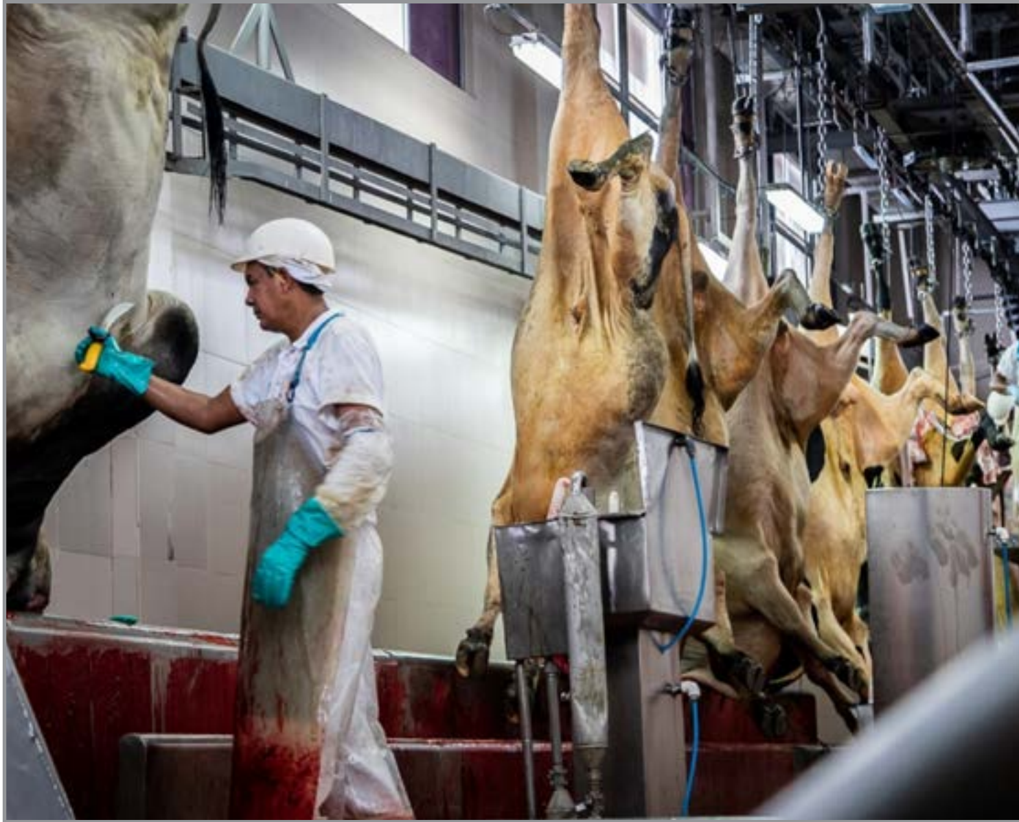
MT lidera abate de bovinos e exportações de carne no país

Segundo ele, os números refletem não apenas a capacidade produtiva, mas também a confiança dos mercados internacionais na carne bovina produzida em Mato Grosso. No quarto trimestre de 2025, Mato Grosso manteve o ritmo de crescimento no setor. O estado registrou aumento de 15,3% no abate de bovinos em comparação ao mesmo período de 2024, além de apresentar o maior crescimento absoluto entre as unidades da federação, com 256,11 mil cabeças adicionais. No mesmo período, Mato Grosso também liderou os embarques internacionais, com 255,15 mil toneladas exportadas, o equivalente a 27% do total nacional. O volume representa uma alta de 57,5% na comparação anual, reforçando a competitividade do estado no mercado global de carne bovina. O desempenho consistente ao longo do ano consolida Mato Grosso como principal polo da pecuária brasileira, com forte presença tanto no abastecimento interno quanto no comércio internacional de carne bovina.