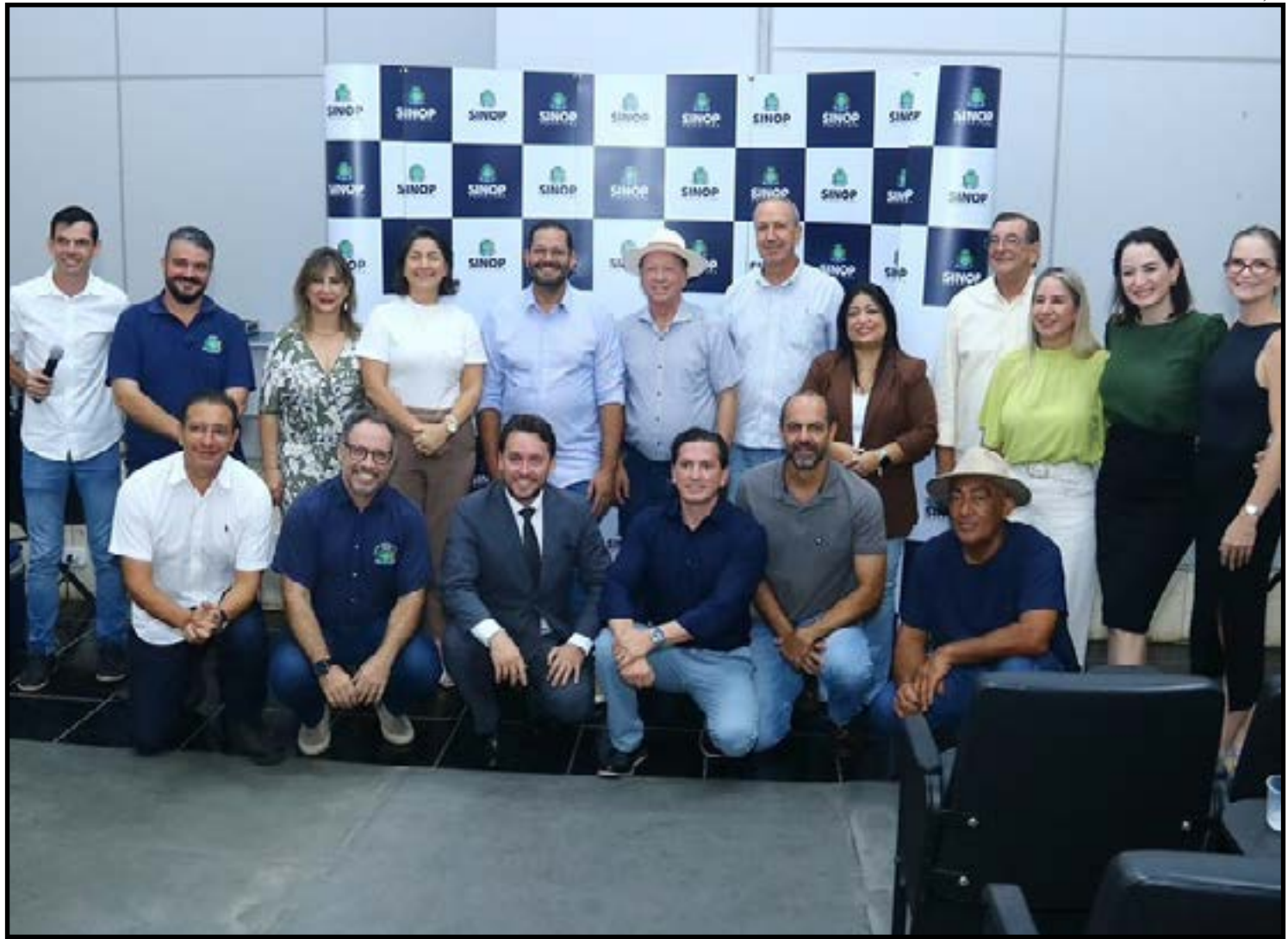
Alegria é de reorganização e fortalecimento da governança do município

"Retornar a esse lugar é muito importante e estou muito feliz, porque tem uma equipe muito boa, uma equipe muito grande que trabalha com esse setor, com o desenvolvimento urbano e com a habitação. Então, estar junto com essas pessoas, capacitando esses trabalhos, é motivo de muita felicidade e honra. Temos vários desafios a serem concluídos nesta gestão e nada mais justo do que trabalhar com responsa-