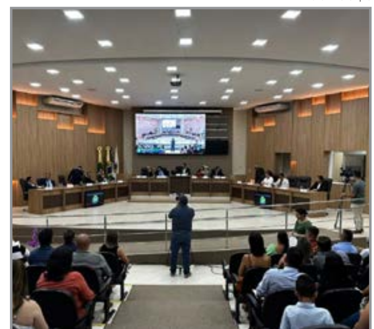
7 vereadores concorrem às vagas

que compete exclusivamente ao relator a elaboração do relatório final, a obrigatoriedade de anexar todas as atas das reuniões realizadas, a correção da padronização terminológica com termos compatíveis à AL e a regulamentação de casos de empate nas votações. Nesse último ponto, ficou estabelecido que membros titulares e suplentes ausentes terão prazo de três dias para se manifestar. Caso não haja um posicionamento, caberá ao presidente o voto de desempate.