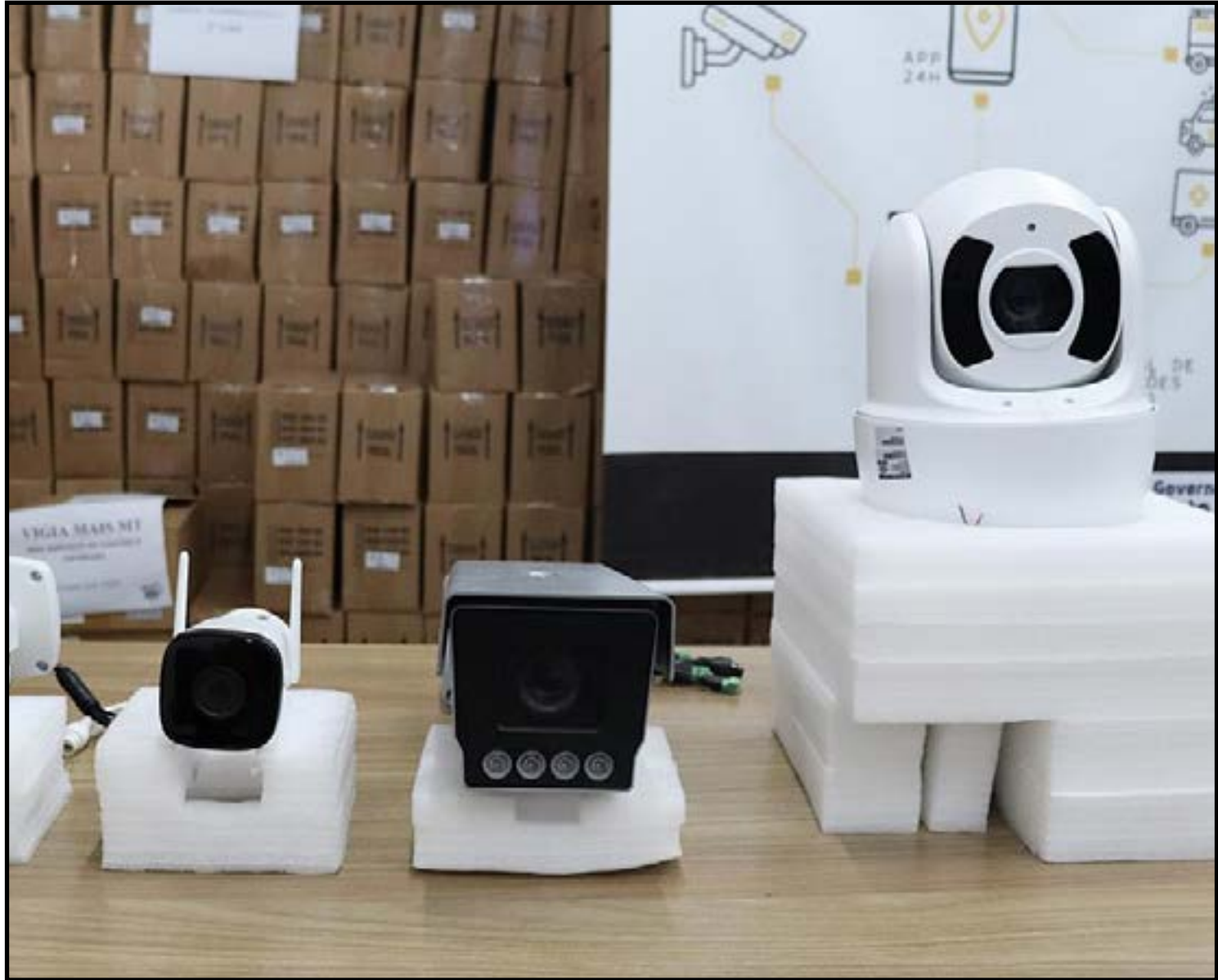
Carros roubados recuperados, entre outros resultados

“Este ano, com o sucesso da primeira fase do Vigia, onde adquirimos inicialmente 15 mil câmeras, demos início à uma nova etapa. Estamos