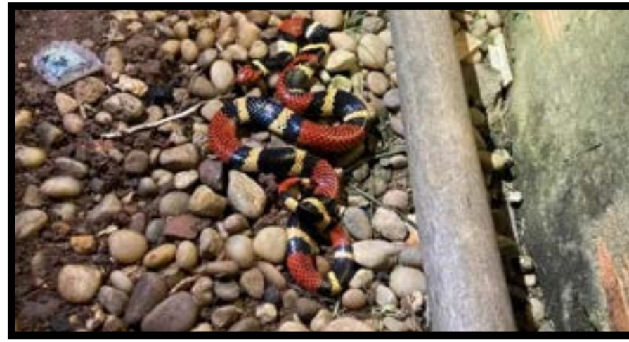
Uma cobra-coral foi resgatada pelo Corpo de Bombeiros no quintal de uma casa no Bairro Boa Vista, em Alta Floresta, na segunda-feira (30). A serpente, que é venenosa, foi encontrada pelos militares em uma área de pedras, próximo ao muro da casa. Os bombeiros informaram que utilizaram técnicas de manejo de fauna silvestre e equipamentos adequados para conter o animal com segurança, sem ferimentos. Após a captura, a cobra foi colocada em um recipiente apropriado e devolvida a uma área de mata afastada da zona urbana.