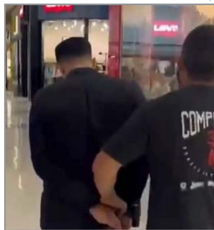
Polícia encontrou no celular conteúdos envolvendo crianças a partir de 2 anos

A Polícia Civil segue investigando o caso para identificar possíveis compradores dos conteúdos, além de localizar e proteger as vítimas dos abusos sexuais.