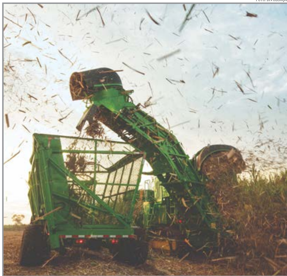
Titan apresenta novas medidas durante a feira

Essa inovação reduz o risco de falhas e paradas não planejadas, garantindo maior vida útil e desempenho confiável no campo. Desenvolvidos para operações em cana-de-açúcar, os pneus não apresentaram problemas de soltura ou trincas na carcaça, falhas comuns nesse tipo de aplicação, entregando excelente custo-benefício.