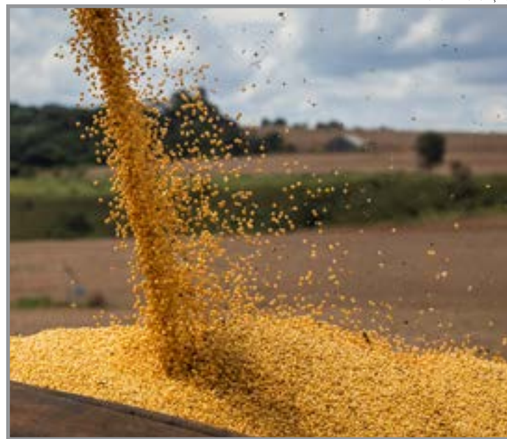
Recuperação da produtividade e pela ampliação da área plantada

O milho também apresenta crescimento, impulsionado principalmente pela segunda safra, enquanto o algodão reforça o avanço de outras cadeias produtivas. As condições climáticas mais favoráveis em comparação ao ciclo anterior têm contribuído para o bom desenvolvimento das lavouras e aumento da produtividade média. Com maior oferta, a safra deve impactar positivamente o mercado interno e as exportações, ampliando a disponibilidade de produtos, fortalecendo a balança comercial e consolidando o protagonismo do agronegócio brasileiro. A confirmação desse cenário, no entanto, ainda depende do clima e das condições de mercado nos próximos meses.