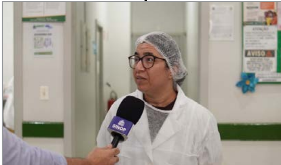
Reforço nas especialidades em Sinop