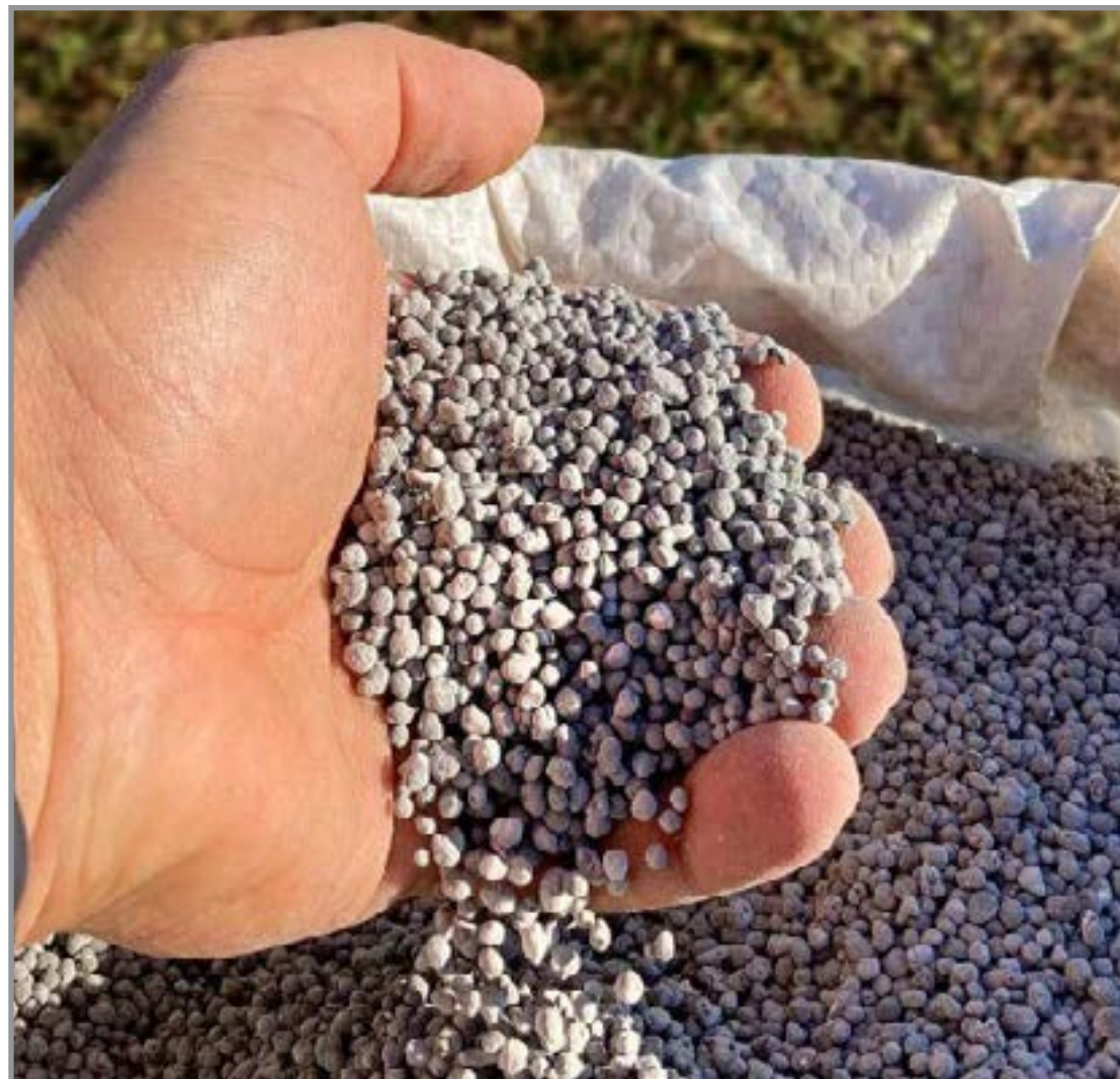
Guerra deve dificultar a compra de fertilizantes no segundo trimestre

A tendência é de normalização lenta, exigindo maior planejamento e gestão de custos ao longo do ano.