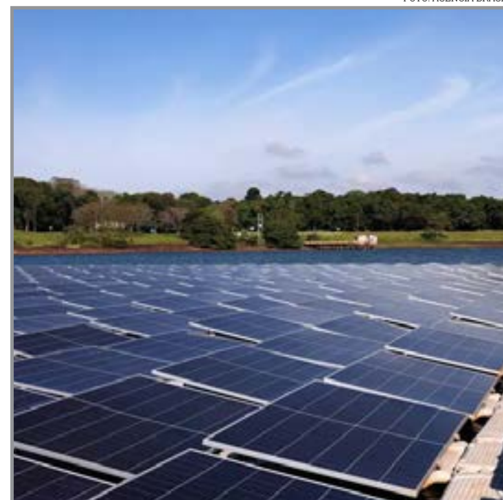
Binacional estuda novas fontes renováveis para geração elétrica