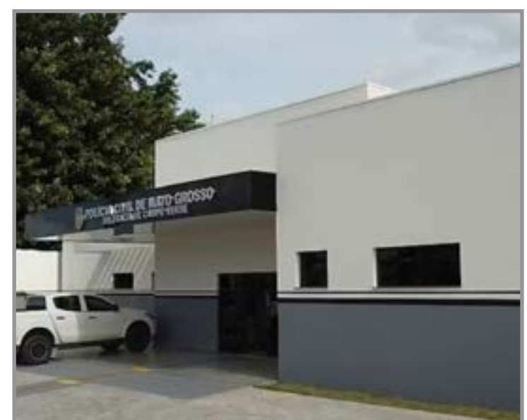
Professor preso pela PIC