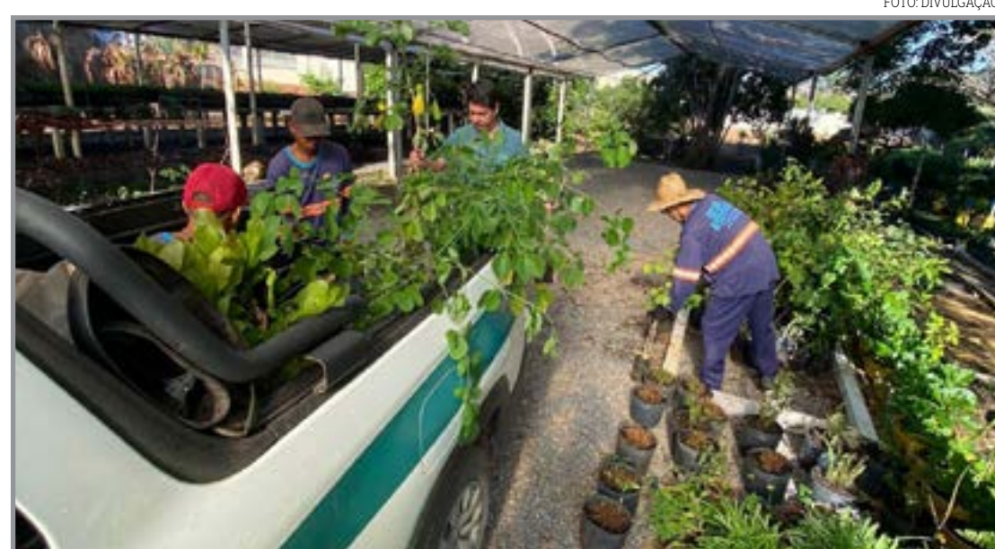
Ação integra produção local e alimentação

A iniciativa consolidou uma estratégia de integração entre produção rural e alimentação escolar, garan-