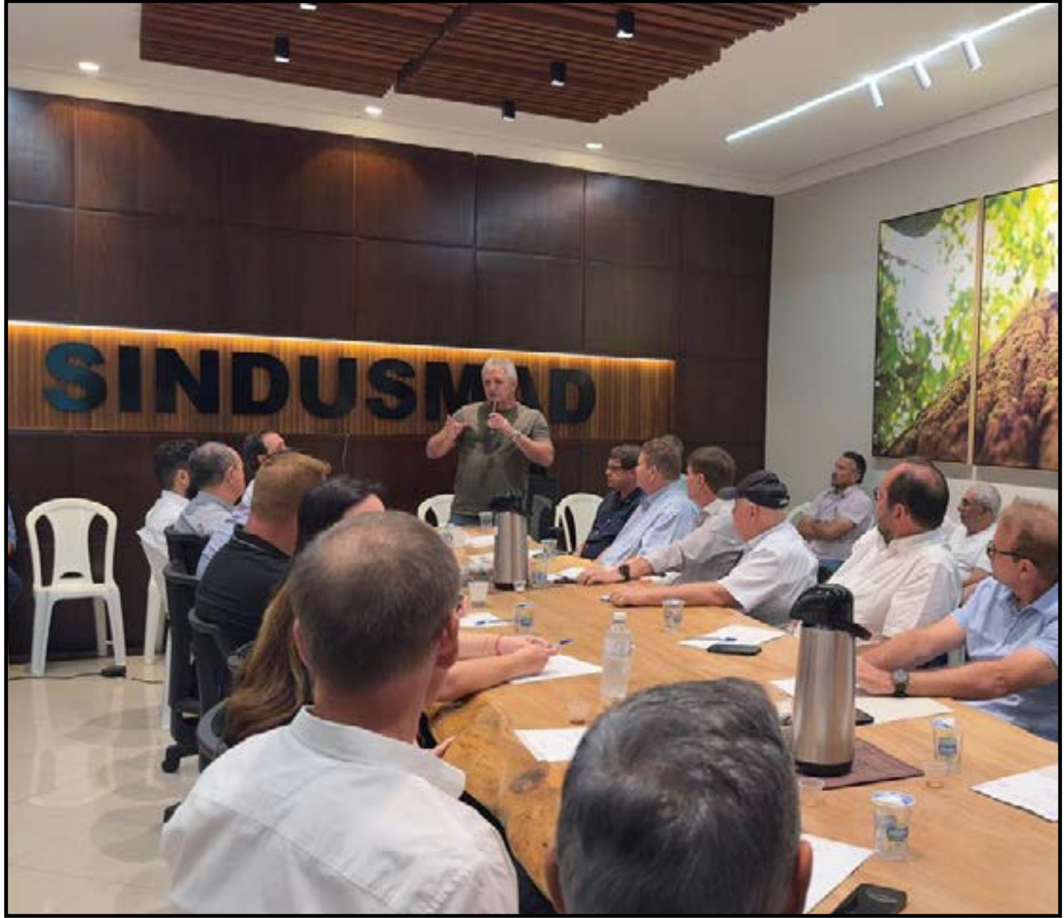
Leis e articulações dão mais segurança ao setor