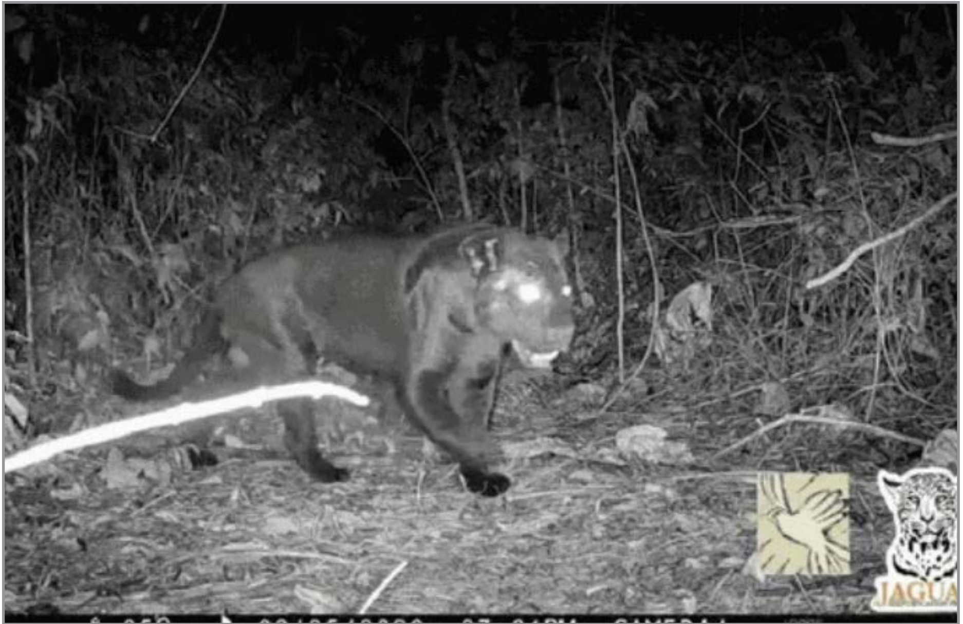
Flagrante foi feito em uma pequena área de mata em São José do Rio Claro

“Capturar esse indivíduo em câmera é algo muito especial e de grande valor científico. Esse trabalho busca gerar base científica para