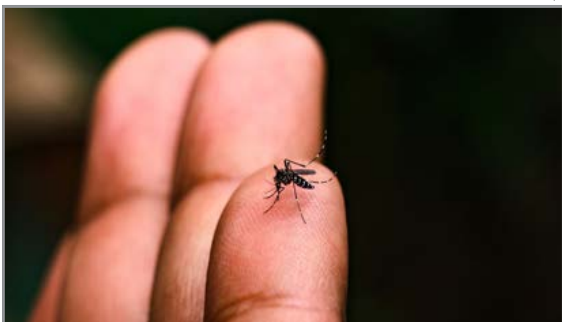
Vacinação é uma das principais formas de prevenção contra a dengue

A vacinação está sendo realizada na sala de vacina do ESF Maicon Monteiro de Castro. Pais ou responsáveis devem levar a criança ou adolescente portando caderneta de vacinação e documento