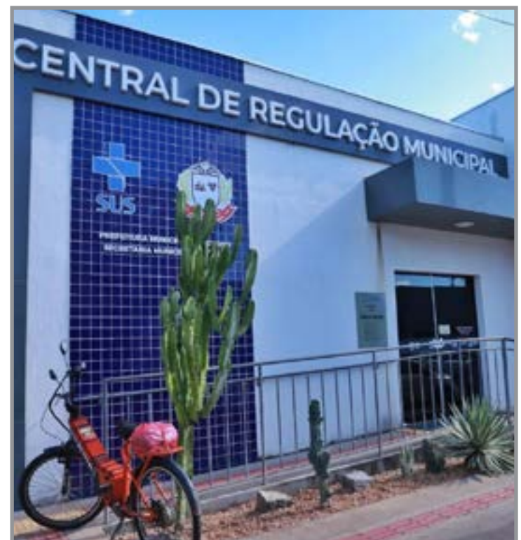
Cerca de 40% dos usuários não atendem as ligações