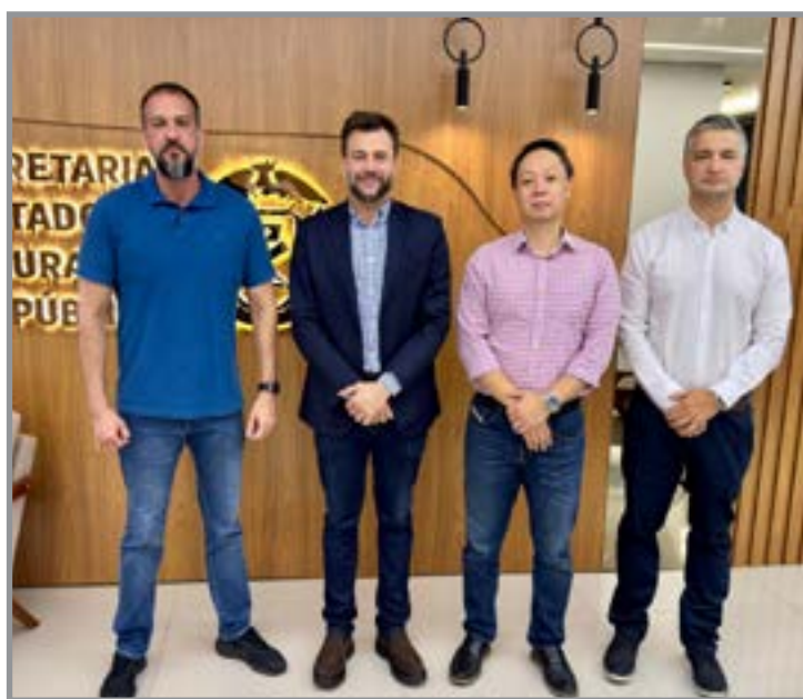
Monitoramento entra no pacote de segurança

A proposta de uma nova unidade policial busca adequar o espaço físico à demanda atual, garantindo melhores condições de trabalho aos profissionais e mais eficiência no atendimento à população. A administração municipal já contribuiu com a cessão de servidores para apoiar as atividades da Polícia Civil. Outro ponto destacado na reunião foi a necessidade de reforço no efetivo, com a designação de novos profissionais para acelerar investigações e ampliar a capa-