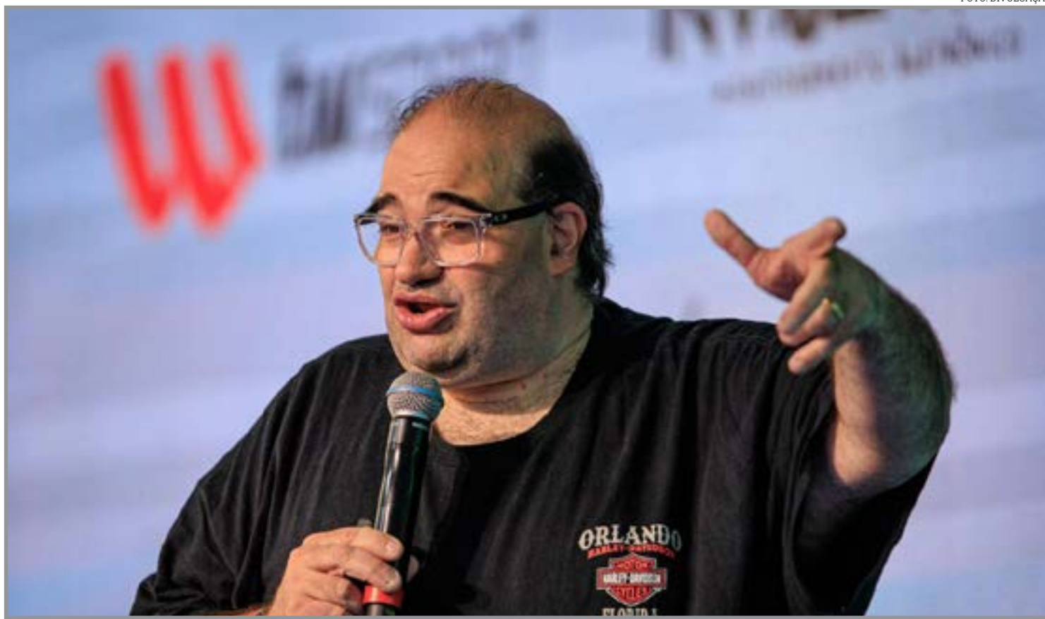
Evento focou na convergência entre tecnologia de ponta e produção agrícola