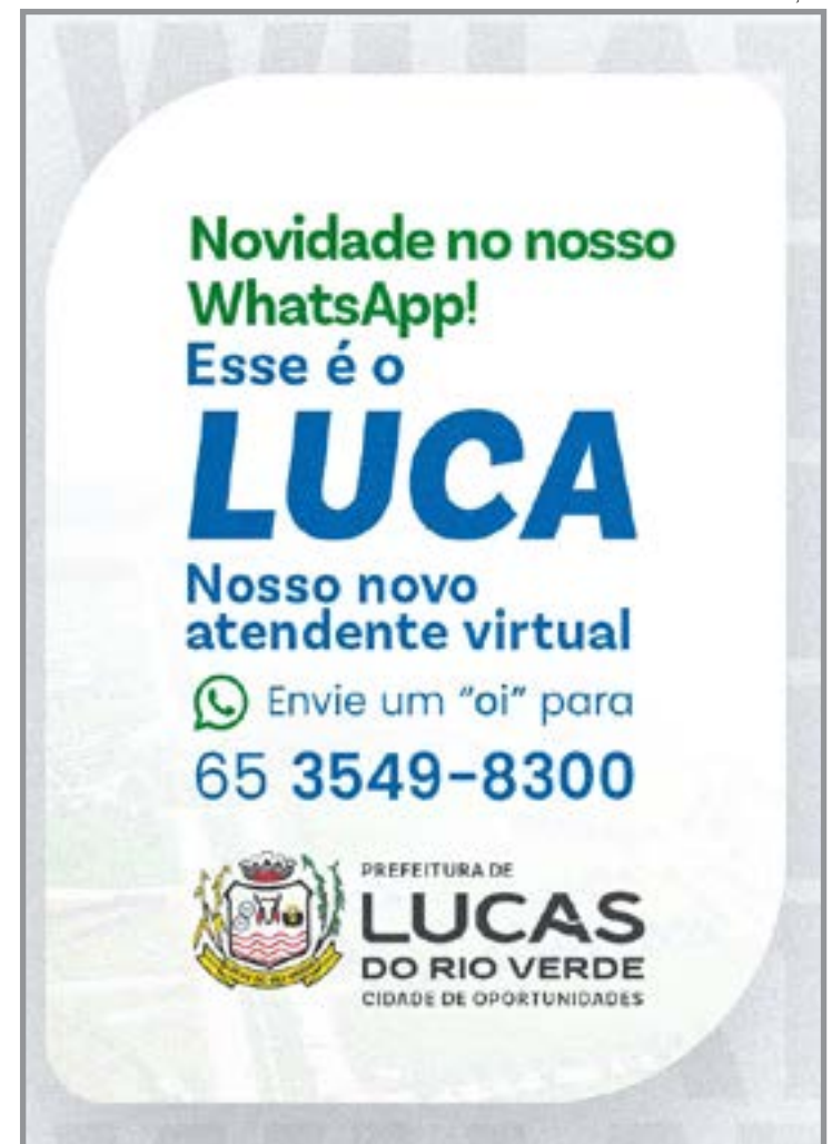
Sistema funciona 24h e amplia acesso digital

econômica do setor agrícola no município. Como resultado, cerca de 9,5 mil alunos da rede municipal são atendidos com alimentos produzidos localmente, o que reforça a qualidade nutricional da merenda e valoriza a produção regional.