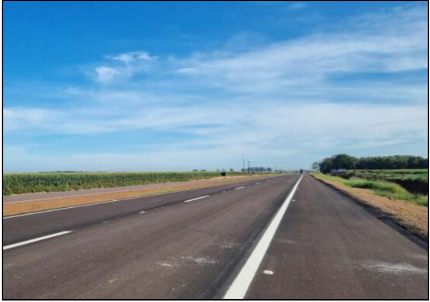
Nova Rota orienta os motoristas a respeitarem as indicações implantadas no local

Programação de obras: terça-feira (27 e 28) – manutenção; serão realizados serviços de manutenção do pavimento e dos sistemas de drenagem da rodovia. 8h: Interdição total para insta-