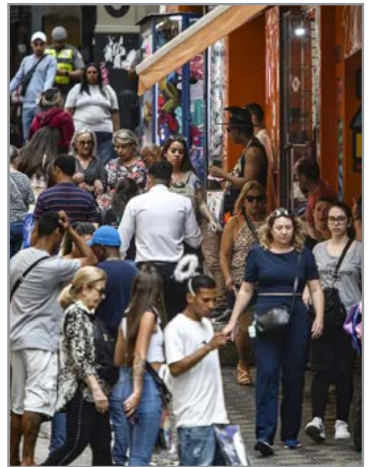
Pequenas empresas terão que usar emissor padrão da NFS-e