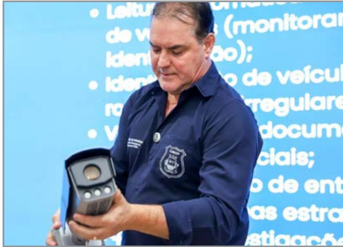
Sistema integra forças e usa reconhecimento