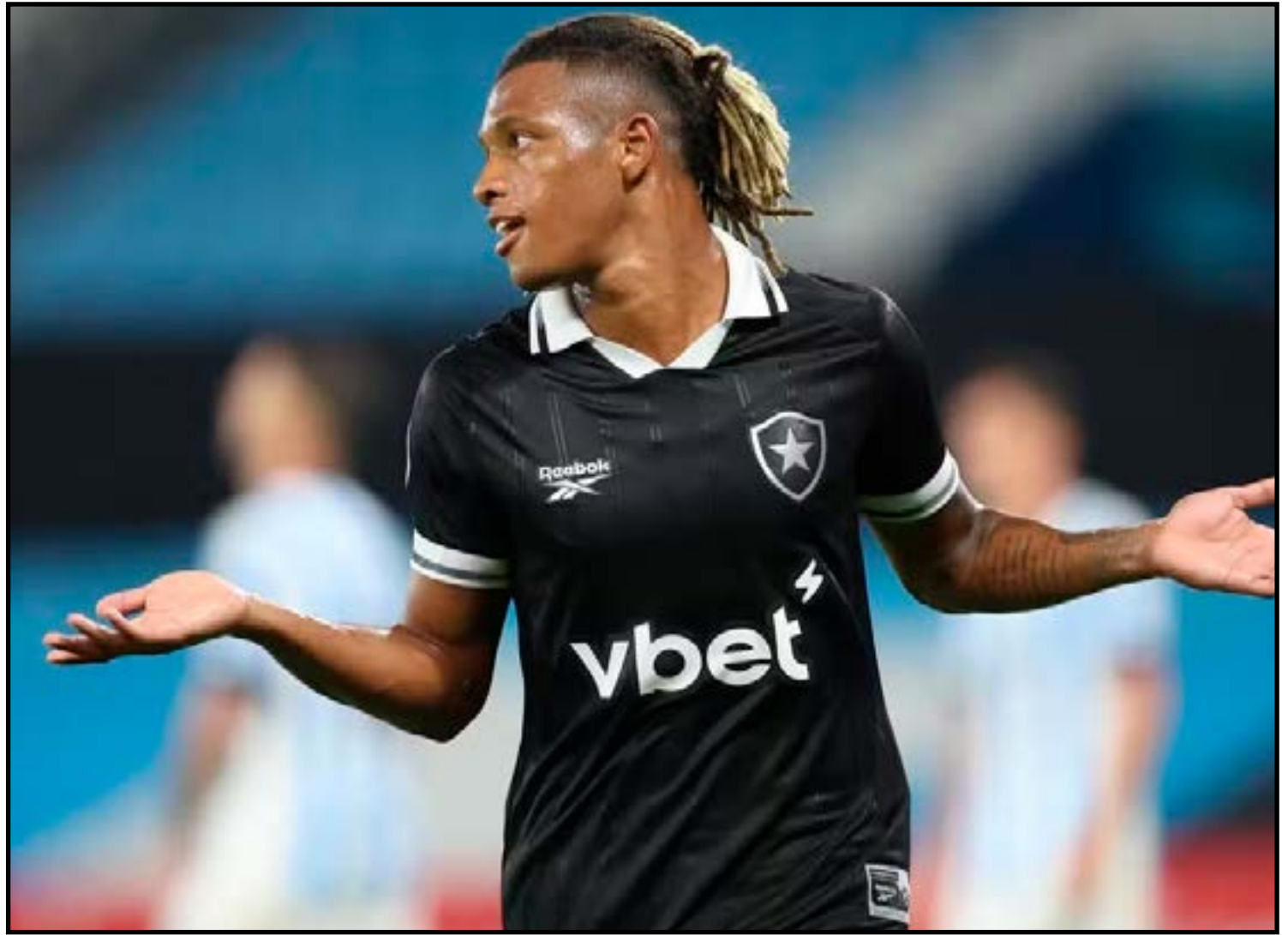
Clube projeta praticamente dobrar o valor investido na contratação

Sem a Eagle na mesa, a SAF do Botafogo entende que o cenário para debates com o clube social é mais aberto e com maior facilidade para um alinhamento.