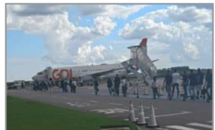
Obra convida crianças e famílias a refletirem sobre sentimentos como frustração