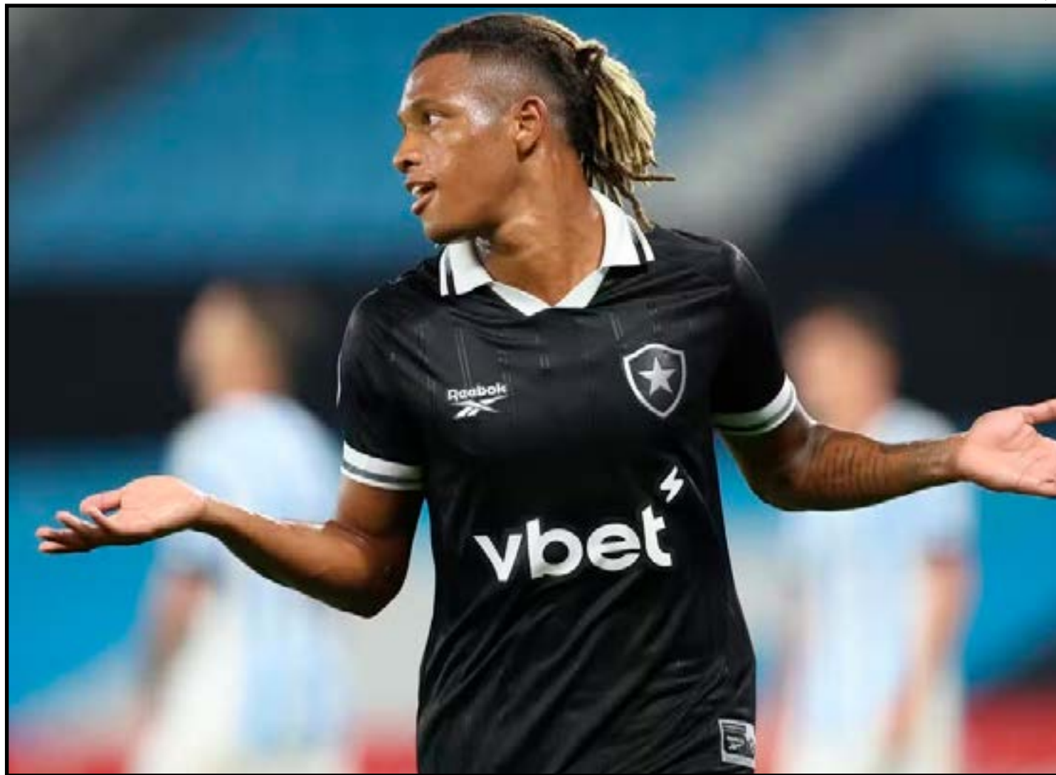
Clube projeta praticamente dobrar o valor investido na contratação

Sem a Eagle na mesa, a SAF do Botafogo entende que o cenário para debates com o clube social é mais aberto e com maior facilidade para um alinhamento.