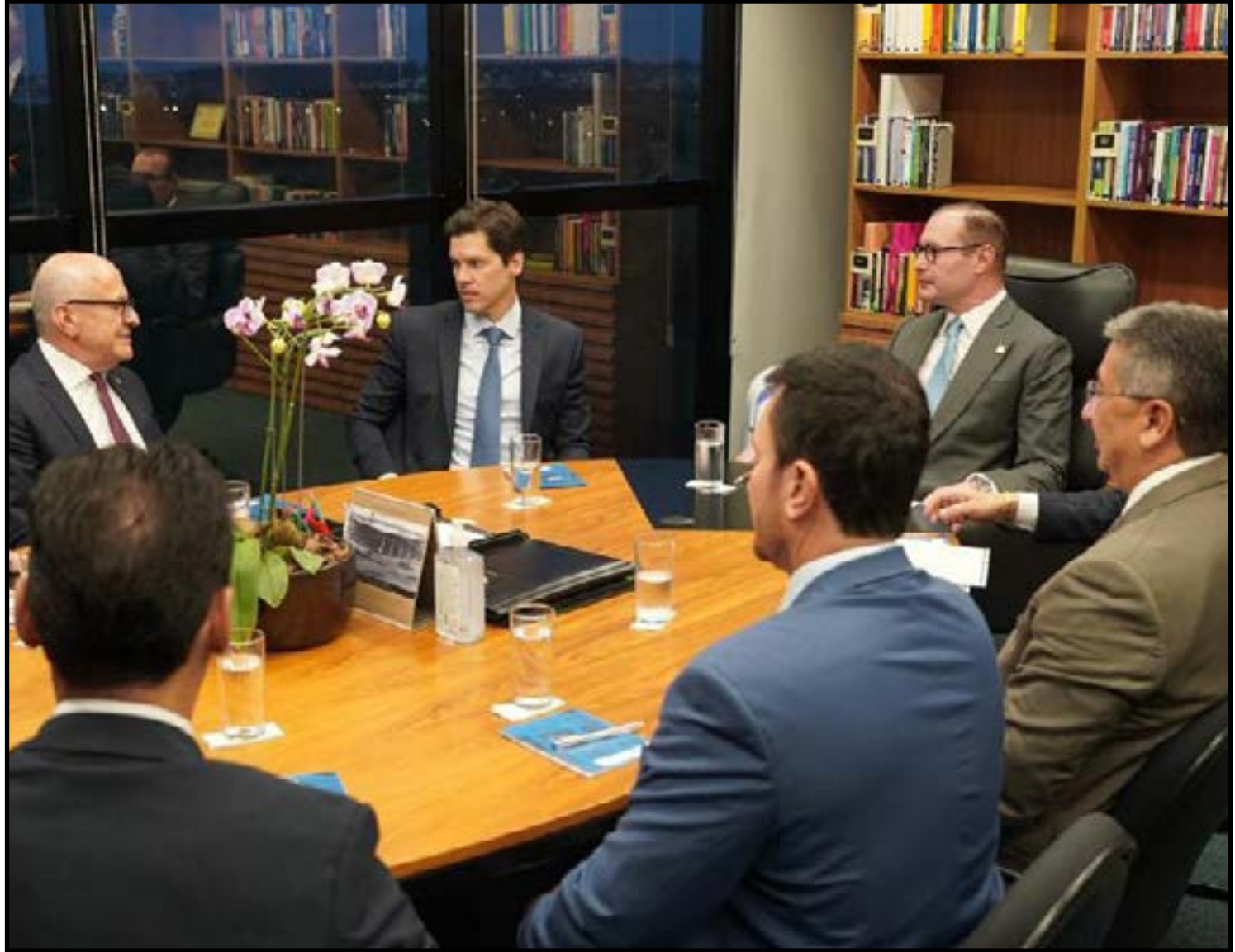
Governador participa de reunião em Brasília

Enquanto isso, as articulações políticas e institucionais seguem em andamento, com os estados buscando fortalecer seus argumentos técnicos e jurídicos para influenciar a decisão da Corte.