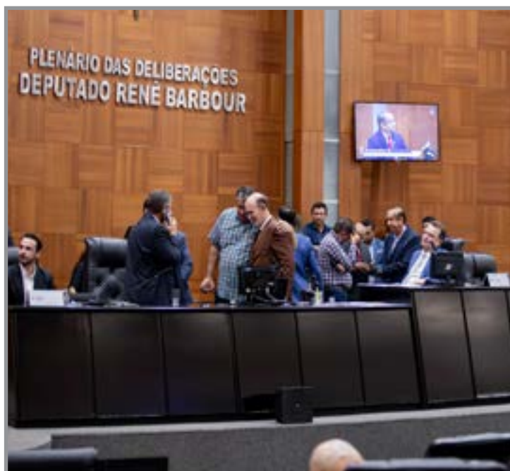
Mudanças ampliam comarcas e reforçam economia

O texto prevê atualizações no Estatuto dos Servido-