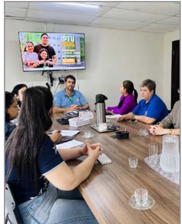
Conselho estadual avalia ações no município

isonomia no serviço público estadual", aponta o governo na justificativa encaminhada ao Legislativo.