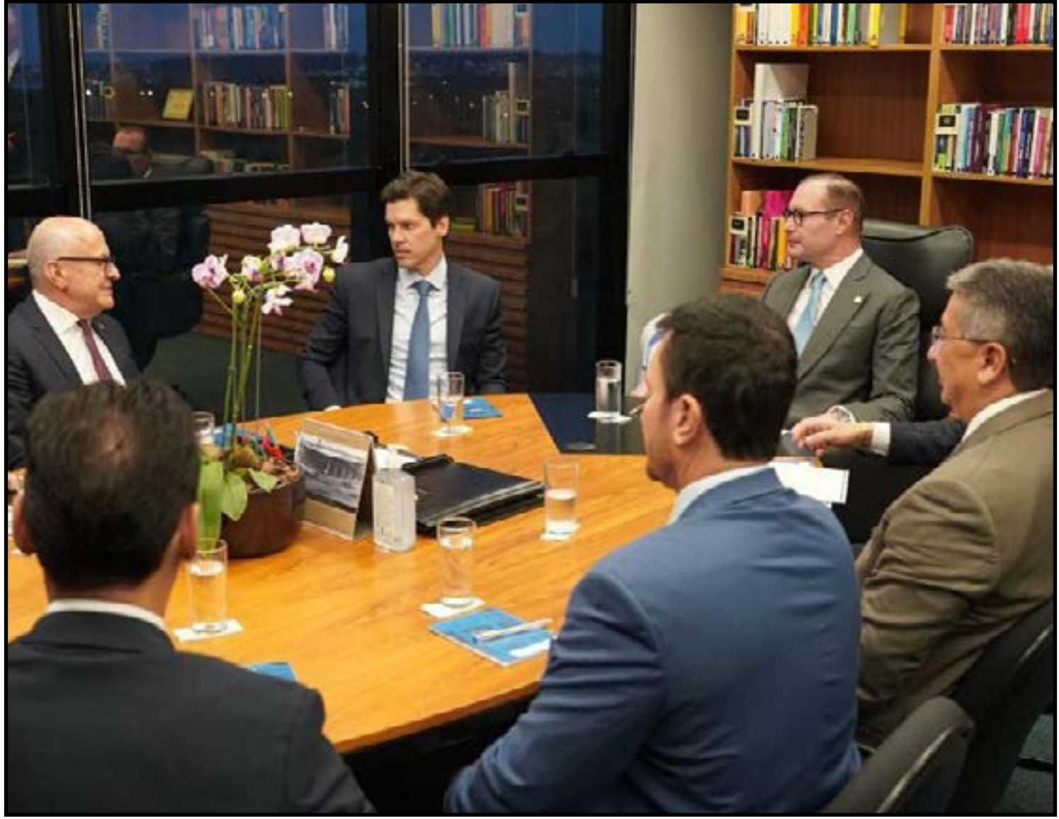
Governador participa de reunião em Brasília

Enquanto isso, as articulações políticas e institucionais seguem em andamento, com os estados buscando fortalecer seus argumentos técnicos e jurídicos para influenciar a decisão da Corte.