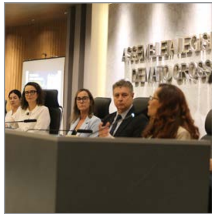
Dados indicam alta nas agressões entre jovens