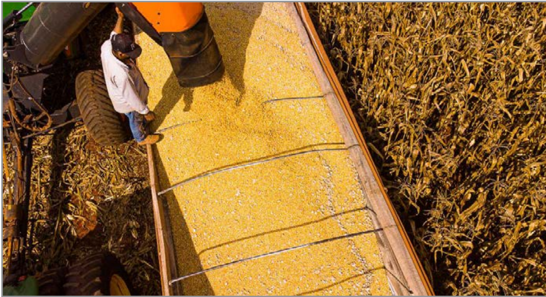
Estado líder na produção agropecuária do país

tado de Desenvolvimento Econômico, Mayran Beckman, o resultado reforça o papel do agronegócio como vetor de geração de renda