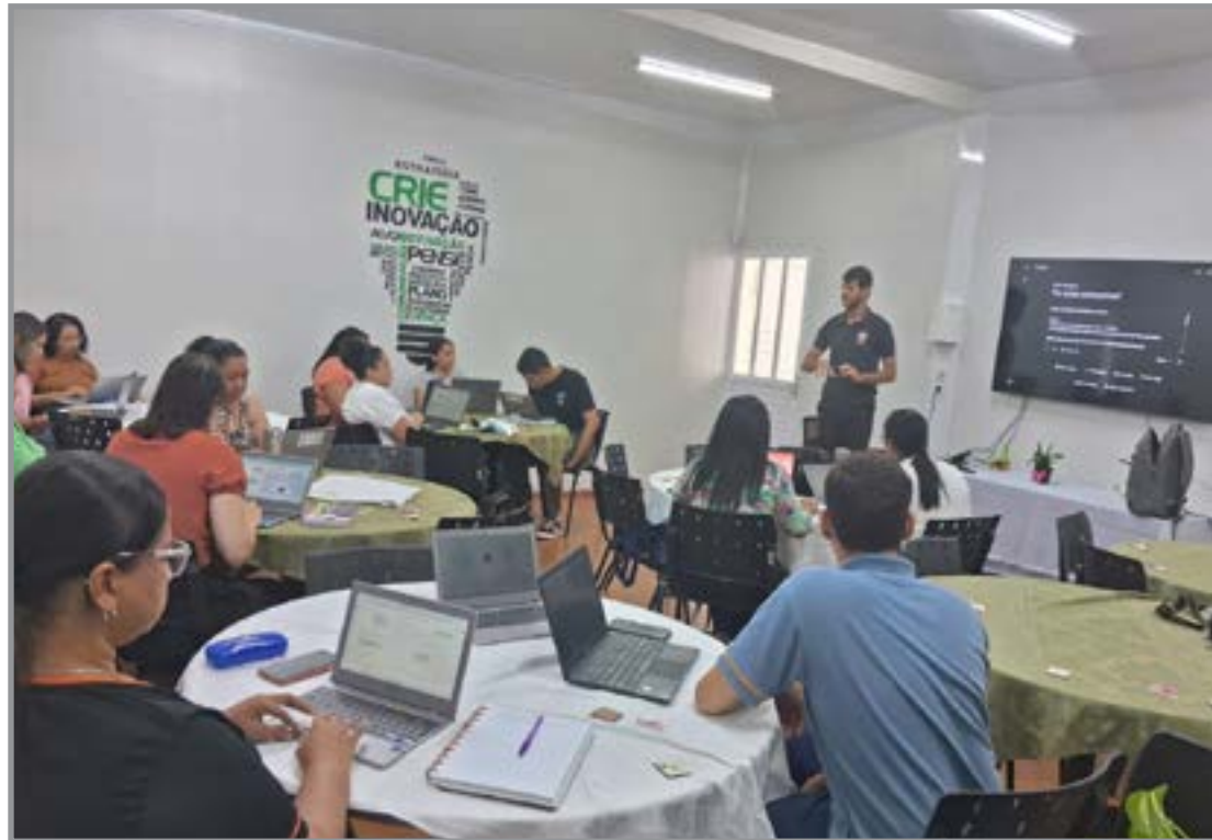
Capacitação orienta uso pedagógico da tecnologia

A iniciativa segue diretrizes do Ministério da Educação (MEC), que orienta as redes de ensino a se prepararem para o uso responsável da tecnologia. O objetivo é garantir que a presença cres-