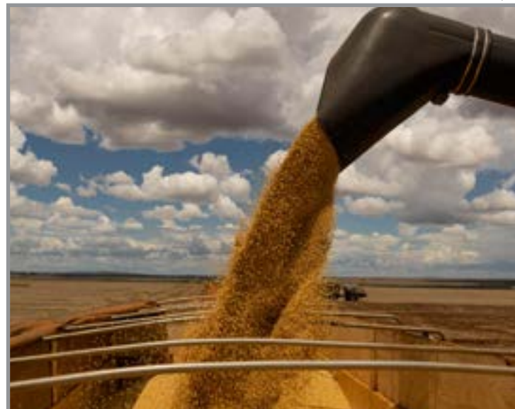
Colheita avançada, dólar em queda e incertezas globais limitam negociações

Os fundamentos seguem pressionando o mer-