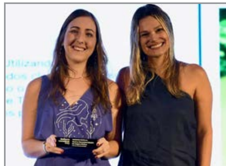
Serão selecionadas 10 empresas vencedoras de cada região do país