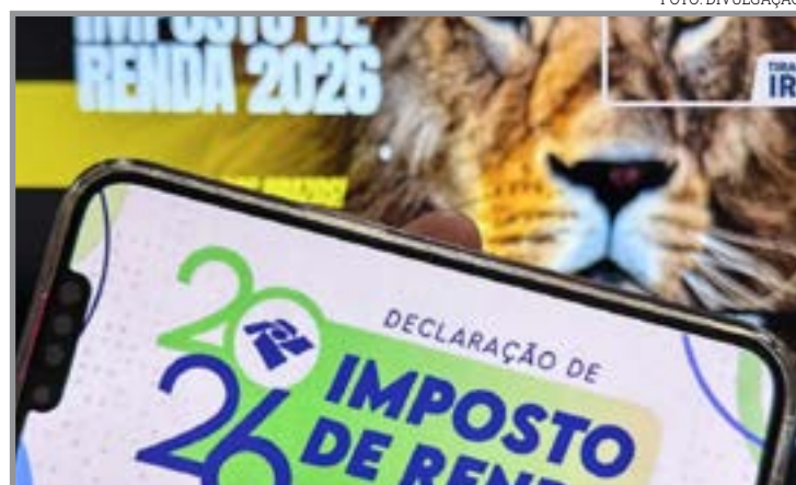
Receita recebeu 18,4 mi de documentos desde o início da entrega

Um total de 60% dos contribuintes que entregaram o documento à Receita Federal usaram a declaração pré-preenchida, por meio da qual o declarante baixa uma versão preliminar do documento, bastando confirmar as informações ou retificar os dados. A opção de desconto simplificado representa 55,3% dos envios. O prazo para entregar a declaração começou em 23 de março e termina às 23h59min59s de 29 de maio. O programa ge-