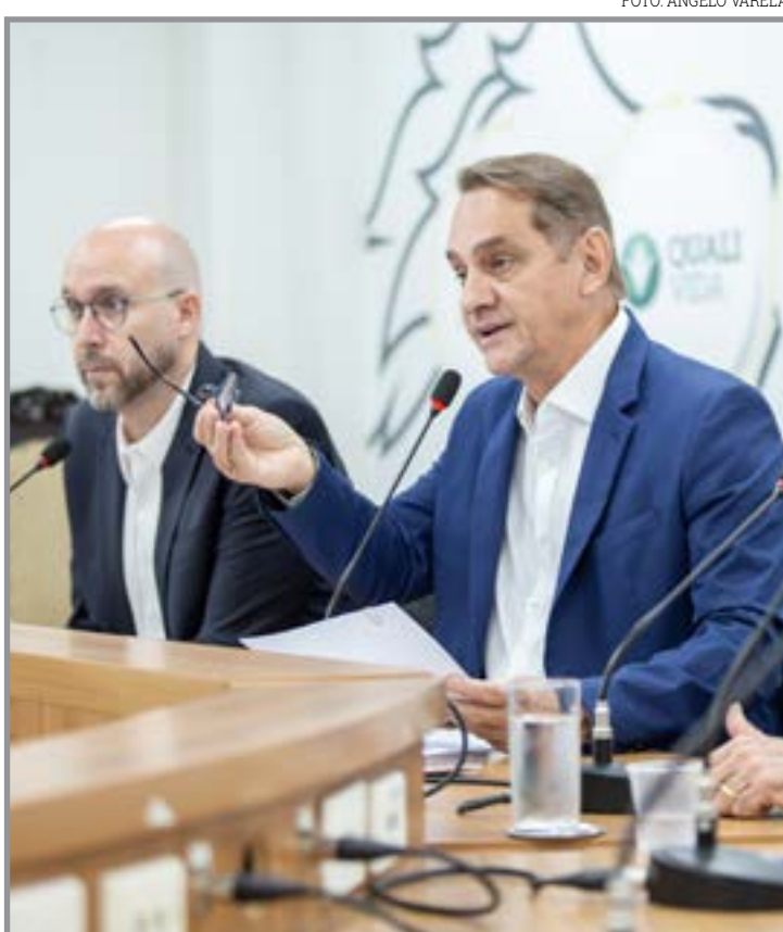
Investigações entram em nova fase técnica

A CPI busca esclarecer indícios de irregularidades em compras e contratos realizados entre 2019 e 2023, com atenção especial às aquisições feitas durante a crise sanitária da Covid-19. "Um trabalho eminentemente técnico, baseado em documentos, baseado em provas contundentes. Eu tenho certeza que a vinda deles vai nos ajudar a esclarecer com mais precisão algumas ações", finalizou.