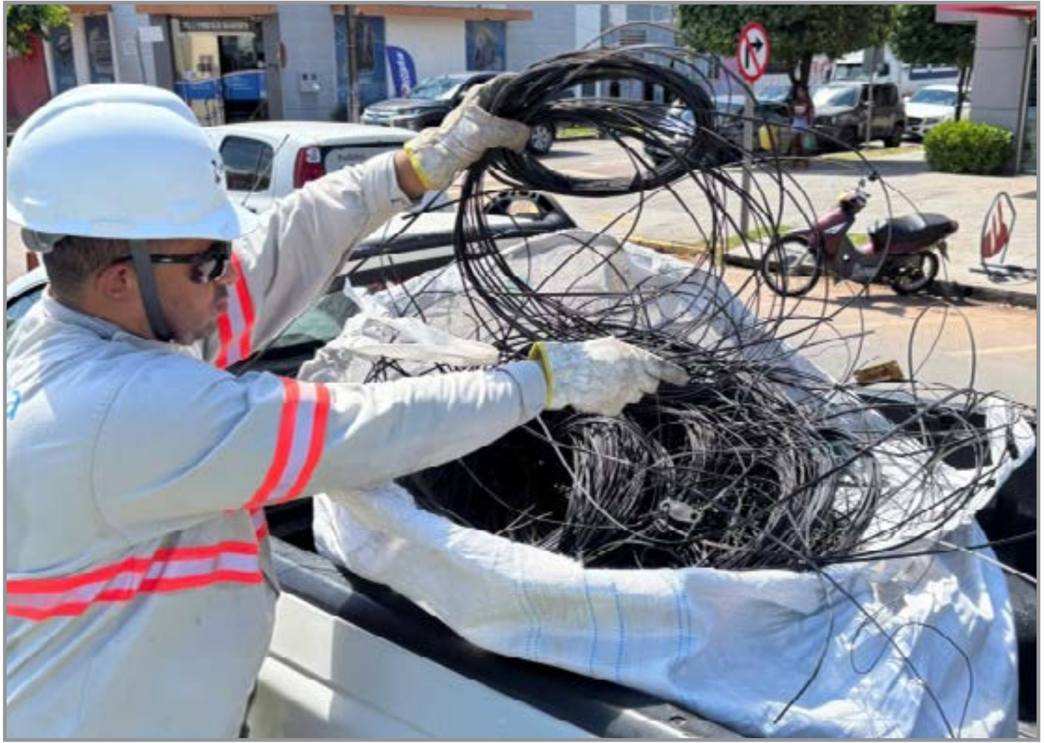
Mais de 1,5 mil kg de fios retirados dos postes

A Operação Cidade Limpa já contemplou as avenidas das Figueiras, Júlio Campos, Embaúbas, Tarumãs, Jacarandás, Bruno Martini e Acácias. O objetivo, sobretudo, é garantir a segurança dos usuários das vias públicas do município.