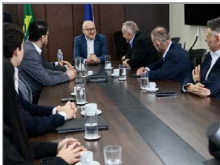
Estado amplia relações comerciais com Itália

A estratégia passa pela transformação de matérias-