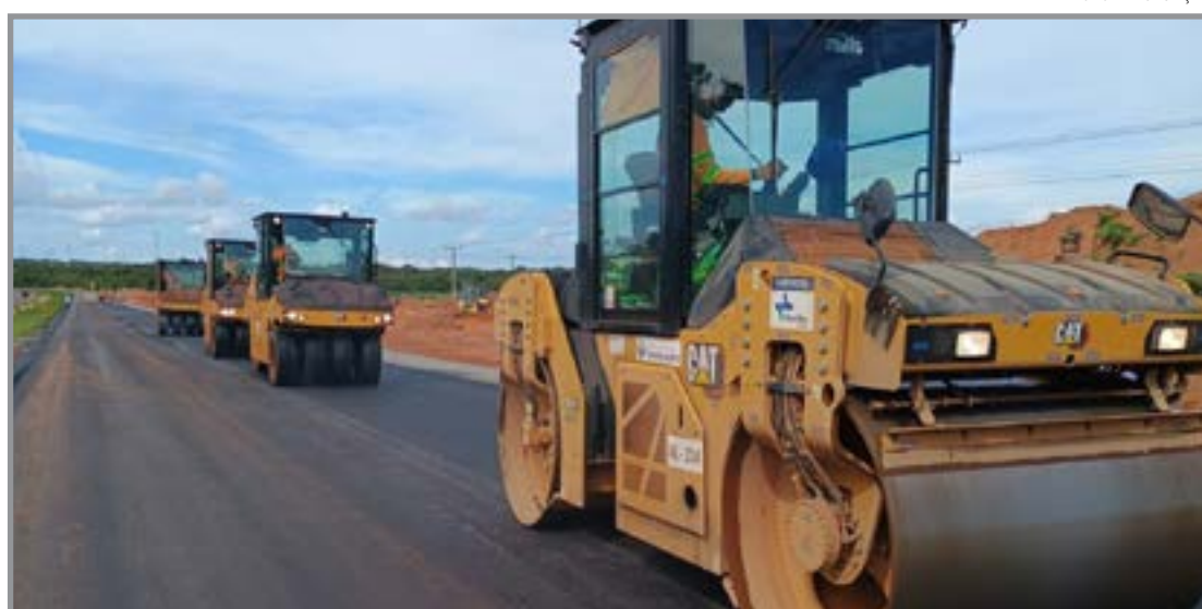
Fluxo de veículos foi liberado entre o km 812 e o km 816, região da Inpasa

A liberação integra o cronograma de duplicação da BR-163 no norte de Mato Grosso, que segue em ritmo acelerado. As obras contemplam a ampliação da capacidade da rodovia, além da