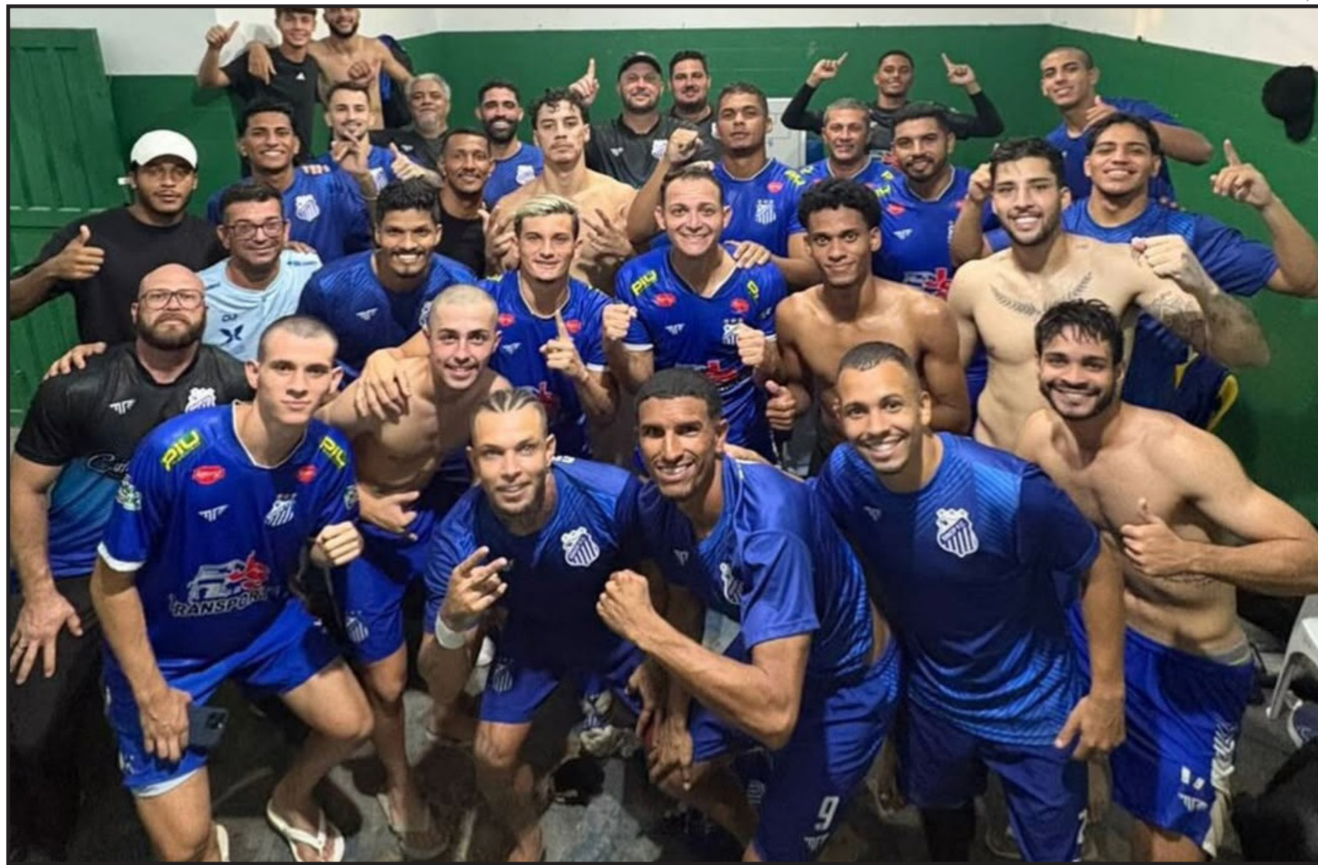
Equipe tem 100% de aproveitamento na competição

Em caso de vitória contra o Santa Cruz, o Galo do Norte precisará de apenas um ponto contra o praticamente eliminado Campo Novo, fora de casa. Se empatar, vai para