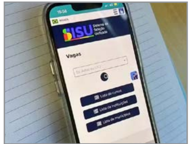
Intenção do MEC é preencher vagas remanescentes nas instituições públicas participantes