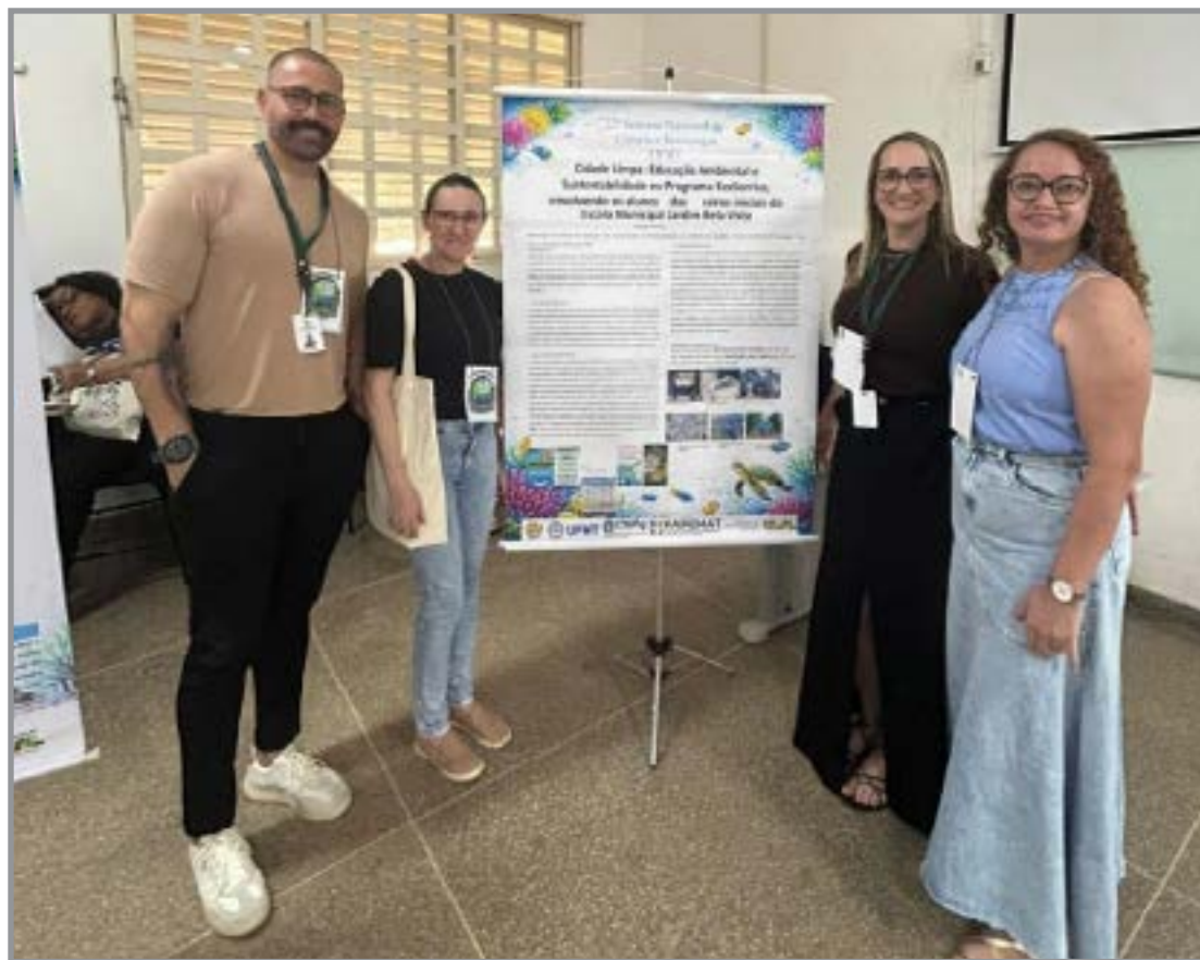
Docentes de Sorriso avançam com pesquisa ambiental