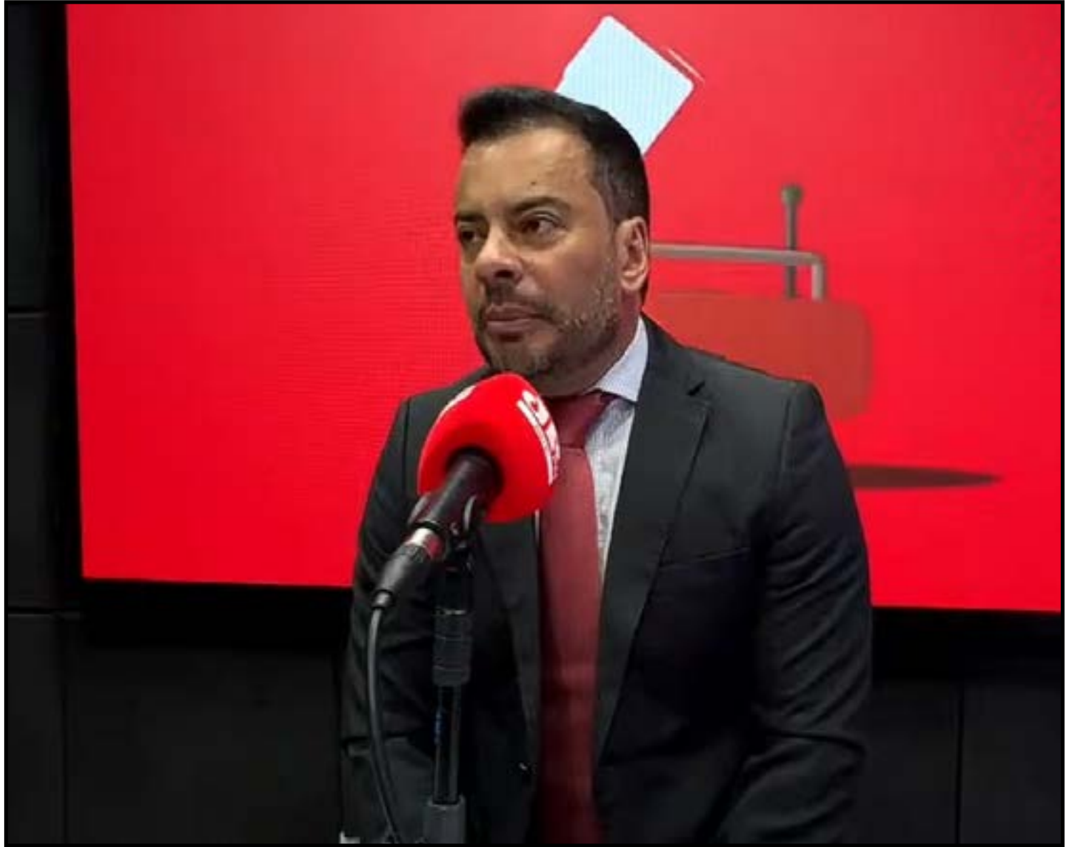
Justiça intensifica ações e faz apelo final

Para acelerar a regularização, mutirões vêm sendo realizados para ampliar o atendimento e evitar filas de última hora. Mas o prazo está no limite. "Os mutirões servem para atender o maior número de pessoas possível. Até o dia 6 de maio dá pra regularizar. Depois disso, não dá. Quem não regularizar não vota. É importante procurar a Justiça Eleitoral e ficar apto, porque é através do voto que a gente promove mudanças", concluiu.