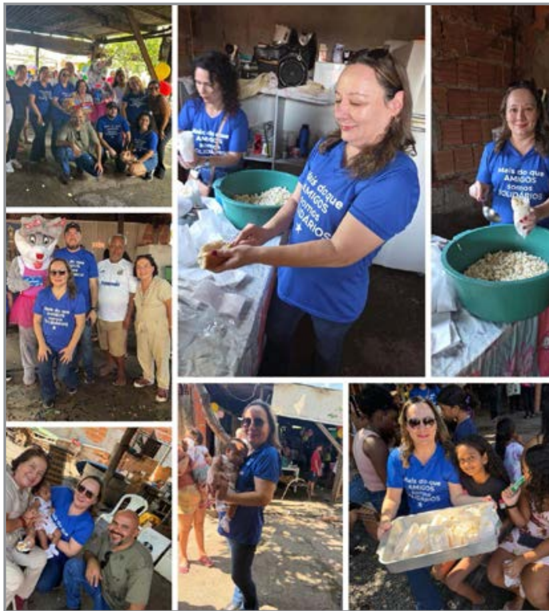
Ação foi realizada no último dia 25/04 no Distrito Sampaio, próximo ao Pedra 90

O grupo, que neste ano completa 15 anos de atuação em ações sociais, já programa novas iniciativas ao longo do ano, com o objetivo de continuar levando atenção, cuidado e presença às comunidades. Todas as ações do grupo são realizadas por meio de doações dos próprios membros e de amigos próximos, que contribuem diretamente para que cada iniciativa se concretize. A ação reafirma a importância de iniciativas coletivas que se traduzem em gestos concretos e fazem diferença na vida de quem participa.