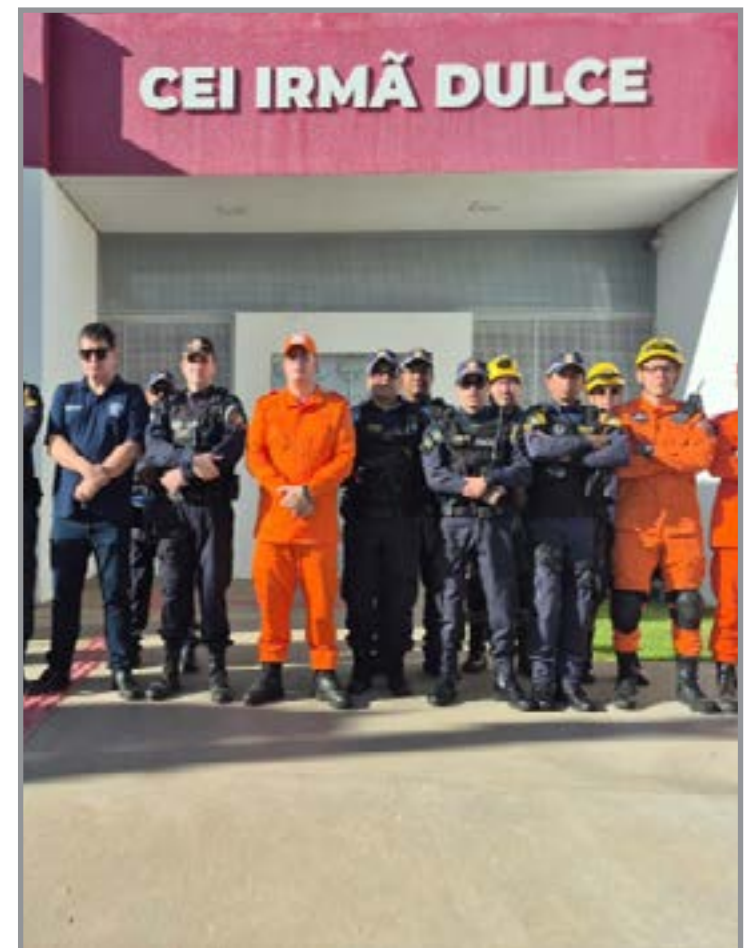
Programação inclui blitz e ações educativas