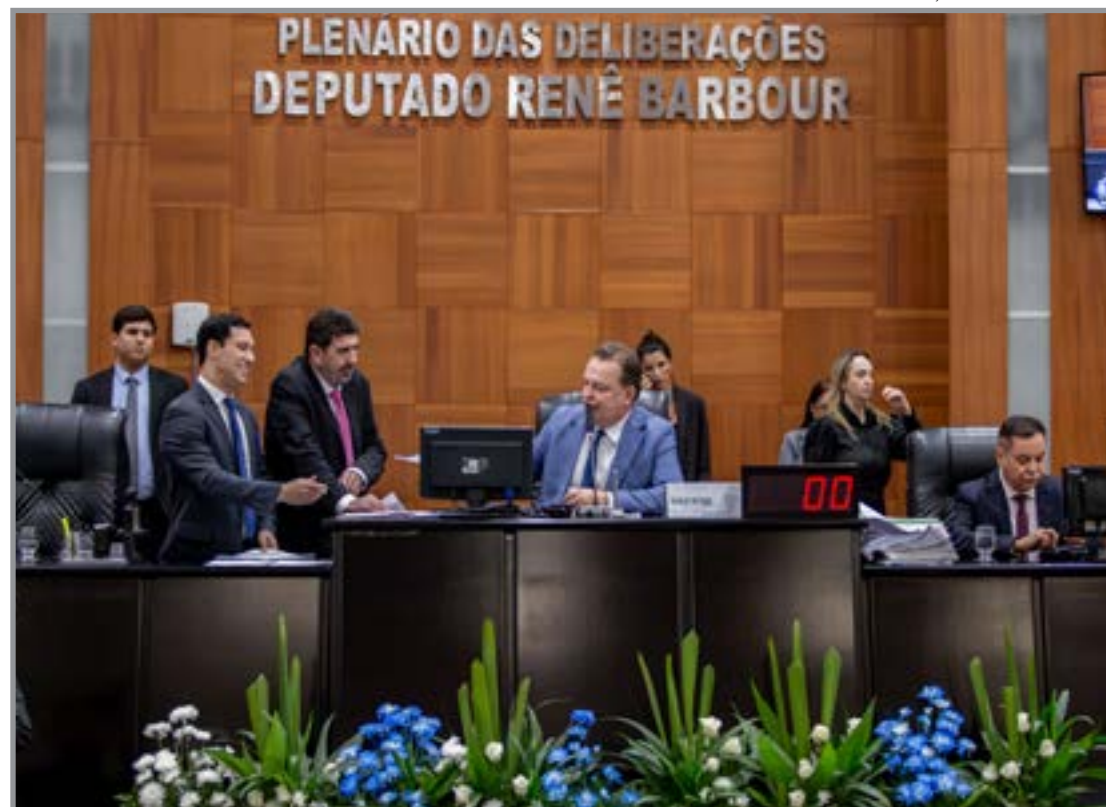
Medida busca conter alta do diesel no estado

A intenção é evitar que o aumento chegue ao consumidor final, especialmente no transporte de cargas, que depende diretamente do diesel para escoamento da produção e abastecimento interno. Além do subsídio, o projeto também mantém congelada a base de cálculo do Fundo Estadual de Trans-