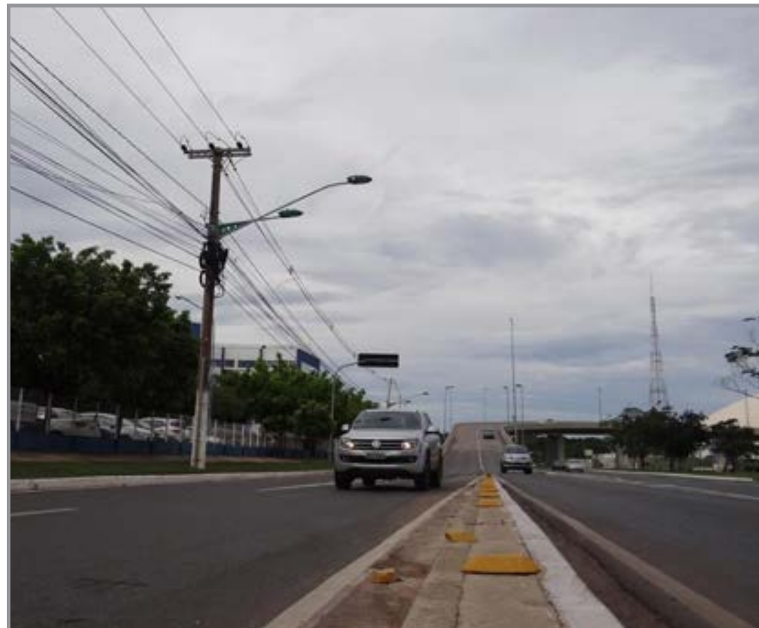
Benefício pode ser ampliado com pontos do Nota MT

Além dos descontos previstos no calendário, participantes do programa Nota MT também podem garantir abatimento adicional no imposto. Os pontos acumulados podem ser utilizados para reduzir em até R$ 700 o