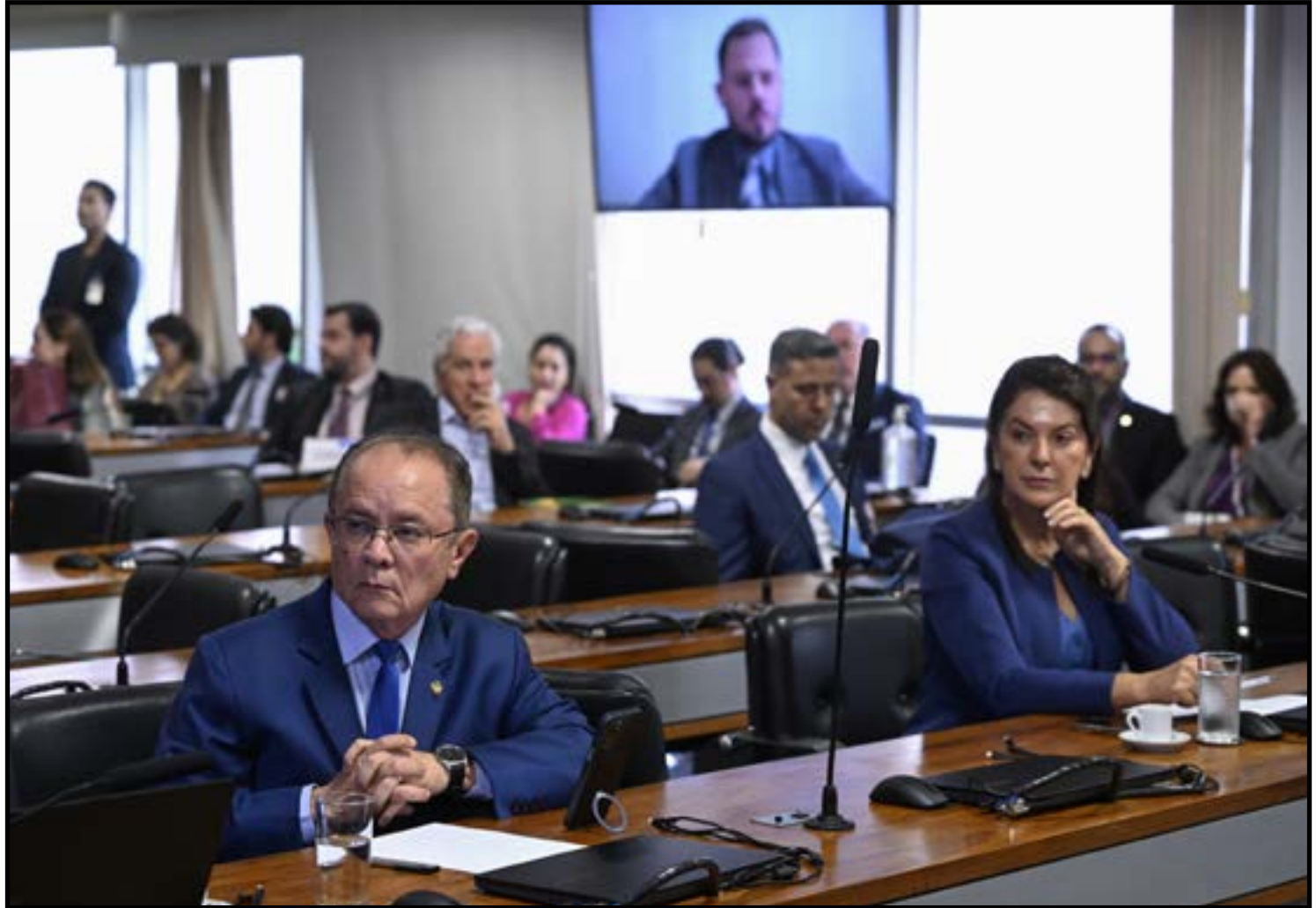
Debate cita risco de distorções no mercado

Criada em 2006, a moratória restringe a comercialização de soja oriunda de áreas desmatadas na Amazônia após uma data de corte, mesmo quando a atividade ocorre dentro dos limites legais. Esse modelo tem sido alvo de críticas por parte de produtores e entidades do agro, que apontam prejuízos comerciais e barreiras adicionais ao mercado. O tema segue em análise no Supremo Tribunal Federal, que encaminhou a questão para mediação, enquanto o setor produtivo cobra maior segurança jurídica e previsibilidade nas regras.