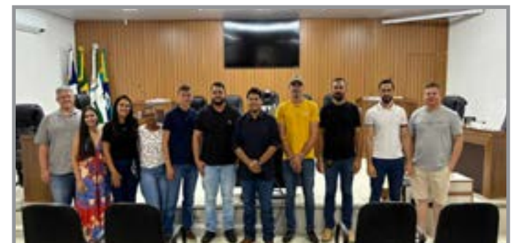
Durante a reunião, foi confirmada a Expocarmem para agosto