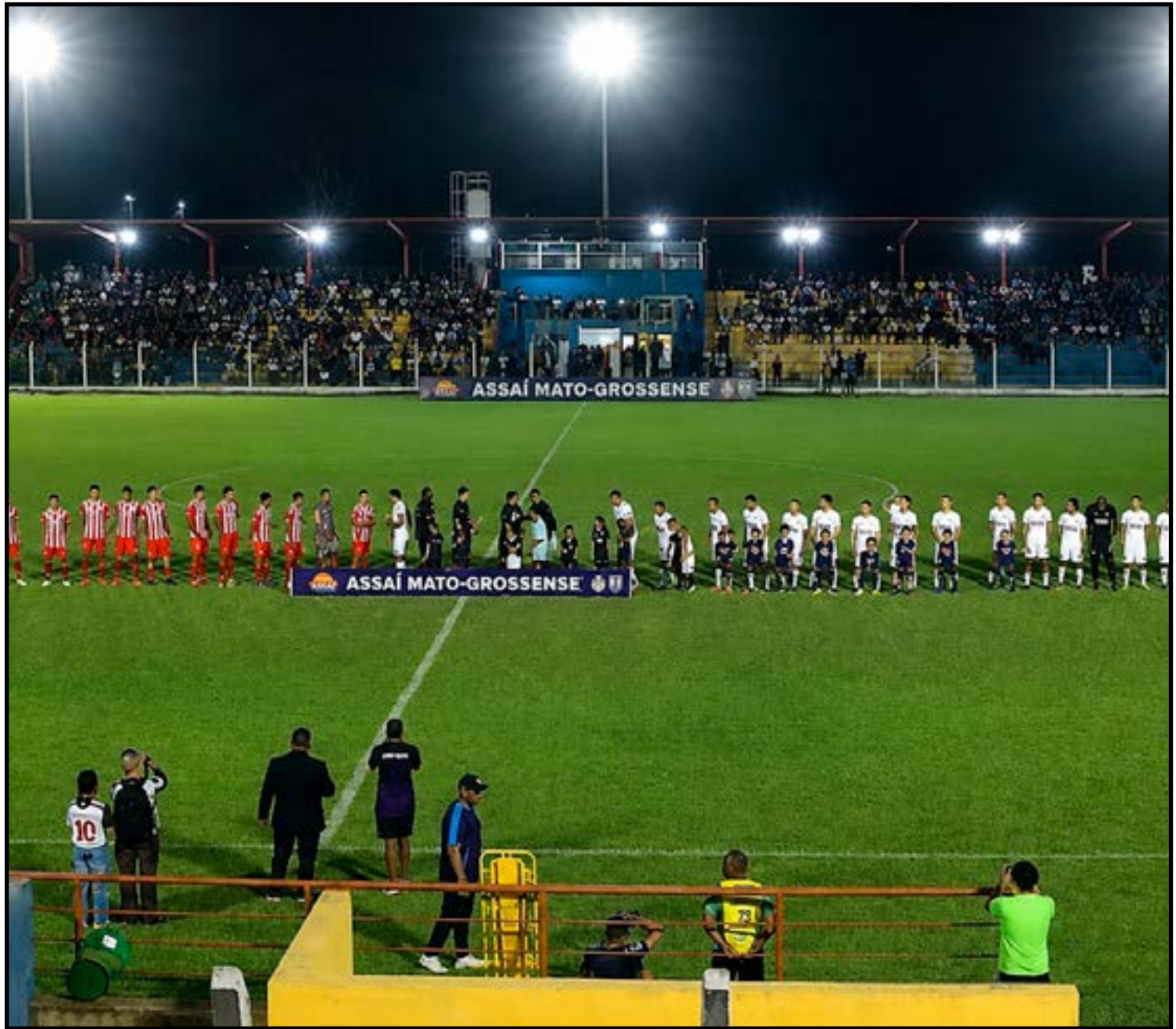
Ótimo público no Geraldão