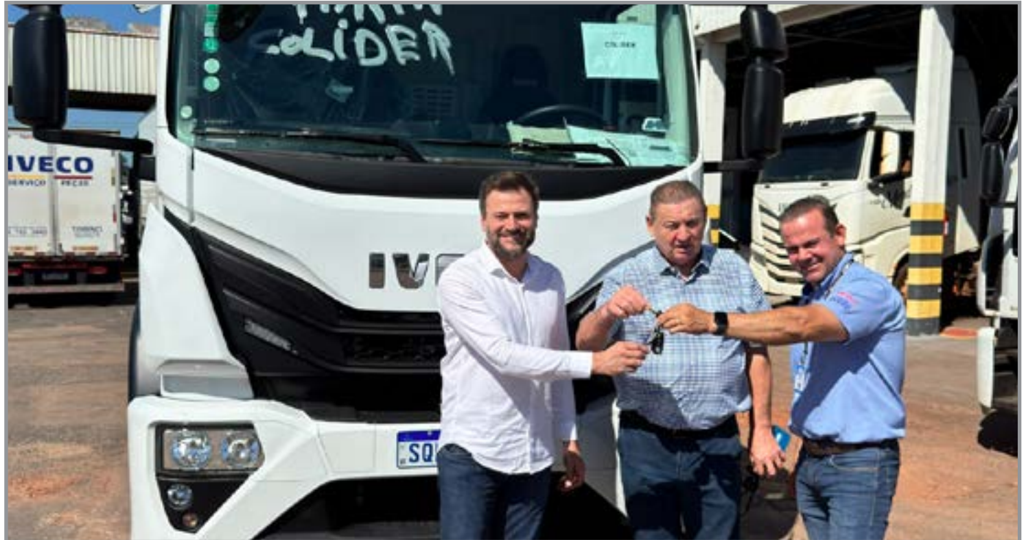
Entrega aconteceu em Cuiabá

Além da utilização nas estradas rurais, o veículo deverá atuar no apoio às obras