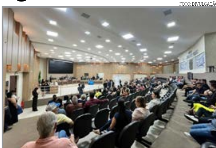
Prédio levará nome do ex-presidente, morto na última sexta

Já o Requerimento nº 37/2026 pede informações