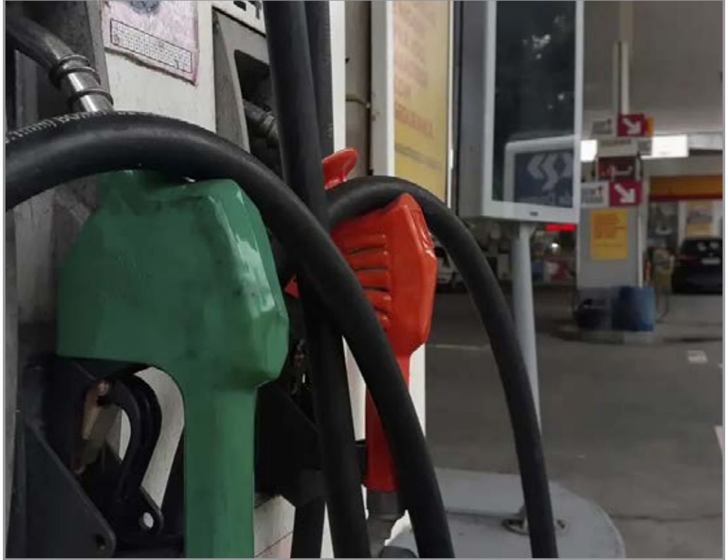
Postos de gasolina exibem o preço do combustível

ao redor de US$ 120. Na tarde desta quarta-feira, beira os