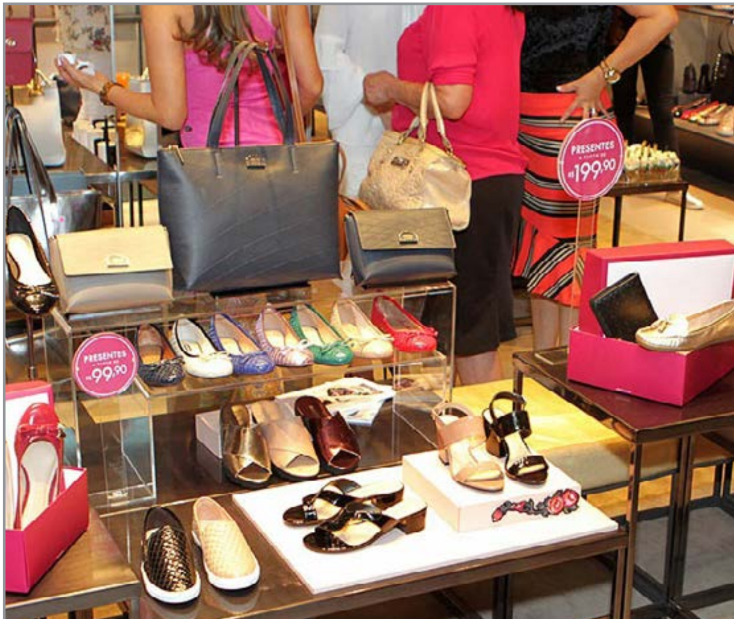
Movimentação nos últimos dias para presentear as mães

A expectativa do setor é que o Dia das Mães de 2026 mantenha o cenário positivo registrado pelo comércio nos últimos meses, impulsionando as vendas e fortalecendo o varejo regional.