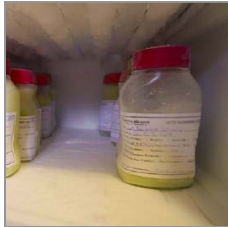
Maio Branco alerta para riscos da desmama

A programação inclui orientações nas unidades de saúde, ações educativas e fiscalização em estabelecimentos comerciais, ampliando o alcance das medidas.