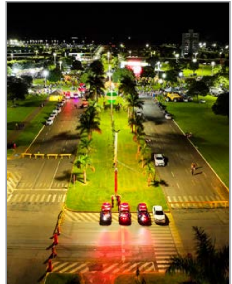
Atuação integrada das forças de segurança e equipes de apoio