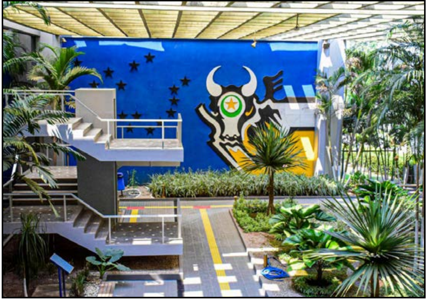
Debate cita risco de distorções no mercado

O tema segue em análise no Supremo Tribunal Federal, que encaminhou a questão para mediação, enquanto o setor produtivo cobra maior segurança jurídica e previsibilidade nas regras.