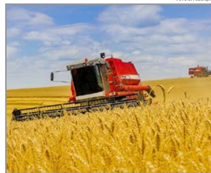
MT segue na liderança do agro brasileiro

as mudanças provocadas pela reforma tributária e sobre as medidas que precisam ser adotadas ainda neste ano. "A CNM é a entidade nacional que representa aproximadamente 5,2 mil municípios dos 5,57 mil existentes no país. A entidade está levando conhecimento sobre a reforma tributária e sobre as atualizações da legislação para todo o Brasil. Estamos percorrendo Mato Grosso e outros estados para levar conhecimento e alinhamento sobre a reforma tributária e, mais do que isso, apresentar as informações necessárias para que os municípios se adequem ainda neste ano", afirmou.