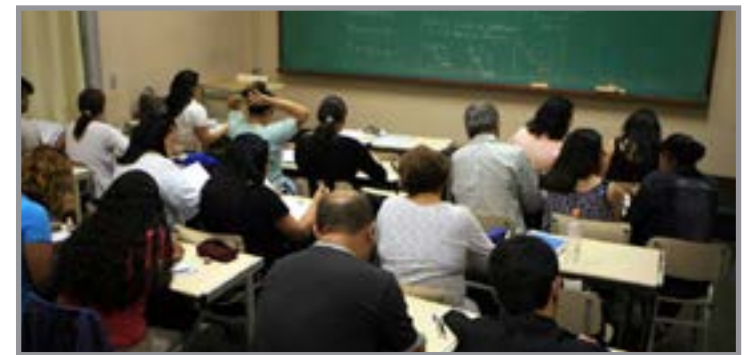
Município aposta em alfabetização comunitária