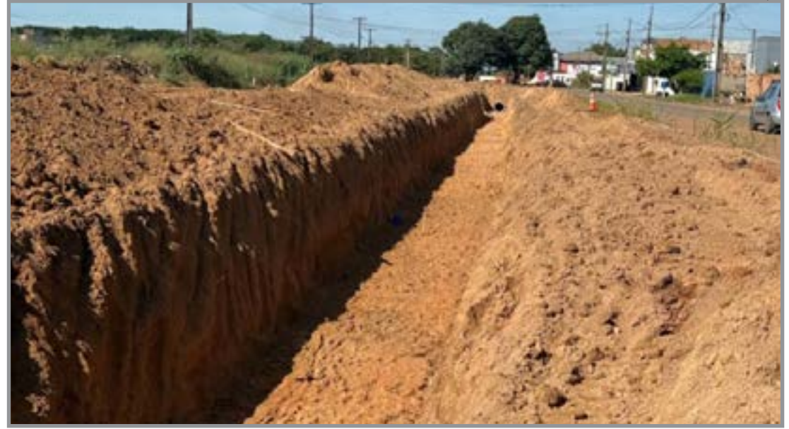
Obras em diversos pontos da região centro-sul da cidade