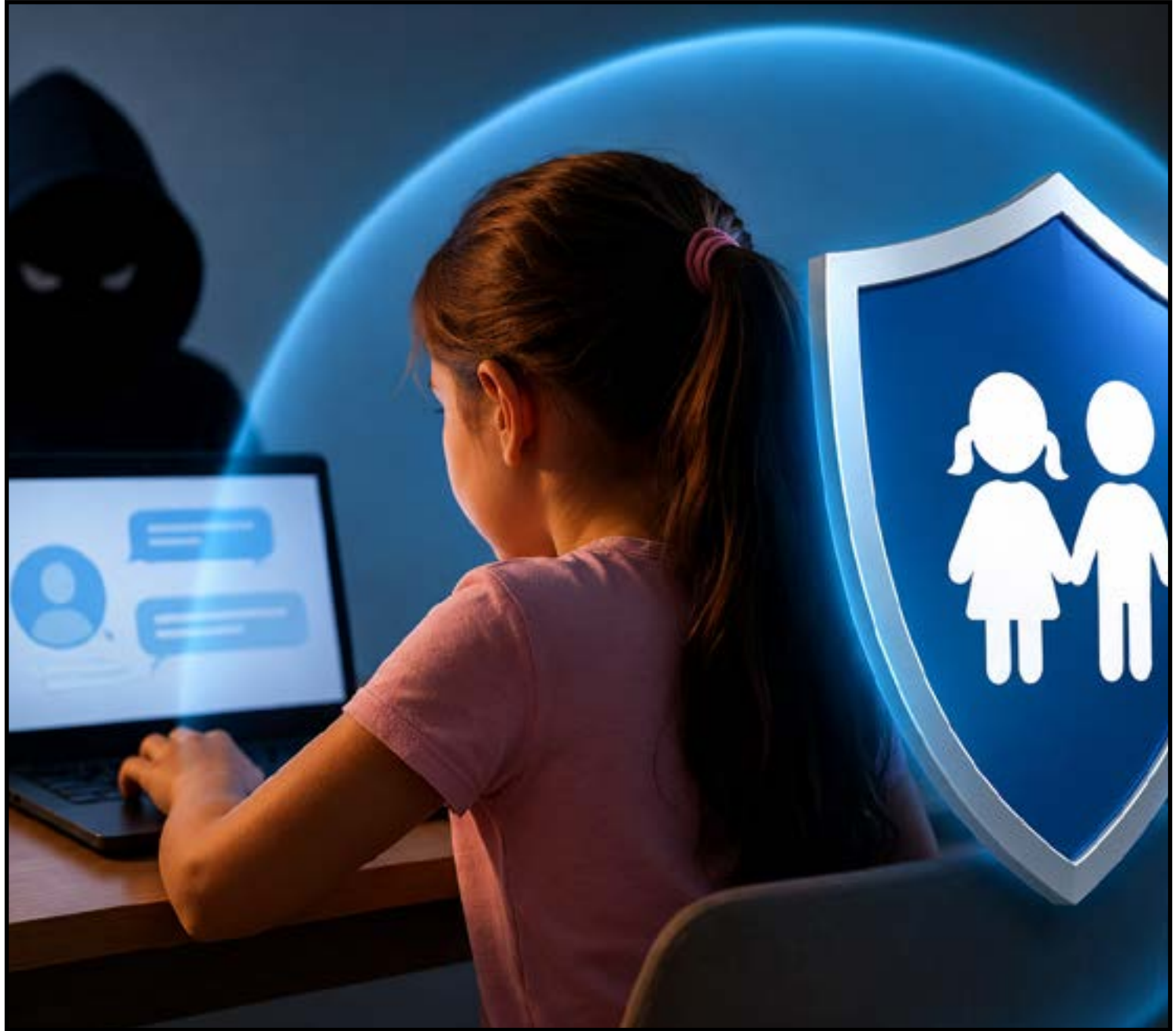
Texto prevê campanhas e prevenção nas escolas

A matéria ainda prevê restrições administrativas para pessoas condenadas judicialmente por crimes digitais contra menores. Entre as medidas estão impedimentos de participação em projetos, programas e atividades ligadas ao público infantojuvenil promovidas pelo Estado. Com caráter preventivo e educativo, o projeto não cria novos cargos nem despesas obrigatórias ao poder público, permitindo que as ações sejam incorporadas às políticas já existentes. Agora, a proposta segue em tramitação na Assembleia Legislativa, passando pelas comissões temáticas antes de ser analisada em plenário pelos deputados estaduais.