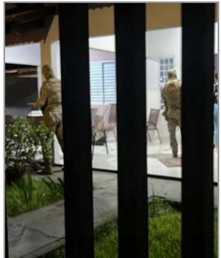
Caso aconteceu na noite de segunda-feira