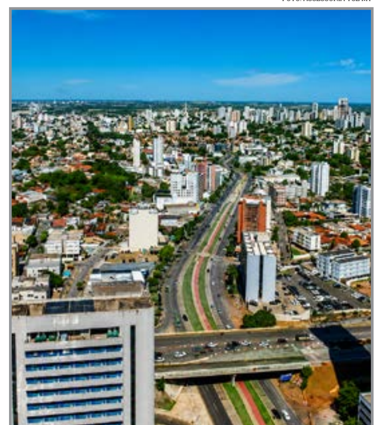
Estado orienta gestores sobre regras da eleição