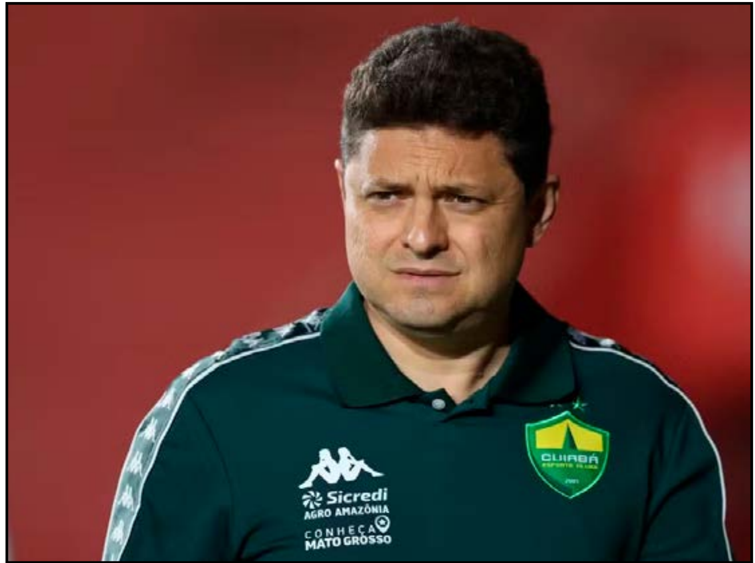
Resposta do clube pernambucano eleva tensão e expõe novo capítulo de desgaste institucional

A diretoria pernambucana informou ainda que, após a quebra do protocolo de se-