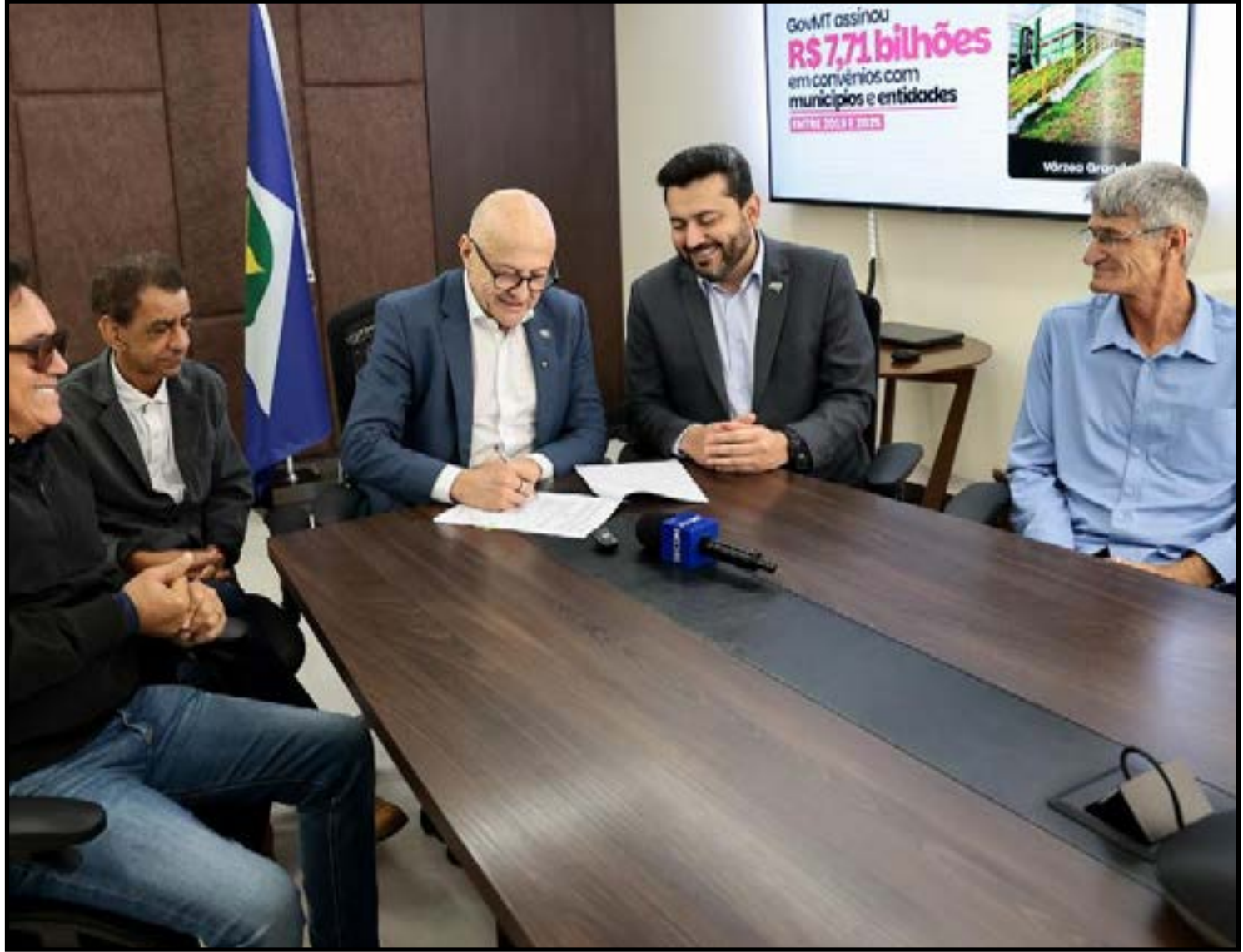
Primeiro repasse, referente ao 1º quadrimestre, é de R$ 36 milhões