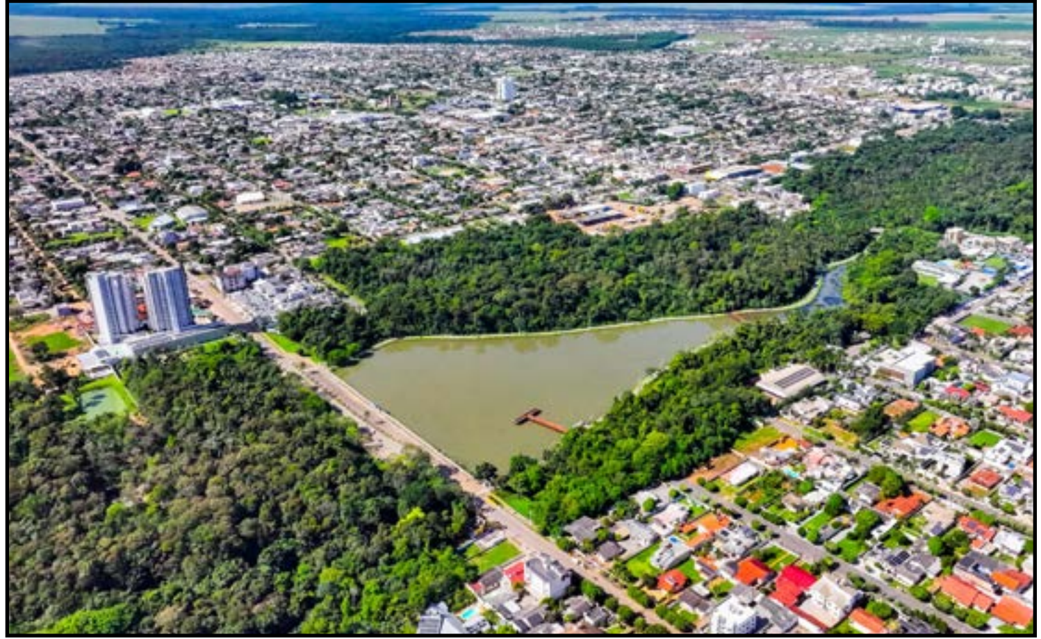
Projeto Cidades Mais Inteligentes

"Com essa seleção, a cidade passa a contar com