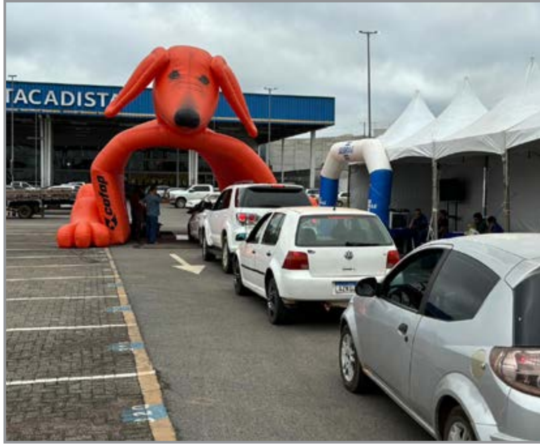
Ação gratuita promovida pelo Sebrae/MT

Esse foi o caso da Lidiane Baeta, que aproveitou a ida ao atacadista para cuidar do carro e da saúde. "Achei essa ação muito importante porque, no dia a dia, mui-