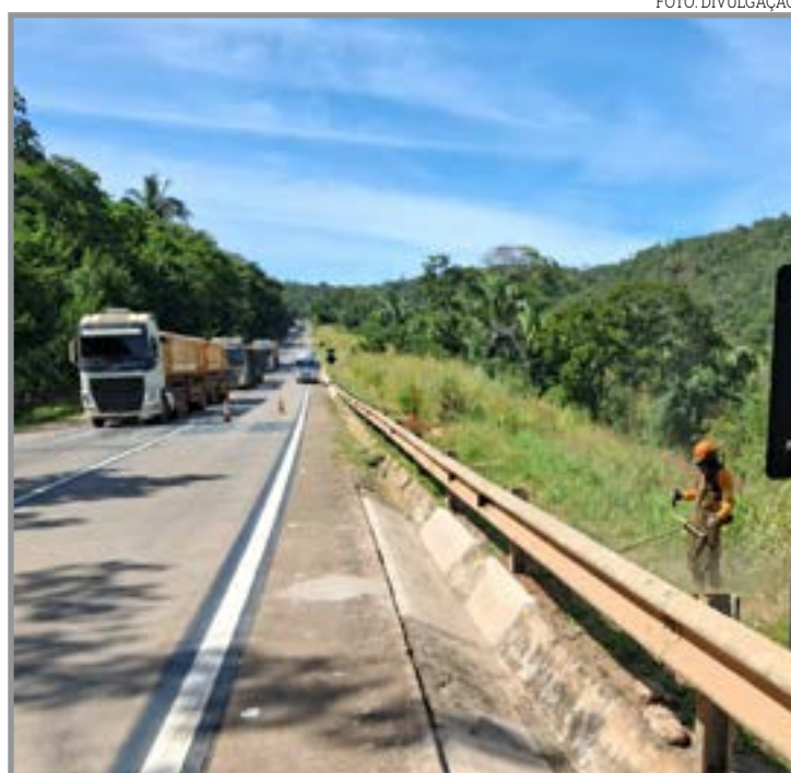
Intervenção é realizada para manutenção da rodovia

A central de atendimento funciona 24 horas. Neste canal de comunicação, também podem ser acionados todos os serviços oferecidos pela Nova Rota aos motoristas que estão na rodovia, como atendimento operacional, socorro médico e mecânico.