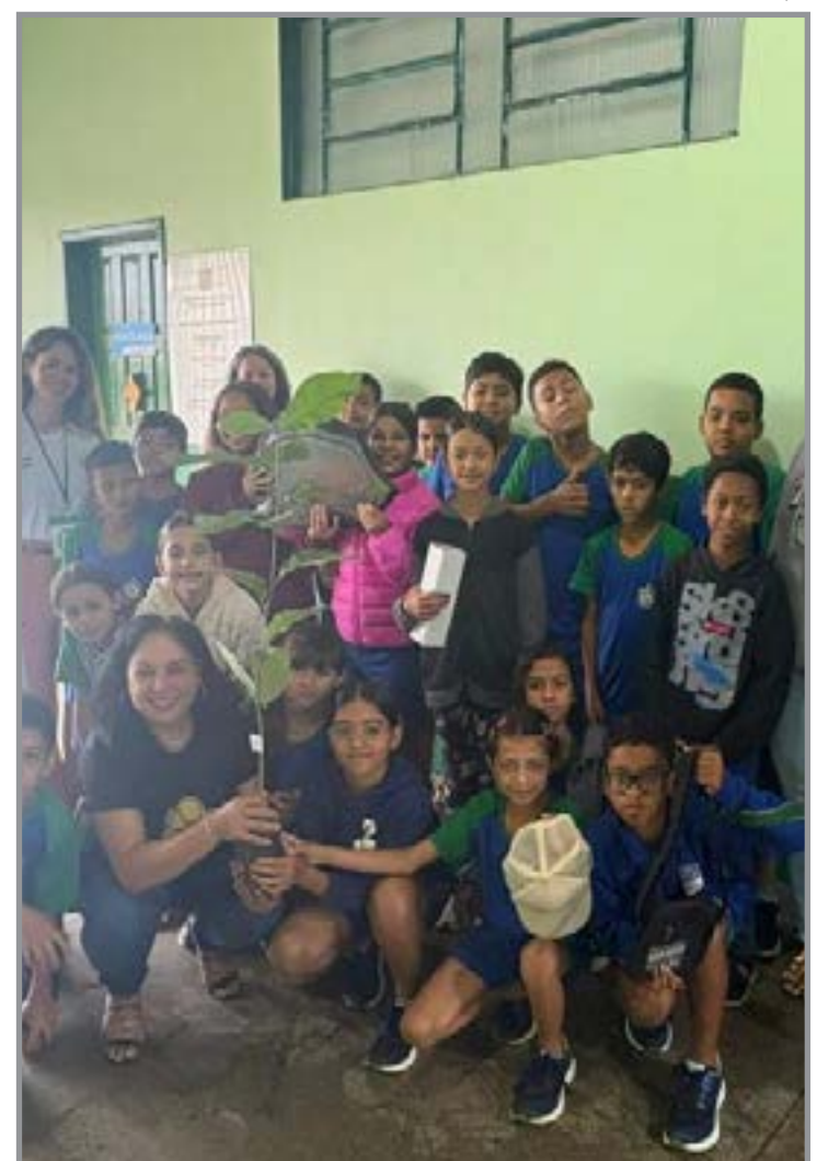
Alunos da Escola Selvino