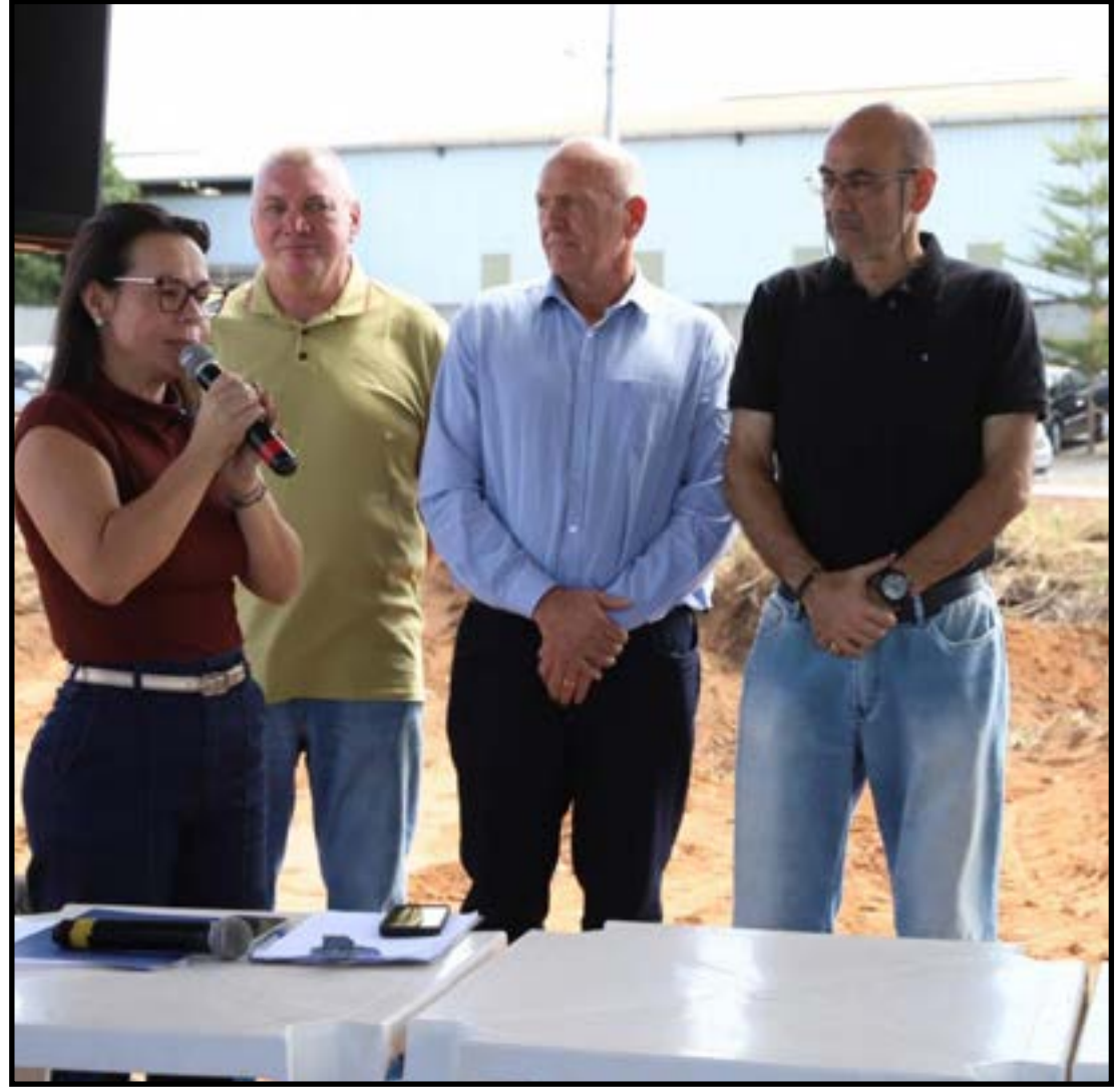
Iniciativa integra o Programa SER Família Habitação

“Estamos estruturando um programa habitacional permanente, aliado ao planejamento urbano e à expansão organizada da cidade. Aqui não estamos projetando apenas casas, mas uma nova região com infraestrutura, educação, saúde e serviços públicos para atender essas famílias com dignidade”, declarou.