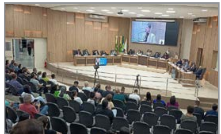
Secretários prestaram esclarecimentos em tribuna