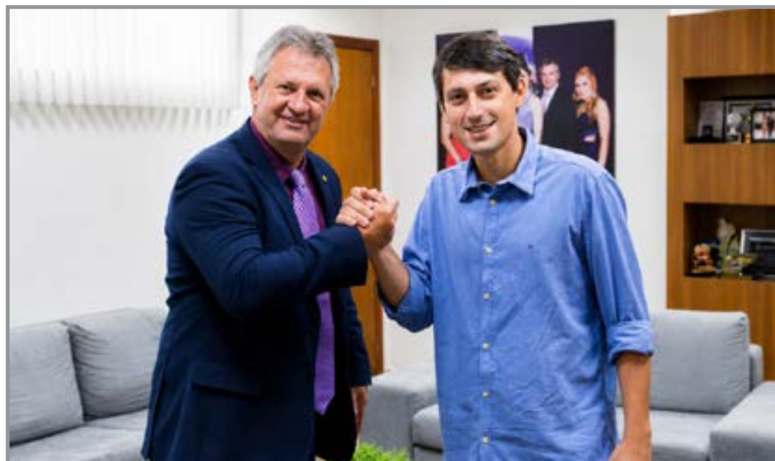
Município receberá R$ 1,8 milhão