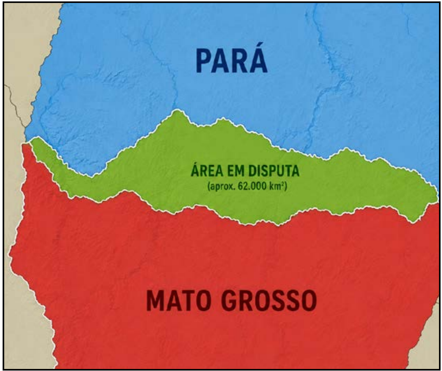
MT reforça defesa de área disputada no STF

O conflito envolve divergências históricas sobre a definição das divisas estaduais, principalmente em relação à localização de marcos geográficos utilizados na delimitação territorial da região Norte do país.