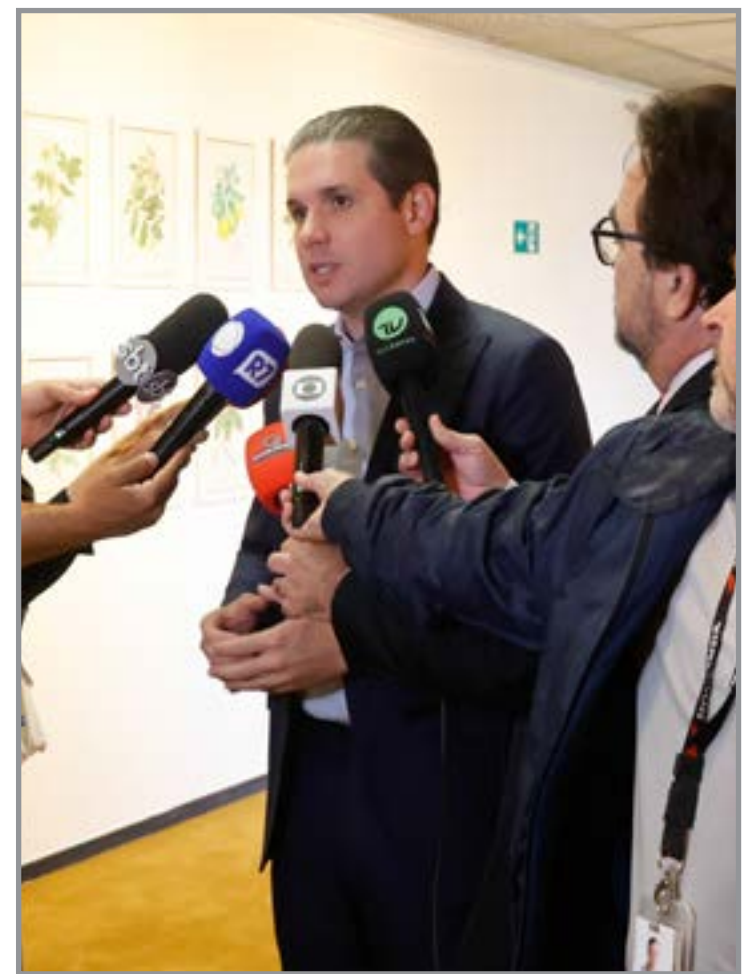
Setores terão tempo para se organizar