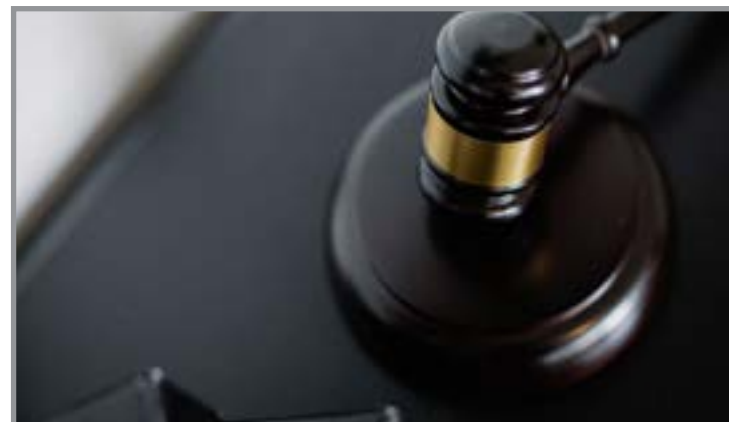
Evento deve contar com mais de 1,5 mil pessoas

As inscrições devem ser realizadas pelo portal allier-brasil.com.br/agrochemshow, por meio de doações de cestas básicas para a ONG Crê-Ser, de São Paulo. Em 2025, foram arrecadados 14 mil kg de alimentos.