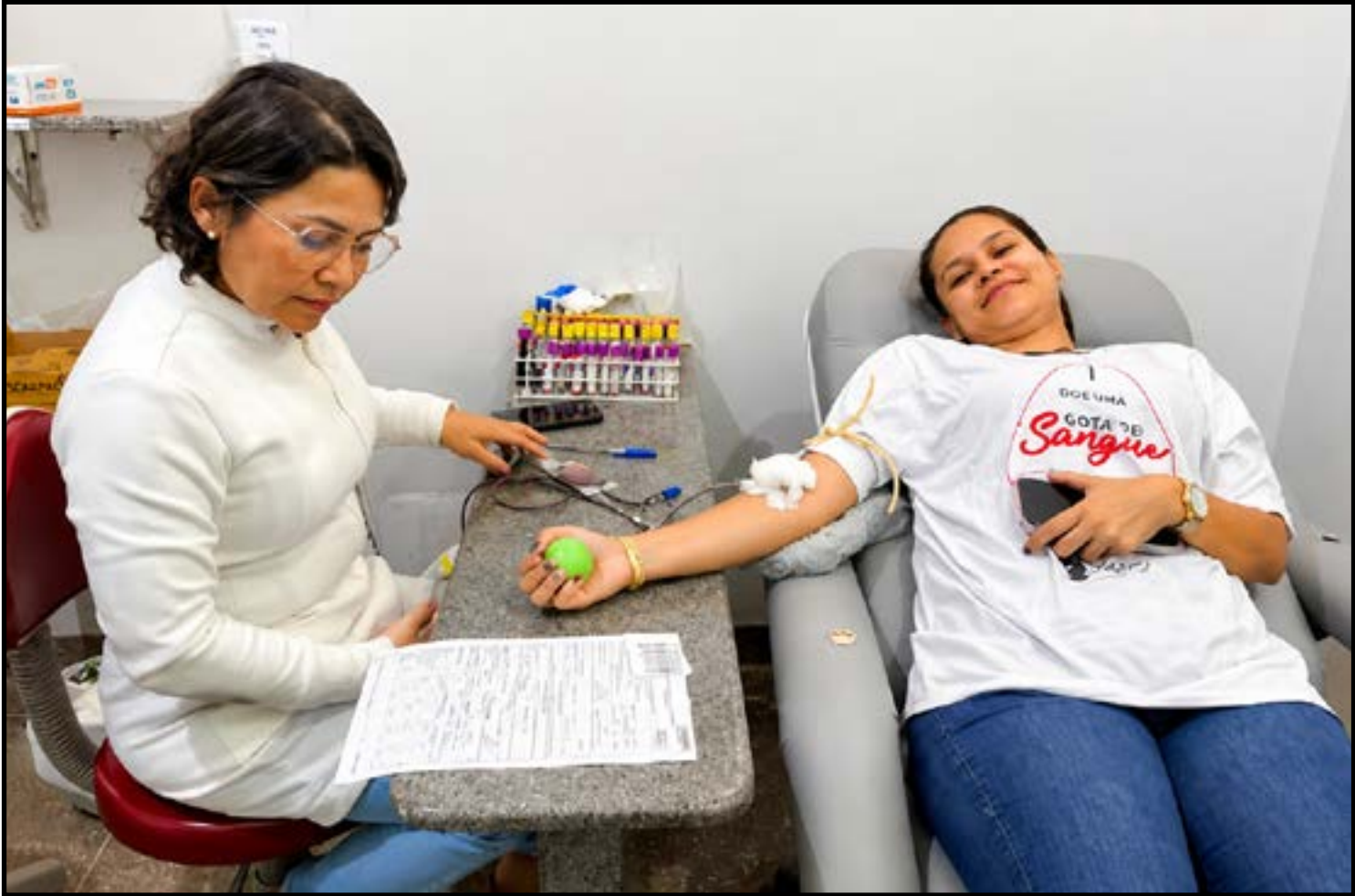
Doar sangue salva vidas

Para doar, é necessário apresentar documento oficial com foto e informar o CEP do