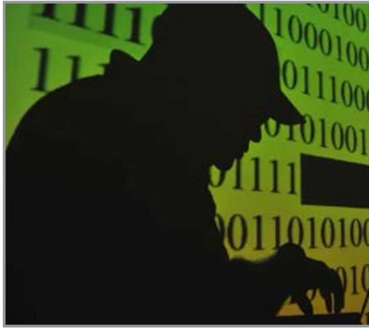
Promessa de dinheiro fácil e Pix são meios mais usados por golpistas

O estudo destaca ainda a necessidade de atuação conjunta entre plataformas digitais, instituições financeiras, órgãos públicos e usuários para ampliar a prevenção e o combate aos golpes online.