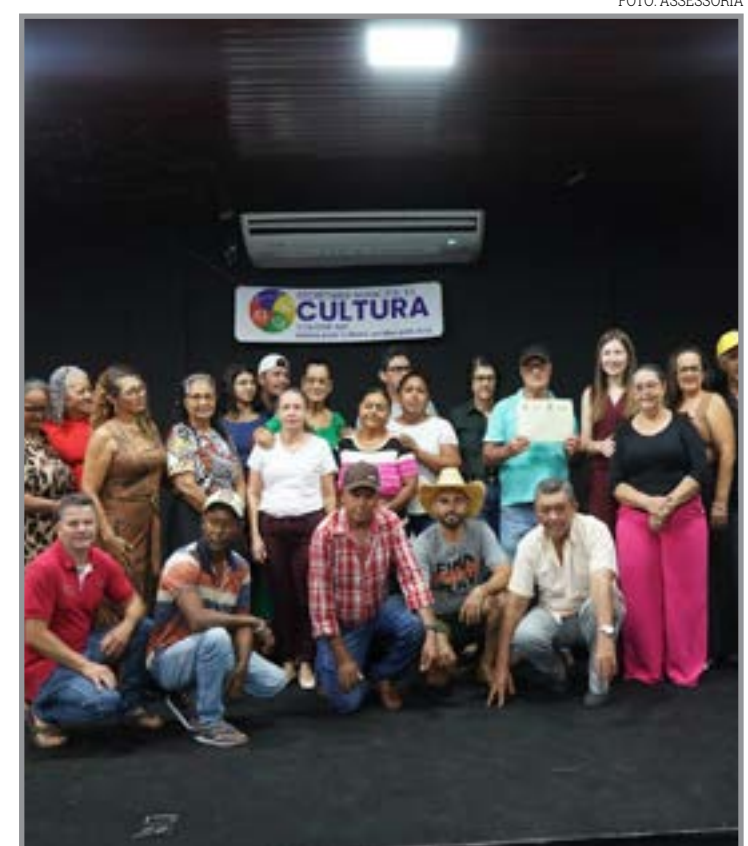
Cerimônia reuniu artistas, produtores e comunidade