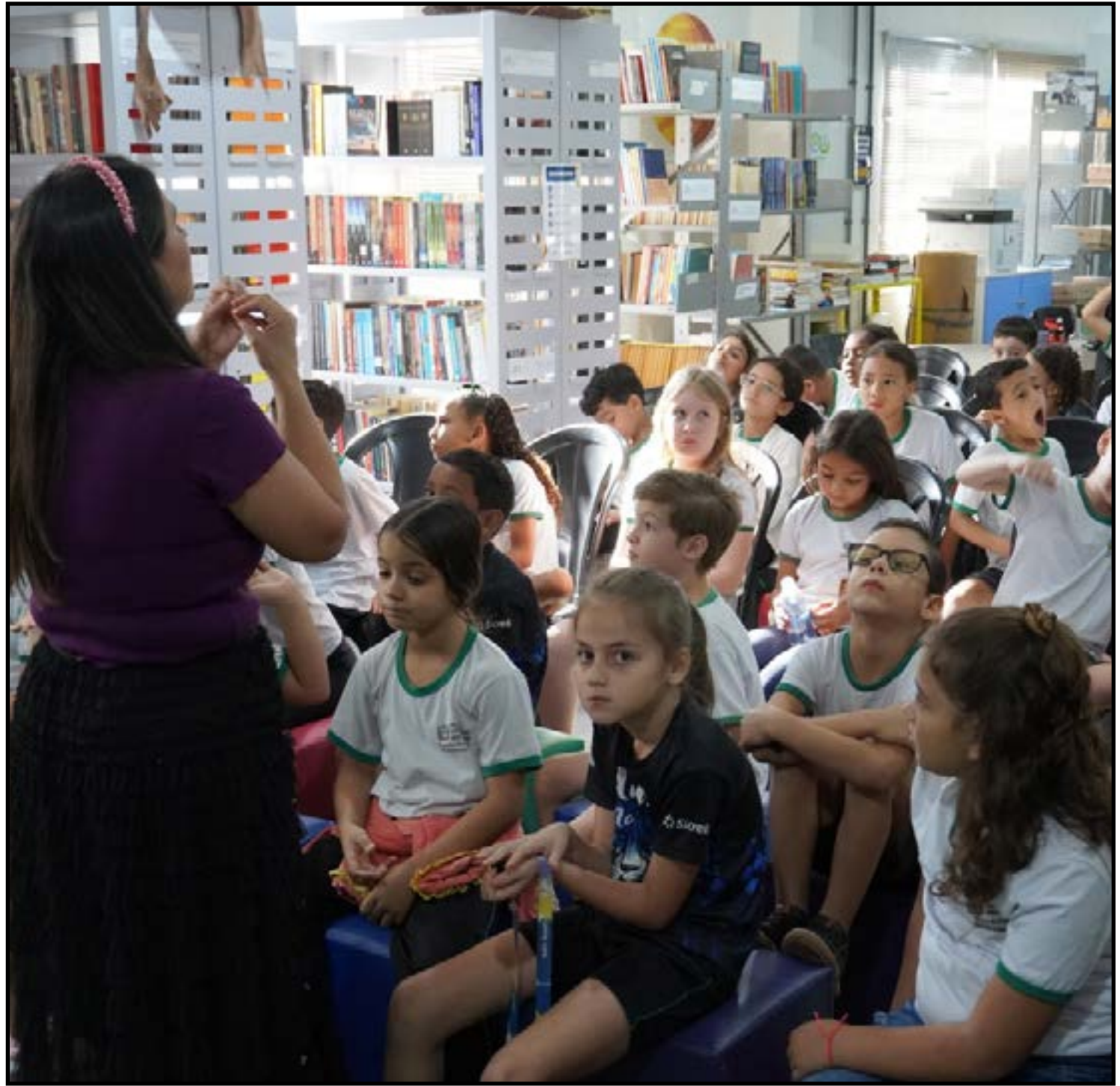
Certificação nacional em biblioteca em Lucas do Rio Verde

A certificação junto ao Sistema Nacional de Bibliotecas Públicas reforça o compromisso da Prefeitura de Lucas do Rio Verde com a valorização da cultura, da educação e do acesso democrático ao conhecimento, ampliando as oportunidades de desenvolvimento para toda a população.