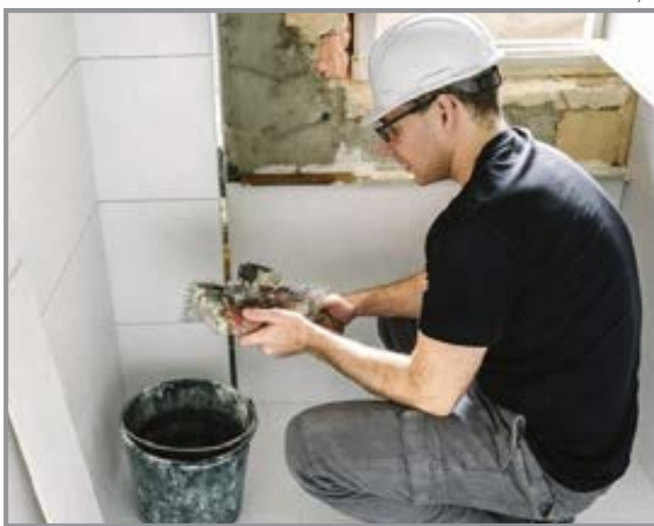
Programa Periferia Viva – Reformas

O programa contempla moradores de bairros como Alto da Glória, Bom Jardim, Belvedere, Dauria Riva, Jardim Aurora, Maria Vindilina I e II, Santa Rita, Região dos Vilas, Sebastião de Matos, entre outros. Mais informações podem ser obtidas no Setor de Habitação da Prefeitura ou pelo WhatsApp (66) 99235-4561.