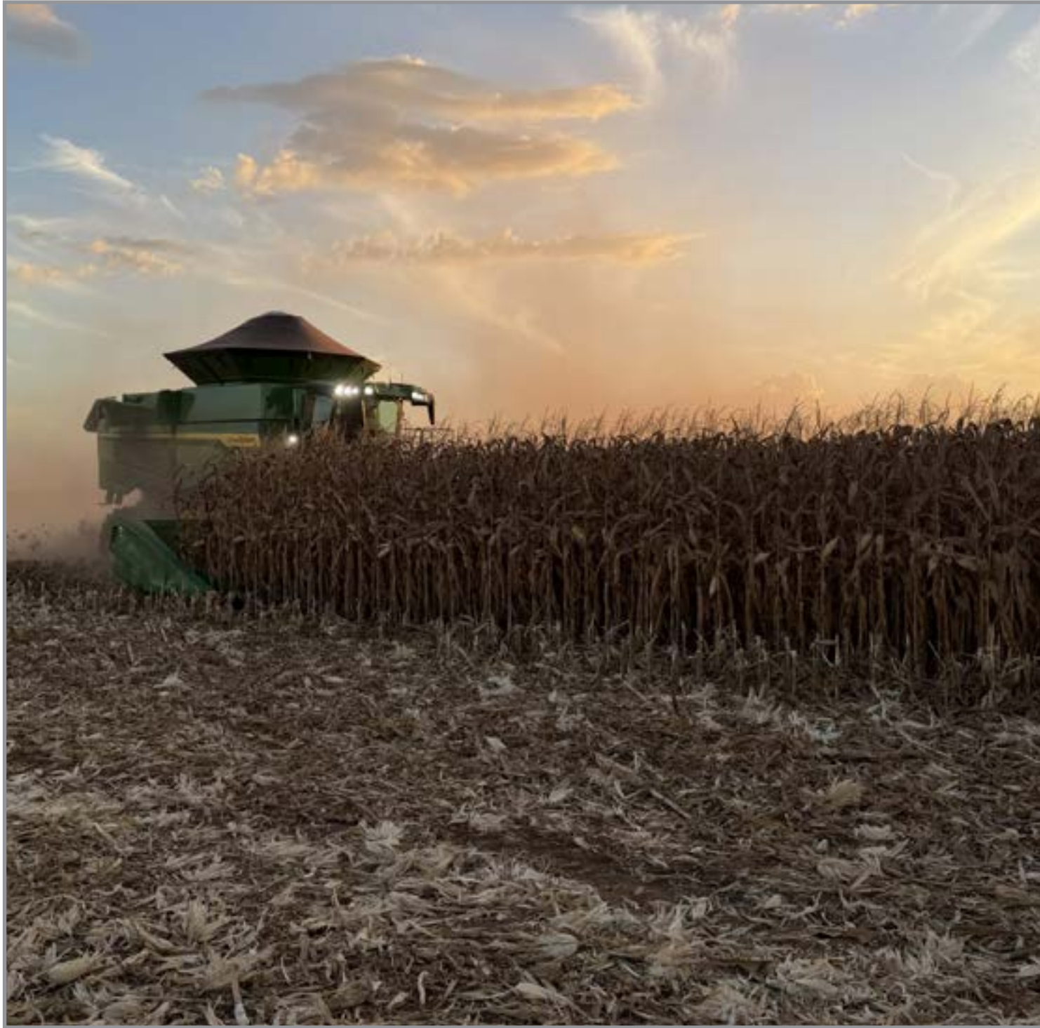
Fatores para reduzir riscos durante o período seco

"Em relação à safra 26/27, o cenário exige cautela devido ao impacto secundário do El Niño. Diferente da soja, onde o impacto é direto, no milho o fenômeno afeta a cultura de primeira safra, podendo comprometer a janela de plantio da segunda safra de milho. Somado a isso, o custo de produção apresentou alta, com o custeio estimado em maio atingindo R$ 3,8 mil por hectare", explica.