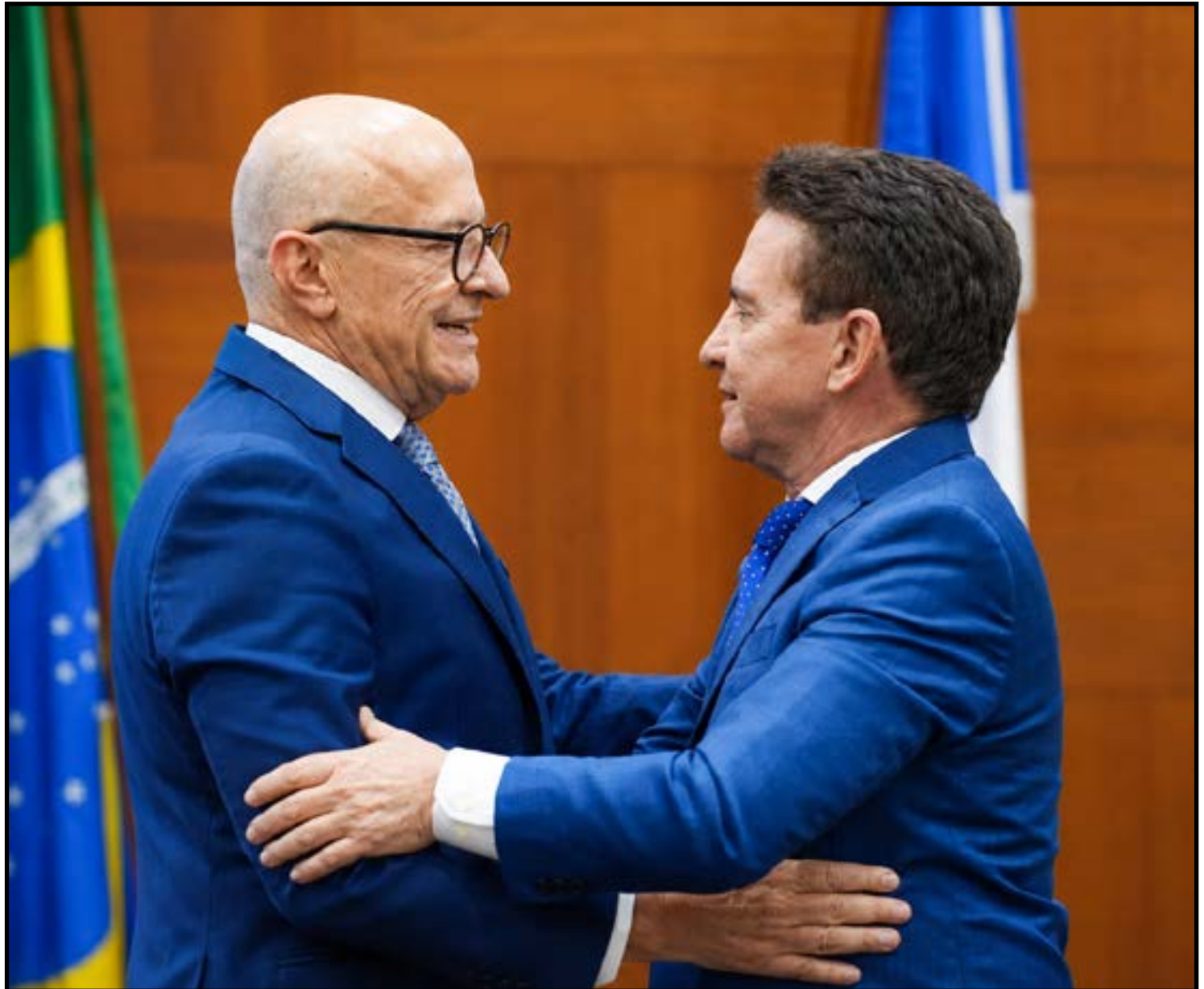
Infraestrutura vira foco de debate entre Estado e TCE

Pivetta também afirmou que o Estado adotará medidas jurídicas para responsabilizar empresas contratadas que não cumprirem os padrões exigidos. O tema ganhou repercussão política após manifestações do ex-governador Mauro Mendes, que também criticou a exposição pública das fiscalizações e defendeu que os questionamentos sejam discutidos dentro dos processos formais de controle. Além do aspecto técnico, o tema também ganhou dimensão política por envolver uma das principais vitrines da atual gestão estadual. A expansão da malha asfaltada e os investimentos em infraestrutura têm sido frequentemente apresentados pelo governo como um dos principais resultados alcançados nos últimos anos, especialmente em regiões que historicamente enfrentavam dificuldades de acesso e logística. Nos bastidores, a estratégia de Pivetta é preservar a relação institucional com o Tribunal de Contas sem abrir mão da defesa das obras executadas pelo Estado. Ao reconhecer problemas pontuais, mas destacar o volume de investimentos realizados, o governador busca equilibrar o discurso entre a necessidade de corrigir falhas e a manutenção do legado de infraestrutura construído pela atual administração.