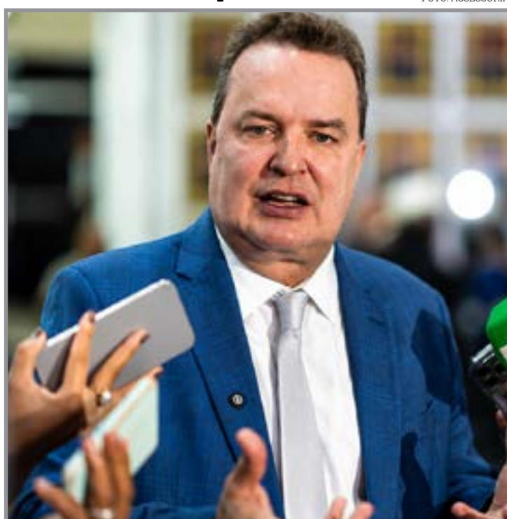
Podemos se coloca no jogo, mas sem exigir espaço

Para Max Russi, a prioridade neste momento é fortalecer o partido e manter o diálogo aberto com os dife-