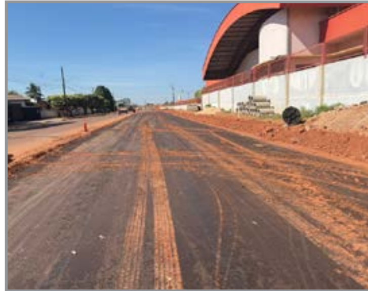
Tronco ligará Jacarandás à Rua Ênio Pipino avança para etapa de asfaltamento

Além da Rua Alberto Baranjak, o pacote de investimentos contempla intervenções em outras regiões estratégicas de Sinop, incluindo Bom Jardim (parcial), Estrada Dalva (parcial), Avenida Joaquim Socreppa e Avenida