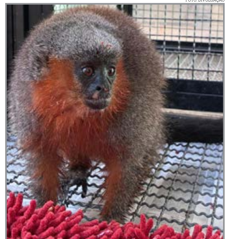
Local de soltura levou em conta critérios para melhor adaptação e sobrevivência