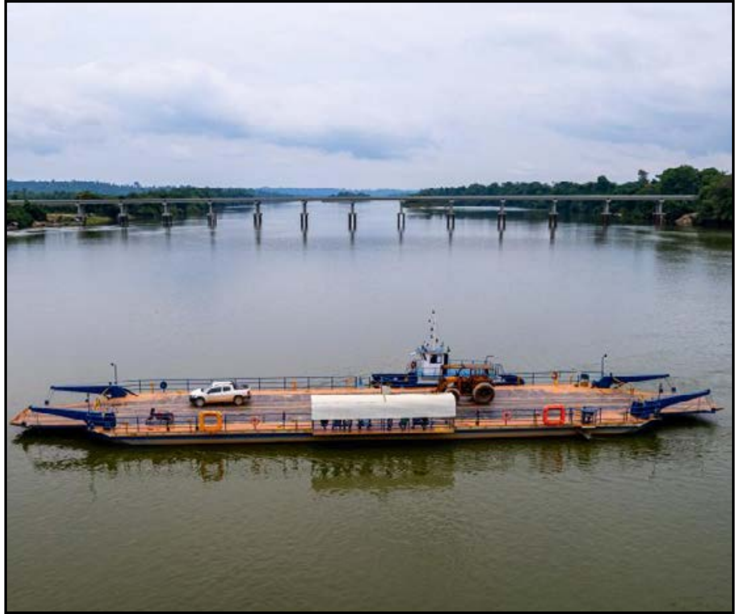
Novas pontes oferecem mais segurança aos usuários

“Atualmente há uma balsa nesse Rio que leva quase duas horas para ir e voltar, levando um caminhão por vez. Essa balsa para de funcionar quando escurece e só volta no dia seguinte. Quando a ponte for entregue, todo esse percurso vai durar poucos minutos. Será um ganho logístico enorme para