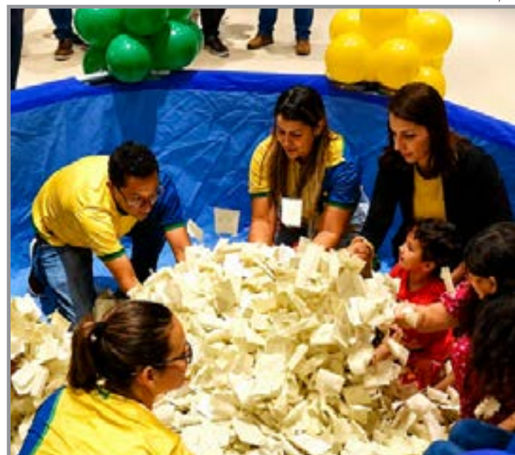
Sorteio realizado na última sexta