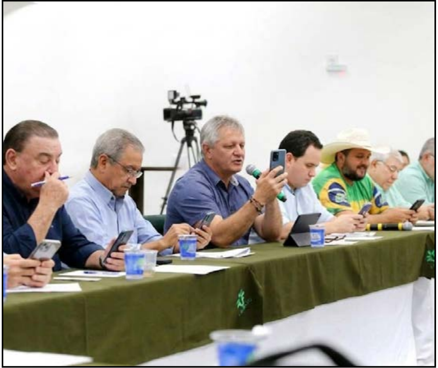
Pesquisa segue normas técnicas do IBGE, PNAD e TSE