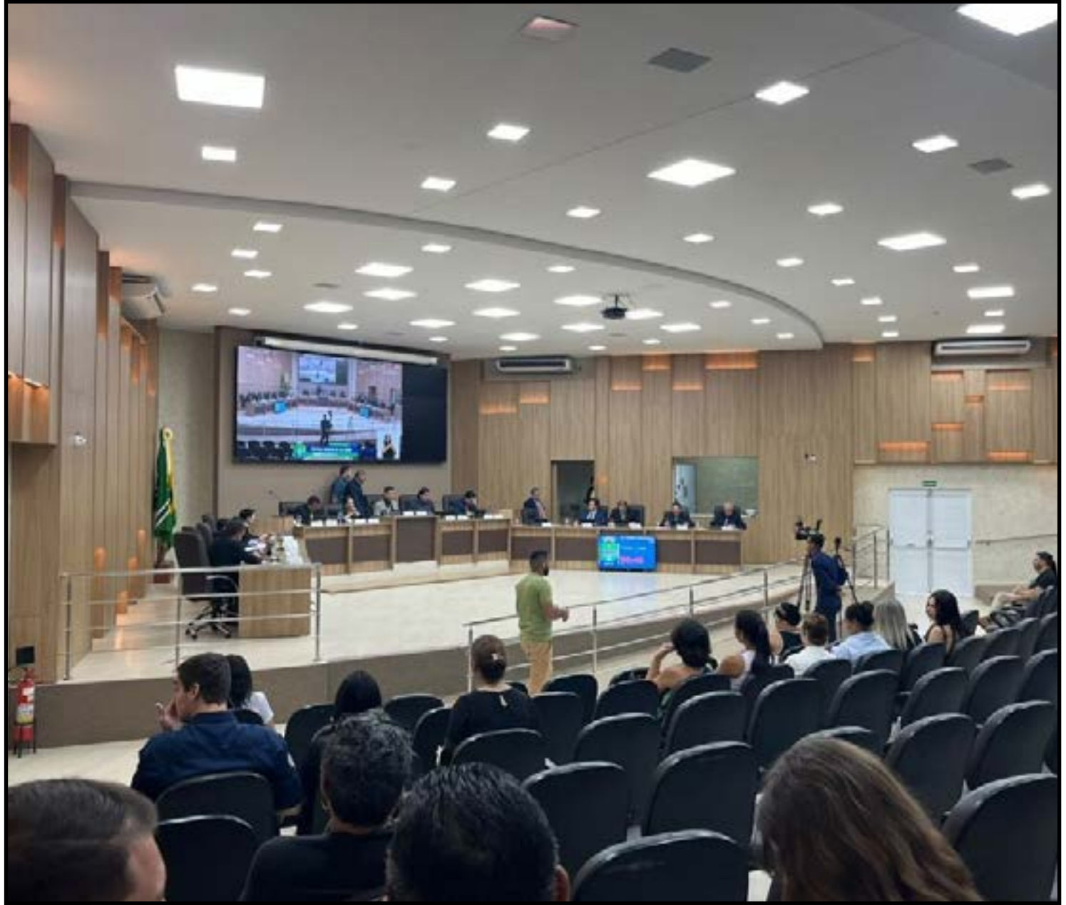
Apuração de possíveis irregularidades no Cemitério

Ao final dos trabalhos, a CPI deverá elaborar um relatório com as conclusões da investigação, podendo apontar eventuais responsabilidades e encaminhamentos aos órgãos competentes.