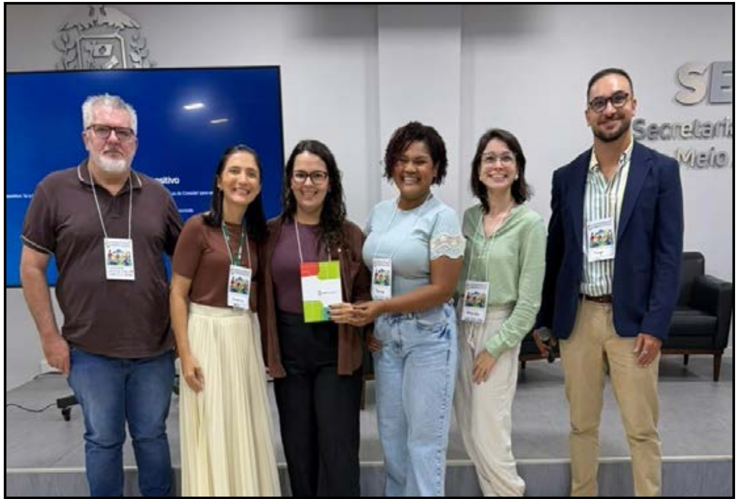
Preparar o município para os desafios climáticos