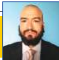
POR LEANDRO CARECA