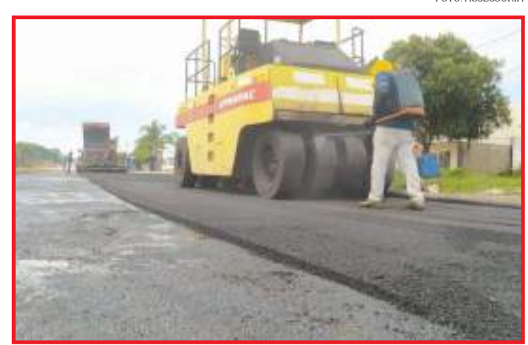
Prefeitura recapará vários pontos da cidade