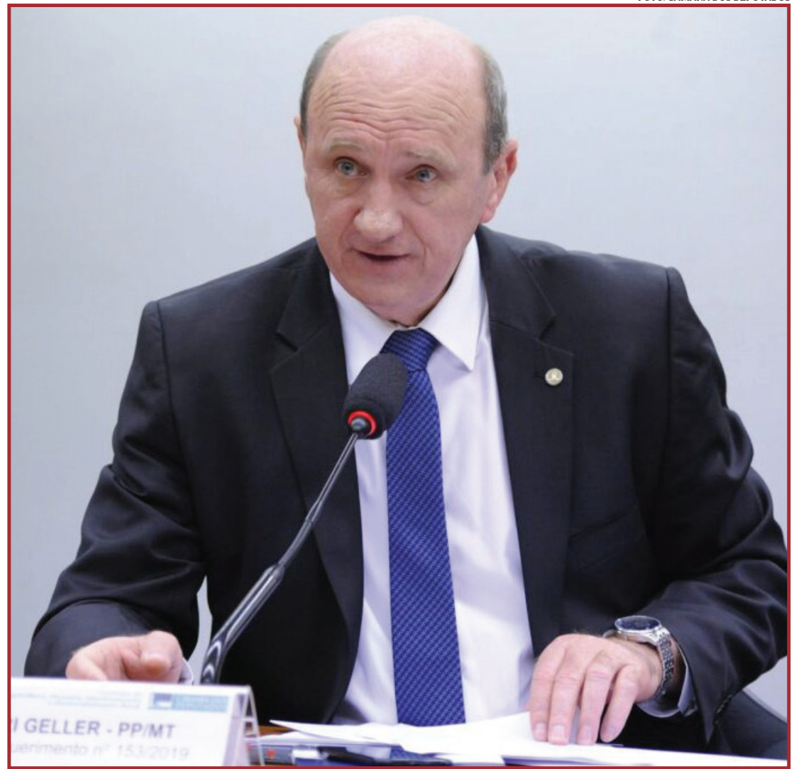
Geller teve seu mandato cassado pelo TSE por suposto abuso econômico

No prazo de dois meses estabelecido por Barroso, as 27 unidades federativas do País, assim como a Confederação Nacional dos Municípios e o Ministério da Economia terão de informar o impacto financeiro que será ocasionado pela medida. Ele questiona o Ministério do Trabalho e a Confederação Nacional dos Trabalhadores na Saúde se há riscos de demissões. No mesmo período, o magistrado quer que o Ministério da Saúde, os conselhos da área da saúde e a Federação Brasileira de Hospitais (FBH) forneçam informações sobre a possibilidade de fechamento de leitos e redução nos quadros de enfermeiros e técnicos.