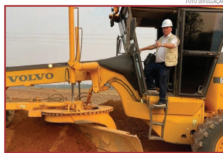
Lançada obra de pavimentação da Estrada Brígida

"A Associação nos procurou e o prefeito determinou que a gente entrasse nessa parceria. Temos maquinários bancados pelo município e também pela comunidade. O bota fora já foi feito e agora estamos entrando