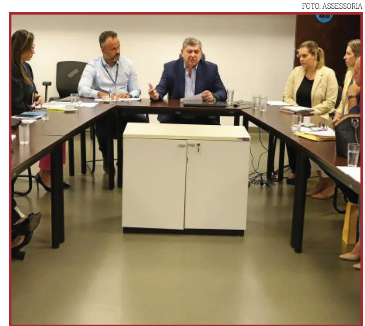
Objetivo é reduzir a fila de espera por procedimentos

O Programa Mais MT Cirurgias foi lançado em julho de 2021 com o objetivo de realizar 22,5 mil cirurgias, além de cerca de 70 mil exames de alta complexidade e 90 mil consultas ambulatoriais. Conforme a gestão estadual, o principal intuito é a redução da fila de espera por procedimentos eletivos no estado. O Comitê, por sua vez, detectou que as cirurgias não estão sendo executadas e, dessa forma, buscou representantes do Cosems-MT para entender o porquê, oportunidade em que o Conselho apontou os entraves burocráticos, mesmo após a SES-MT ter flexibilizado exigências.