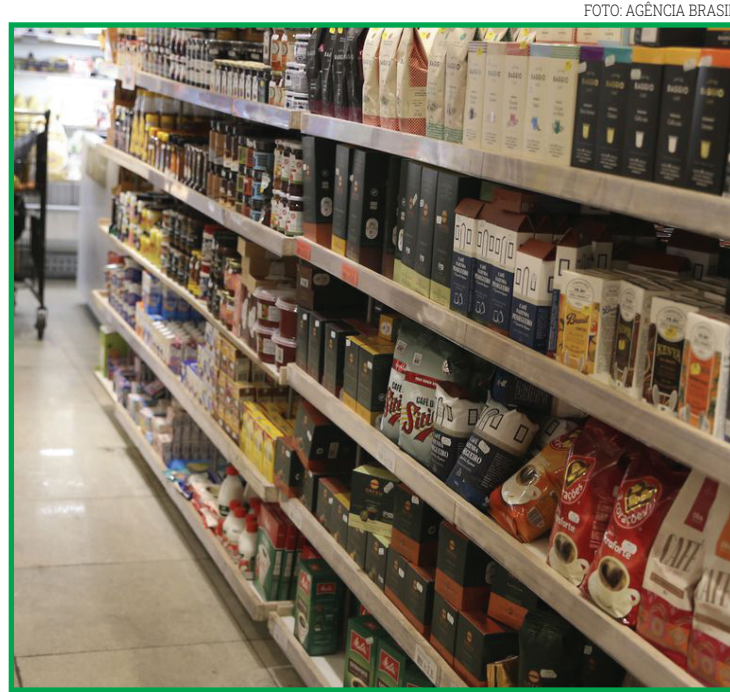
São Paulo registrou o valor mais alto; Aracaju, o mais baixo