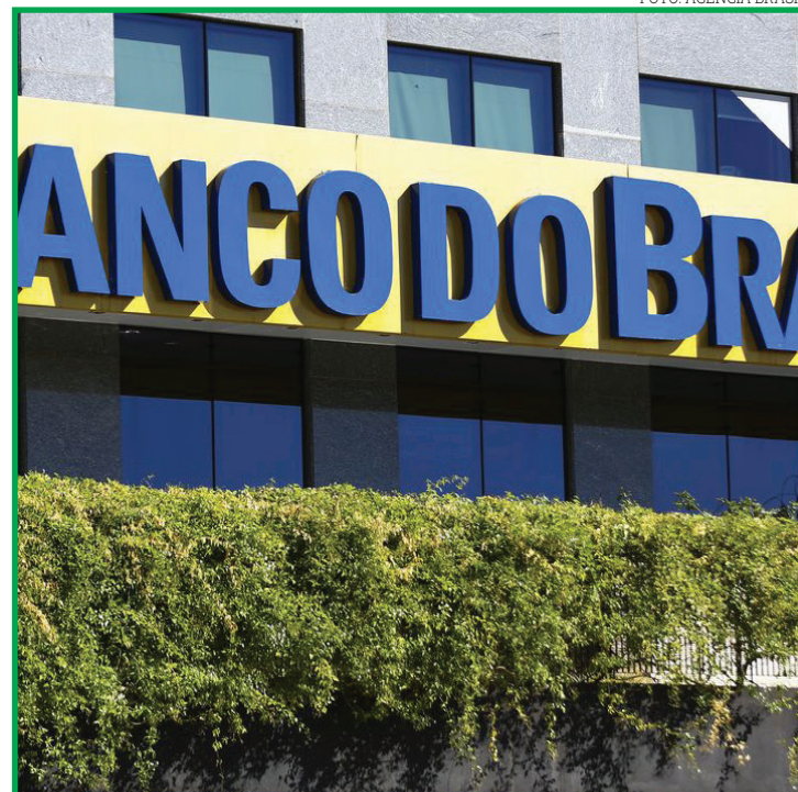
Serviço começou nesta semana

O usuário do aplicativo deve acessar, no menu Open Finance, a transação "Receber e transferir de outras instituições". Também é possível acessar a opção diretamente na solução Minhas Finanças, no "Extrato Multibanco". Nesse espaço, ele identifica se possui saldo em uma conta de outro banco e aciona a opção de transferência para o Banco do Brasil. A adesão ao Open Finance é feita pelo próprio aplicativo do banco. A adesão anterior ao compartilhamento de dados, no entanto, não é pré-requisito para utilizar o iniciador de pagamentos. A autorização ocorre durante o processo de transferência, pela autenticação e confirmação do cliente.