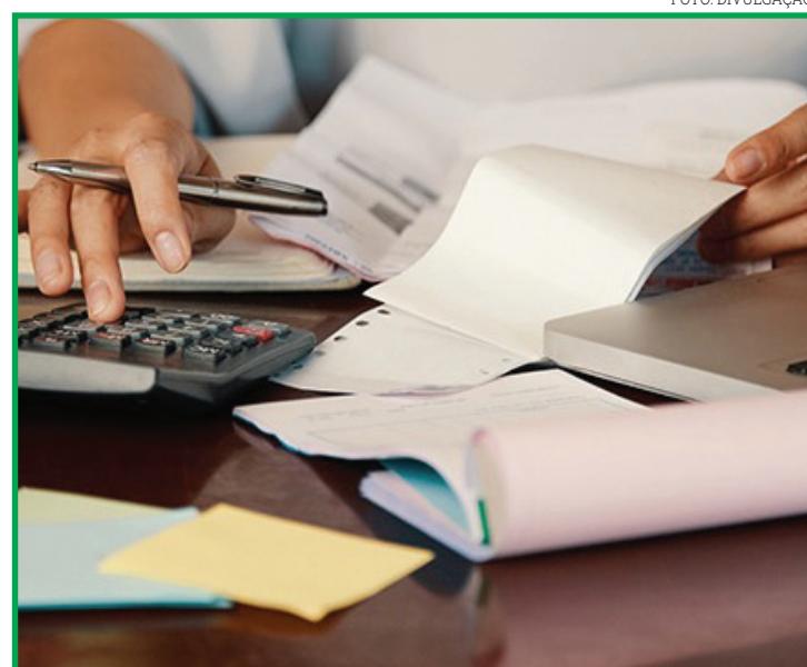
Os que ganham mais de 10 salários-mínimos são os mais endividados

A pesquisa revela, ainda, que os que ganham mais de 10 salários-mínimos são os mais endividados e os que ganham menos de 10 s.m. estão encontrando maiores dificuldades para pagar as contas. Mesmo assim, de forma positiva, segundo