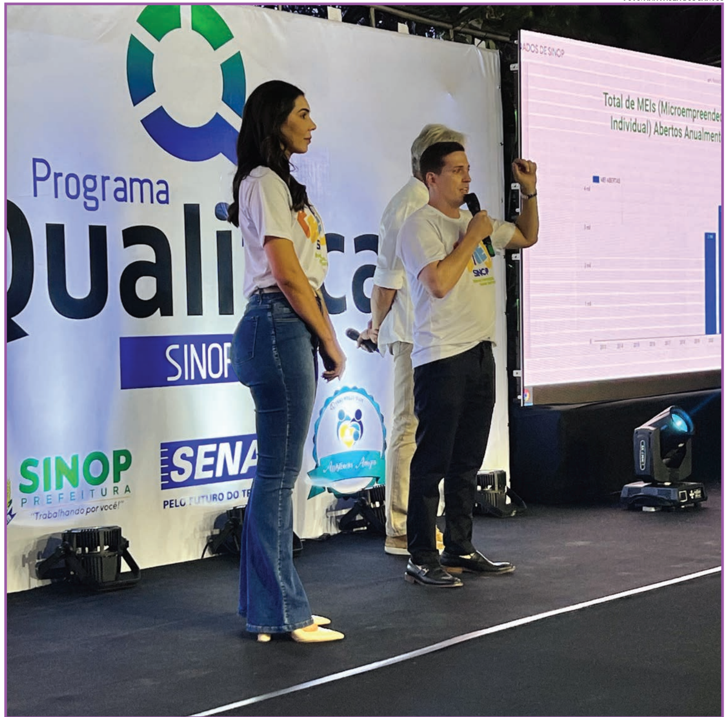
Programa ofertará vagas para os sinopenses