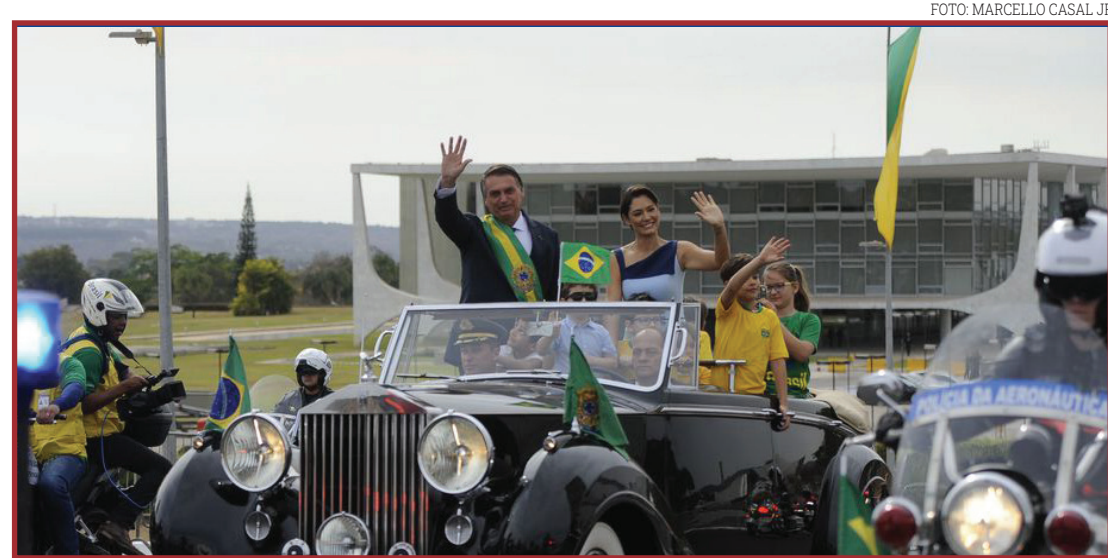
Presidente fez discurso na Esplanada após desfile do 7 de Setembro

Ao lado da primeira-dama, Michelle Bolsonaro, e do empresário Luciano Hang, o presidente disse que é obrigação de toda a população atuar conforme a Constituição. "É obrigação de todos jogarem dentro das quatro